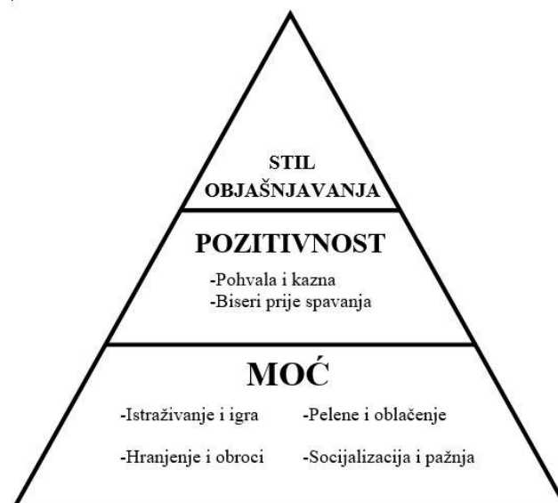
Slika 2: Piramida optimizma (prema knjizi Optimistično dijete )

Seligman objašnjava kako pesimistični ili optimistični stil objašnjavanja poprima svoj oblik do djetetove osme godine života. Da bi dijete postalo optimist potrebno je da svjesno odbaci stari način razmišljanja, tj. pesimistični i krene u pustolovinu učenja optimističnog. Dijete u svakom trenutku može promijeniti svoj stil objašnjavanja ako je fleksibilno i otvoreno ka promjeni. U prošlosti su možda bili pesimisti, ali ako pokušaju biti optimisti u budućnosti sigurno neće zažaliti (Seligman, 2005; prema Pavlić, 2014). „Stil objašnjavanja razvija se u djetinjstvu i postaje, ukoliko nema izravne intervencije, doživotan.” (Seligman, 2005, str. 45) Zato na odgojitelju leži odgovornost da promiče optimizam u odgojno-obrazovnoj ustanovi svojim primjerom te da svoj pogled na svijet prenese djeci kako bi i ona mogla sudjelovati u stvaranju ljepšeg mjesta za život. Kod male djece optimizam se može poučiti pomoću 3 principa, a to su: moć, pozitivnost i stil objašnjavanja (Seligman, 2005).