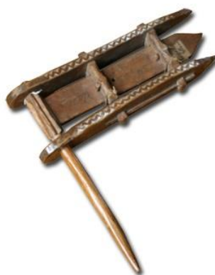
Slika 41. Čegrtaljka (Hrvatska tradicijska glazbala, 2016)

Ovoj vrsti glazbala pripadaju razne zvečke, udaraljke (udarci kožnim potplatom čizme o pod, metalnim predmetom o potkovu), pucketaljke (bič, kožni remen), klepetaljke, strugaljke, drvene čegrtaljke škrebetaljke i zvona. Škrebetaljka se koristila za zvonjenje umjesto zvona u Velikom tjednu, a zvuk se proizvodi neprestanim okretanjem pomičnog dijela, držeći nepomičnu os (Virtualni muzej tradicijske glazbe Međimurja, 2016).