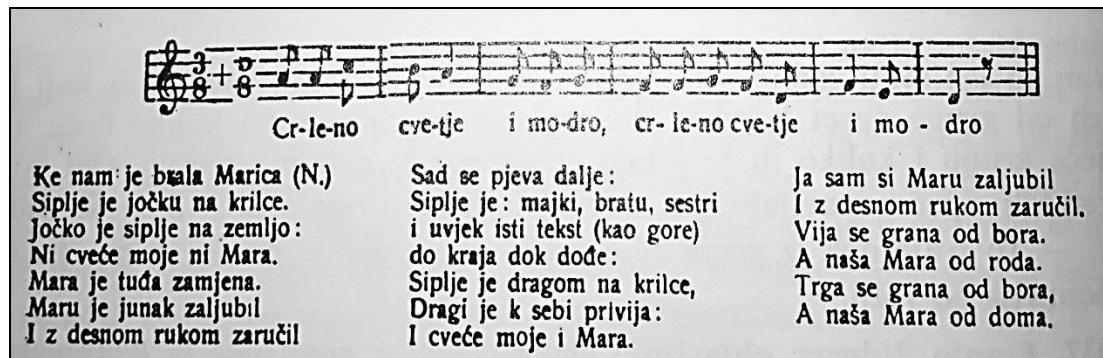
Slika 23. Zapis pjesme (Podravina) Crle-no cve-tje i mo-dro (Ivančan, 1989: 44)

Kada su vijenci bili ispleteni, a pjesma otpjevana, plesale su kolo (snahe i djevojke) na sljedeći napjev: