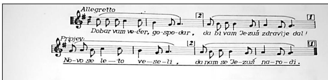
Slika 3. Zapis pjesme (Međimurje) Dobar vam večer, gospodar (Žganec, 1990: 131)

Običaj darivanja bunara ( zdenca ) na Novu Godinu razlikuje se u svakom kraju. U Međimurju su djevojke bacajući jabuku, govorele su: „Zdenec koplenc, / Ja tebi dara, / Ti meni para, / Da vidim dodna, / Za zamoš sam godna“ (Hranjec, 2011: 64). Značenje posljednjeg stiha znači da je djevojka spremna na udaju s obzirom na svoju dob (Hranjec, 2011).