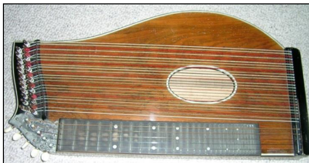
Slika 39. Citra

„Tradicijska glazbala su bordunska citra ( trontole ) i cimbal, često udružen s gudačkim glazbalima u mješovite sastave ( goslari ). Nakon pripojenja Međimurja Hrvatskoj (1918.), zamijenili su ih tamburaši i sastavi limene glazbe ( bandisti )“ (Marošević, 200?).