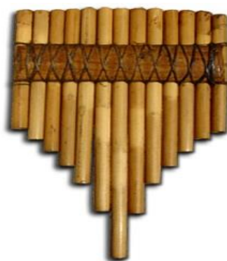
Slika 37. Trstenice (Hrvatska tradicijska glazbala, 2016)

„Trstenice su izrađivane od komadića trstike različite dužine, a specifičnost i neobičnost hrvatskih trstenica je u tome što su najduži komadi trstike stavljeni u sredinu, a najkraći na oba kraja. Po tome se trstenice razlikuju od ostalih tipova panovih svirala. Jedna od prednosti ovakvog načina izrade je mogućnost sviranja više različitih tonaliteta na jednom glazbalu što je rijetkost u folklornoj tradiciji“ (Hrvatska tradicijska glazbala, 2016).