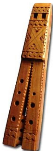
Slika 32. Dvojnice (Hrvatska tradicijska glazbala, 2016)

Sluškinja se izrađivala u Hrvatskom zagorju, a razlikuje se od dvojnice po tome što na lijevoj strani nema ni jedne rupice za prebiranje dok na desnoj strani ima šest rupica (Hrvatska tradicijska glazbala, 2016). „Nekada se na sluškinju sviralo kao na jedinku, s time da bi se u toku svirke, u zgodnom trenutku puhnuo i taj “lijevi”, osnovni, ton svirale“ (Hrvatska tradicijska glazbala, 2016).