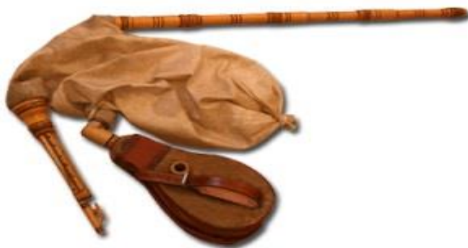
Slika 30. Četveroglasne dudu s laktačom (Hrvatska tradicijska glazbala, 2016)

ustima. Prije otprilike sto godina počeo se upotrebljavati posebni, dodatni mijeh ( laktača, sufla, sufra ). Laktača je s vremenom postala zaštitni znak dudu, premda su postojale gajde koje su bile svirane s laktačom , a i dudu u koje se zrak upuhivao puhaljkom (Hrvatska tradicijska glazbala, 2016). „Prednost upotrebe laktače je u tome da dudaš ili gajdaš može istovremeno i svirati i pjevati, a čime se u tadašnje vrijeme htjelo konkurirati sve većoj navali novih i, tada, atraktivnijih glazbala (violina, tambure, harmonika, itd.)“ (Hrvatska tradicijska glazbala, 2016).