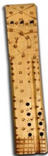
Slika 34. Trojka (Hrvatsko zagorje) (Hrvatska tradicijska glazbala, 2016)

Trojka (trojnica) je nastala kombinacijom dvojnice i sluškinje, a nekada se izrađivala u Hrvatskom zagorju (Hrvatska tradicijska glazbala, 2016). „U jednom komadu drveta su provrtana tri provrta, lijevi nema rupica za prebiranje, srednji ima tri (ili četiri), a desni četiri (ili pet)“ (Hrvatska tradicijska glazbala, 2016). Svira se kao i na instrument sluškinju – prvo dvojnice, a treći ton se povremeno dodaje tijekom svirke (Hrvatska tradicijska glazbala, 2016).