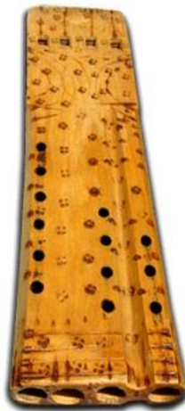
Slika 35. Četvorka (Hrvatska tradicijska glazbala, 2016)