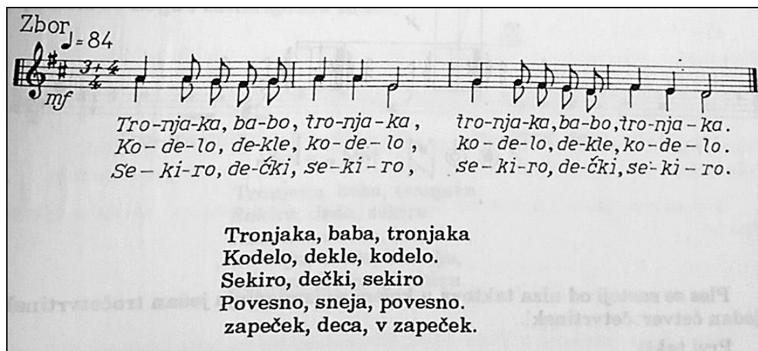
Slika 25. Zapis pjesme (Podravina) Tronjak (Ivančan, 1991: 323)

Nazdrave i daje nalog zastavniku da su svi slobodni, što znači da mogu ići plesati, a tada zaručnik i zaručnica prvi puta plešu (Ivančan, 1989). Galenić navodi da mladencima nije bilo dozvoljeno zajedno plesati sve dok nisu oženjeni (Galenić, 1995). Prema Ivančanu, navedena pjesma pjeva se i kada dođu iz crkve pa sjednu za stol. Podsnehalje tu večer prišiju vince na škrljake (šešire) i kapute, a zaručnica određuje koji se kome prišije (Ivančan, 1991). U Međimurju, prije nego su otišli u crkvu na vjenčanje, pod snehalja je dijelila cimere ili su ih morali „otkupiti“ i tako se prikupljao novac za mladenku (Hranjec, 2011). Otkupljivanje cimera bilo je i u Podravskim mjestima, dan prije vjenčanja, žene su pokušale dobiti što više novaca jer je to bio novac za mladence (Ivančan, 1989). Osim cimera , pripremala se zastava (Ivančan, 1989). Oko jedanaest sati završilo je druženje (Ivančan, 1989). Galenić navodi kako je mladić nakon cimera imao momačku večer tj. nastavilo se druženje u mladićevoj kući (Galenić, 1995).