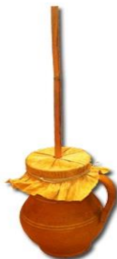
Slika 40. Lončani bas (Hrvatska tradicijska glazbala, 2016)

Lončani bas ( prda, ćupa, brunda, brundalo, mrgudalo ) ritmički instrument koji je u sjeverozapadnim krajevima Hrvatske zamjenjivao bas. Instrument čini glineni ćup na kojem je preko otvora navučen životinjski mjehur ili koža, a na sredini tog mjehura ili kože je pričvršćen drveni štapić ili trstika. Povlačenjem navlaženih prstiju (ili komadićem vlažne spužve ili tkanine) gore dolje po štapiću, dobije se ritmički zvuk (Hrvatska tradicijska glazbala, 2016).