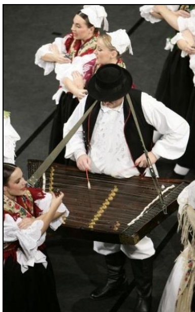
Slika 38. Cimbal

Cimbal i citra razlikuju se u izgledu i načinu sviranja. Cimbal se sastoji od drvene rezonantne kutije, najčešće trapezoidna oblika na kojoj je napeto osamdesetak do stotinu žica ugođenih po skupinama, obično dvije ili više njih na isti ton (Miholić, 2003). Žice su s jedne strane fiksno pričvršćene, dok vijci na suprotnoj strani omogućuju ugađanje. Svira se naizmjeničnim udaranjem drvenim batićima omotanim tkaninom po žicama. Udaranjem batića o žicu možemo dobiti mekši i grublji ton. Dio batića koji je omotan tkaninom ili vatom i koncem, dobivamo mekši ton. Za grublji ton se koriste neopleteni batići ili se svira dijelom batića koji se inače drži u ruci. Može se svirati položen na stol ili na stalku, a prilikom sviranja u hodu, cimbal je obješen na remen ( gurta ) oko sviračeva vrata (Miholić, 2003, 10. 9. 2016.). U Međimurje u 19. stoljeću donijela ga je mađarska romska obitelj, odakle se proširio na Podravinu i Hrvatsko zagorje (Virtualni muzej tradicijske glazbe Međimurja, 2016).