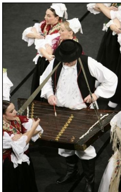
Slika 38. Cimbal (Virtualni muzej tradicijske glazbe Međimurja iz foto-arhiva Lado, 2016)

Cimbal i citra razlikuju se u izgledu i načinu sviranja. Cimbal se sastoji od drvene rezonantne kutije, najčešće trapezoidna oblika na kojoj je napeto osamdesetak do stotinu žica ugođenih po skupinama, obično dvije ili više njih na isti ton (Miholić, 2003). Žice su s jedne strane fiksno pričvršćene, dok vijci na suprotnoj strani omogućuju ugađanje. Svira se naizmjeničnim udaranjem drvenim batićima omotanim tkaninom po žicama. Udaranjem batića o žicu možemo dobiti mekši i grublji ton. Dio batića koji je omotan tkaninom ili vatom i koncem, dobivamo mekši ton. Za grublji ton se koriste neopleteni batići ili se svira dijelom batića koji se inače drži u ruci. Može se svirati položen na stol ili na stalku, a prilikom sviranja u hodu, cimbal je obješen na remen ( gurta ) oko sviračeva vrata (Miholić, 2003, 10. 9. 2016.). U Međimurje u 19. stoljeću donijela ga je mađarska romska obitelj, odakle se proširio na Podravinu i Hrvatsko zagorje (Virtualni muzej tradicijske glazbe Međimurja, 2016).