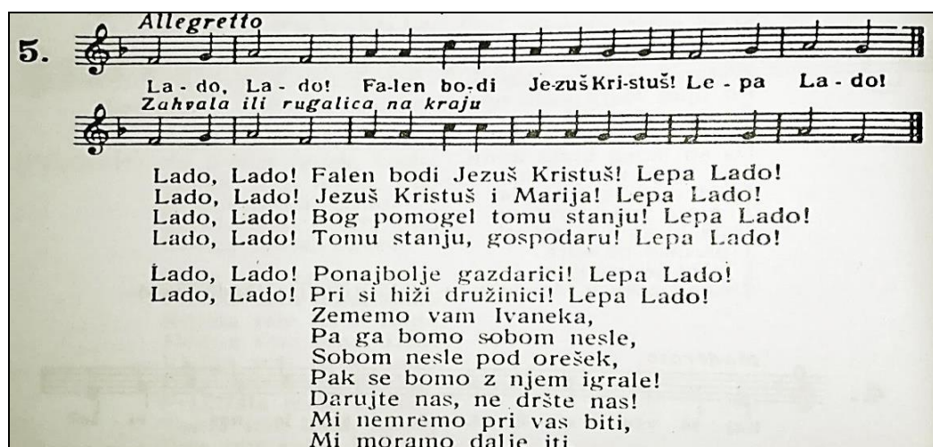
Slika 21. Zapis pjesme (Podravina) Lado, Lado (Ivančan, 1989: 66)