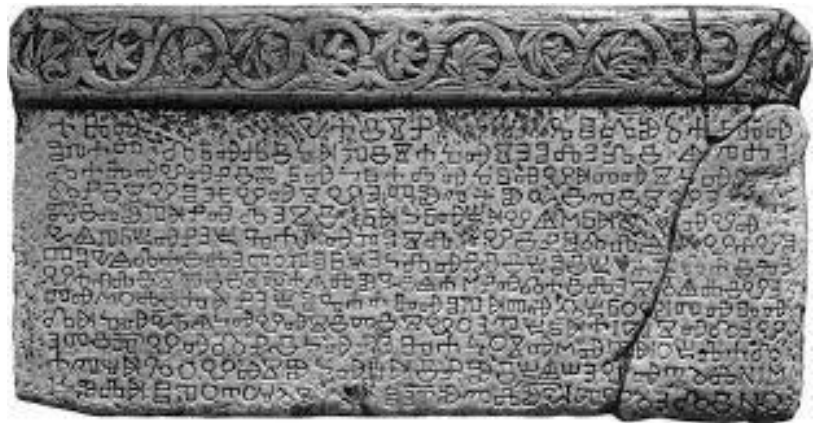
slika 1. Baščanska ploča