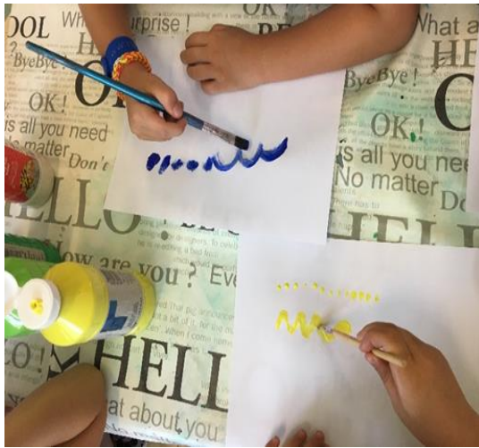
Slika 31. Crtež popraćen glazbom u nastanku