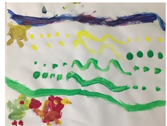
Slika 35. i 36. Crtež popraćen glazbom, djevojčice, 5.5 godina