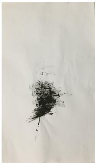
Slika 23. Crtež pera, dječak, 4 godine

Za vizualne poticaje primijenjena je crtačka tehnika tuš u boji. Zadatak je bio nacrtati pero koje ih se najviše dojmilo bojom i oblikom. Djeci su materijali, odnosno pera ostavljena na zasebnom stolu, kao pomoć pri crtanju, ako se žele prisjetiti detalja na koji su zaboravili.