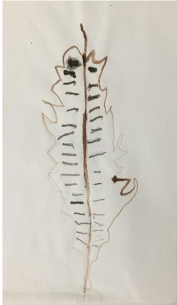
Slika 25. Crtež pera, djevojčica, 5.5 godina