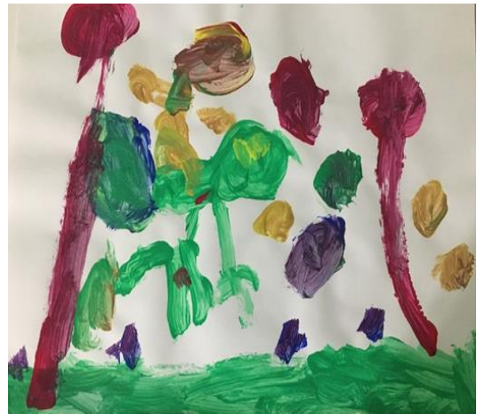
Slika 34. Crtež popraćen glazbom, djevojčica, 5 g.