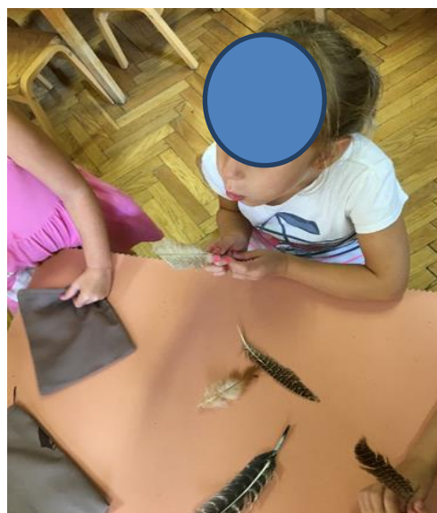
Slika 16. Reagiranje pera na puhanje