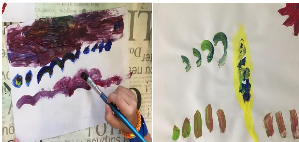
Slika 29. Crtež popraćen glazbom, dječak, 6 godina Slika 30. Crtež popraćen glazbom, djevojčica, 5 godina

Uvođenje djece u nevizualnu likovnu aktivnost, slikarskom tehnikom temperama, započelo je pitanjem: „Kako se glasaju ptice?” Djeca su raznim zvukovima dočarala glasanje pojedinih ptica, a zatim je, kao poticaj, reproducirana glazba „Cvrkut ptica – opuštajući zvuci iz prirode”. Opuštajući zvuci pjeva raznih vrsta ptica u djeci su budili maštu. Zadatak je bio da djeca sklope oči i pažljivo slušaju cvrkut ptica, šuštanje lišća, ili žuborenje vode. A zatim, kad je glazba iznova bila puštena, djeca su trebala naslikati kako bi taj zvuk koji čuju mogao izgledati.