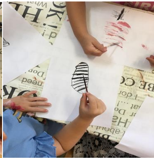
Slika 28. Crtež pera, djevojčica, 5.5 godina

Razlika u crtanju je vidno primjetljiva jer se radi o mješovitoj skupini djece. Vidljivo je da su djeca u dobi od 5 godina prepoznala oblike i primijetila samo određene detalje, ali starija djeca, u dobi 6-7 godina, pravilno su crtala oblik, upotrebljavala odgovarajuće boje i primjećivala sitne detalje jer su oblike željela prikazati na što realističniji način. Crteži djece u dobi 3-4 godine odaju kako djeca te dobi nisu