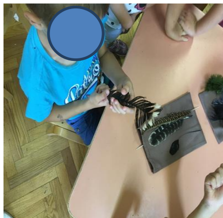
Slika 19. Mijenjanje izgleda pera opipom