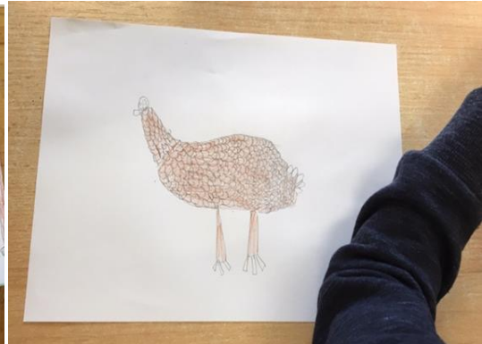
Slika 12. Crtež ptice, dječak, 6 godina