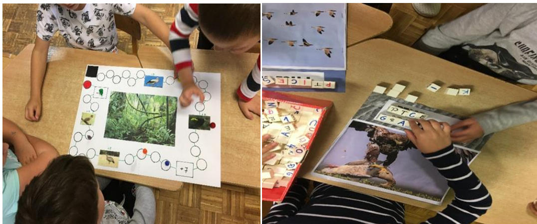
Slika 7. Društvena igra na ploči