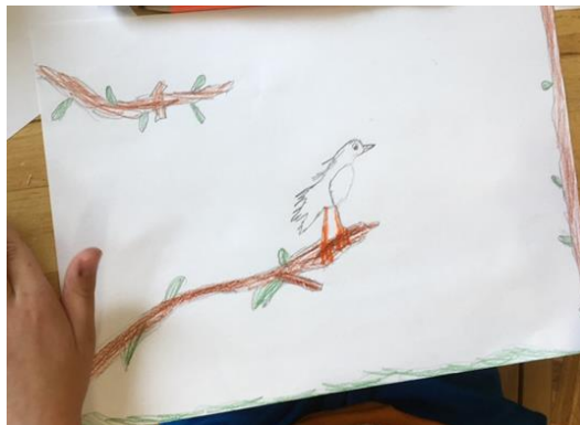
Slika 11. Crtež ptice, dječak, 7 godina