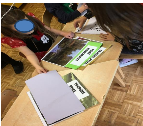
Slika 5. Proučavanje slikovnica