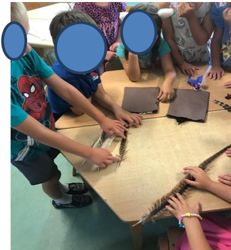
Slika 20. Istraživanje i uspoređivanje veličine

Također, djeca su uspoređivala veličinu perja drukčijih vrsta ptica. Ova aktivnost potakla je djecu na međusobno komuniciranje i zajednički rad gdje su složno promatrali razlike i razmjenjivali primijećene činjenice. Naime, shvatili su da je pero pauna i fazana iste veličine, ali da se razlikuje u izgledu i bojama. Proučavali su razliku između velikog i malog pera fazana pri čemu su svi složno zaključili da je razlika samo u veličini. Razlike među djecom bitno su vidljive u uspoređivanju. Pri dodirivanju gušćjeg pera petogodišnje dijete uočilo je razliku u tvrdoći pera pri čemu je komentiralo da osjeća kao da je pero napravljeno od plastike, a drugo dijete bijelo gušće pero zamijenilo je za pero galeba. Isto tako, djecu se nastojalo fokusirati i na izgled pera, postavljajući im pitanja koja su se odnosila na usporedbu boja različitog perja, pri čemu su djeca došla do zaključka da pera mogu biti raznobojna. Kod starije djece uočeno je da više primjećuju detalje, a primjer tomu je da su starija djeca u dobi 5-6 godina primijetila da pero papige nije samo zelene boje, već da je načinjeno i od točkica. Dijete od 4 godine primijetilo je samo crnu boju na peru pijetla dok je šestogodišnjak primijetio da se pero presijava i u srebrno-zelenkasto boji. Isto tako, mlađu djecu treba ohrabriti pitanjima dok starija djeca ispituju što ih zanima, a nekolicina njih i sama počinje pričati doživljaje iz života, uz bogatiji verbalni izraz.