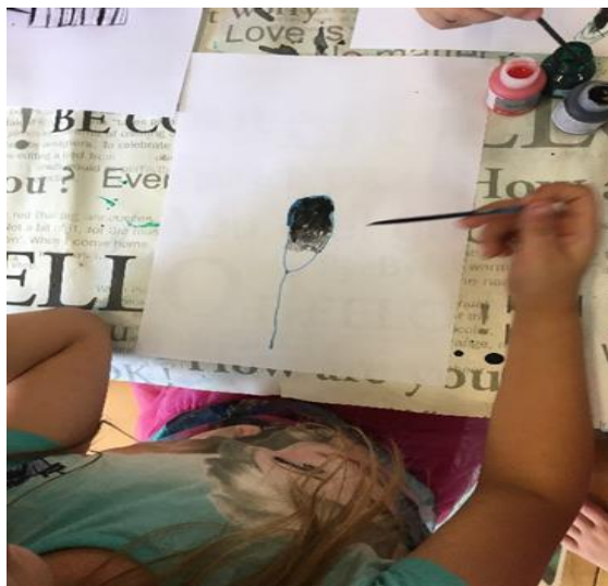
Slika 27. Crtež pera, djevojčica, 5 godina