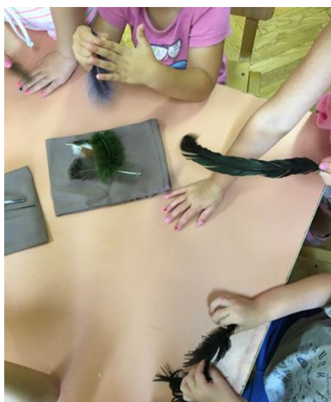
Slika 15. Osjetilno istraživanje

Djeca koju su držala ruku u vreći s grubljim perjem, uglavnom su iznosila doživljaje da osjećaju kako je pero hrapavo, oštro, tvrdo dok su ona koja su držala ruku u vreći s mekšim perjem, pretežno komentirala kako je mekano, pahuljasto ili škakljivo. Zatim su pera izvađena iz vreća i ponuđena na stol. Djeca su uz vizualno promatranje, dodirivala pera, proučavala boje te svojstva od kojih je pero načinjeno. Neka djeca otkrila su da pero može poslužiti i za škakljanje, pritom su odgojiteljici i meni perom prošla po licu. Otkrila su da pero, osim što se može vidjeti, može i osjetiti, a to su najbolje dočarala tako što su i probala. Prolazila su perjem preko lica i ruku jedni drugima, različitim vrstama pera, od grubljeg do mekšeg. Isto tako, djeca su primjećivala kako određeno pero reagira na puhanje, tako što su puhali u pero i primjećivali kako se dlačice miču, a to im je također pomoglo uočiti mekoću perja.