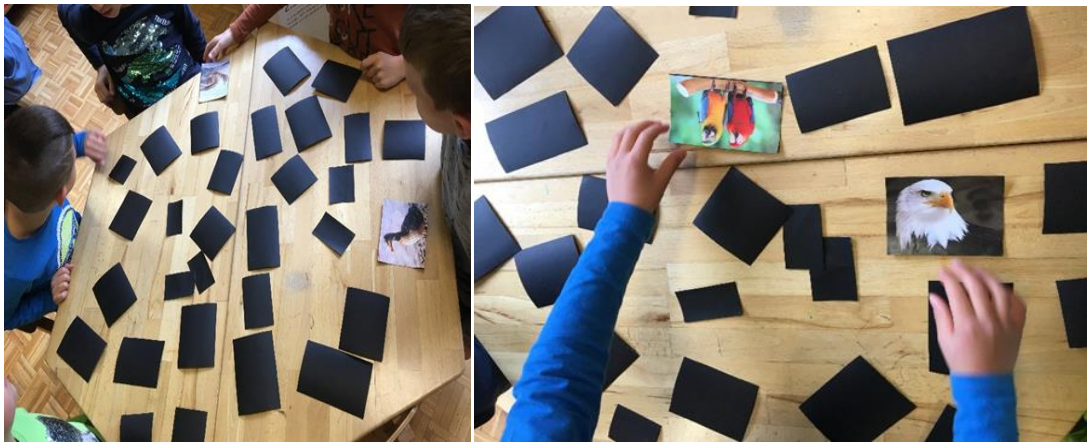
Slika 6. i 6. Igra memory

Djeci su ponuđene didaktičke igre vezane uz temu ptica. Najviše dječje zainteresiranosti privukla je igra memory u kojoj je potrebno naći par, odnosno dvije iste ptice, a igra je ubrzo prerasla i u natjecanje. Igra je korisna iz razloga što se djeca upoznaju s različitim vrstama ptica te ih vizualno i spontano memoriraju uslijed višestrukog gledanja. Iznenadjujući velik broj djece privukla je igra kockica kojima se treba pravilno napisati naslov na slikovnici.