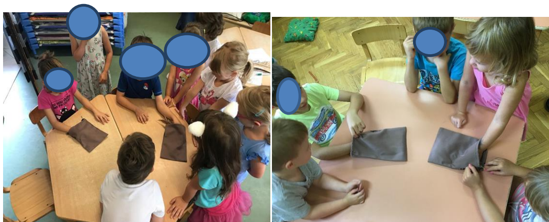
Slika 13. i 14. Taktilno ispitivanje sadržaja

Nakon razgovora, cilj se temeljio na poticanju djece donesenim poticajima, odnosno perjem. Djeci je navedena aktivnost kao igra koja je bila osmišljena da se u dvije platnene vreće stave pera tako da prva vreća sadrži grublja, a druga mekša pera. Dvoje po dvoje djece, dolazilo je dodirivati sadržaj vreće, bez gledanja, tako da pritom iznose doživljaje kakvim im se čini to pero koje su dodirivali. Tako su djeca imala priliku upoznati se i osjetiti svojstva i dijelove od kojih se pero sastoji, na nevizualan način.