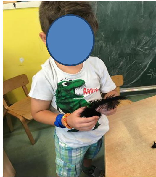
Slika 17. i 18. Istraživanje teksture pera vizualno i dodirom