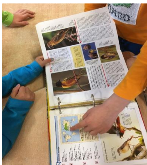
Slika 3. i 4. Proučavanje sadržaja enciklopedije