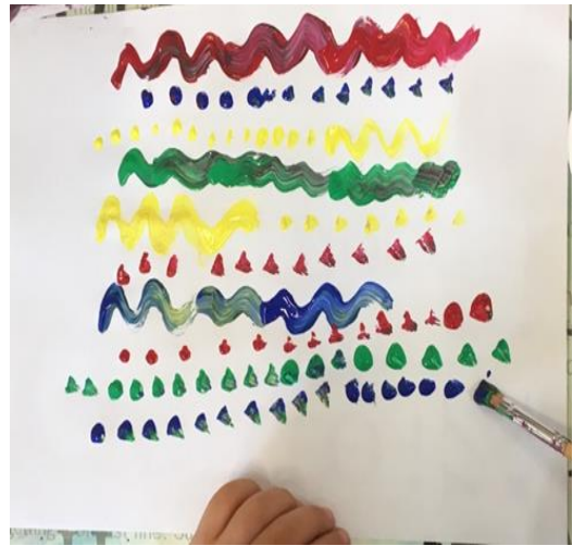
Slika 32. Crtež popraćen glazbom, djevojčica, 6 g.