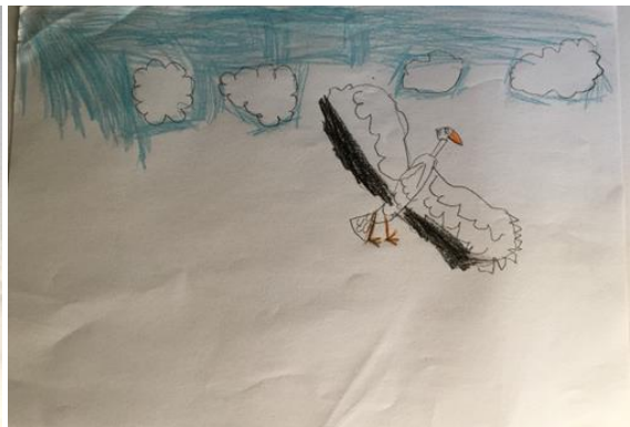
Slika 10. Crtež ptice, dječak, 7 godina