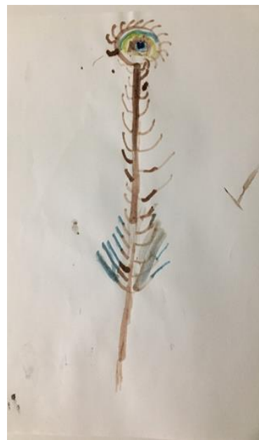
Slika 24. Crtež pera, dječak, 6 godina