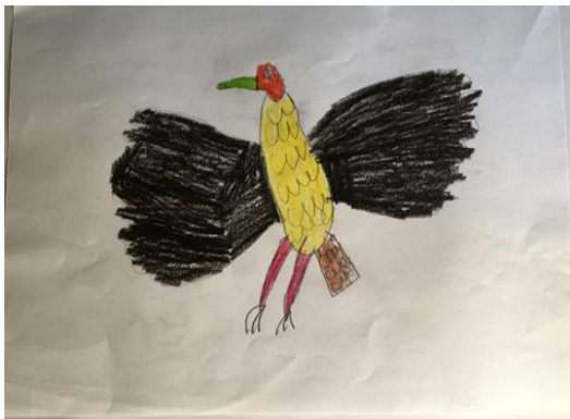
Slika 9. Crtež ptice, dječak, 6 godina

Nakon provedene motivacije i sudjelovanja u didaktičkim igrama, djeci je ponuđena crtačka tehnika olovka i drvene bojice. Zadatak je glasio nacrtati ili izraditi pticu koja ih se najviše dojmila. Materijali, kao što je plakat, slikovnice ili enciklopedija, djeci su bili ponuđeni na zasebnom stolu, gdje su mogli doći i prisjetiti se, kao pomoć u likovnoj aktivnosti.