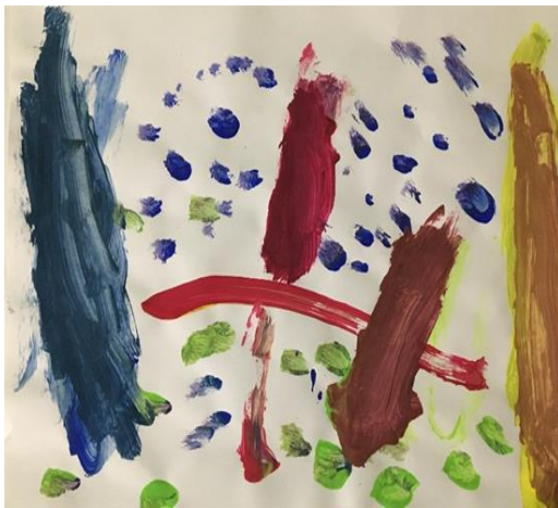
Slika 33. Crtež popraćen glazbom, dječak, 6 godina