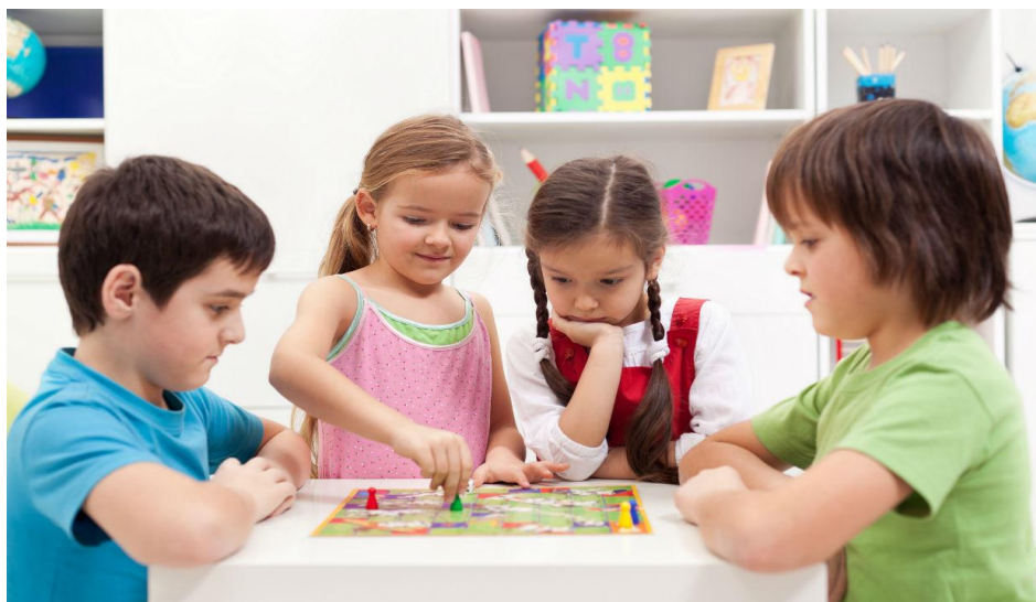
Slika 4. Igre s pravilima

Igre s pravilima se javljaju u razdoblju od 6 godine života i zadržavaju se čitav život. To su igre s unaprijed poznatim pravilima i određenim ciljom. Primjeri takvih igara su igre skrivača, lovice, igre loptom te društvene igre poput „Čovječe ne ljuti se“ ili „Uno“... Kroz ovakve igre djeca uče da su u životu nužna određena pravila koja moraju poštivati i uče se odgovornosti. Potiče se socijalizacija, integracija u društvo i prihvaćanje socijalnih normi. Ovaj tip igre dobar je i za razvoj mozga jer od djece traži veću koncentraciju i pažnju.