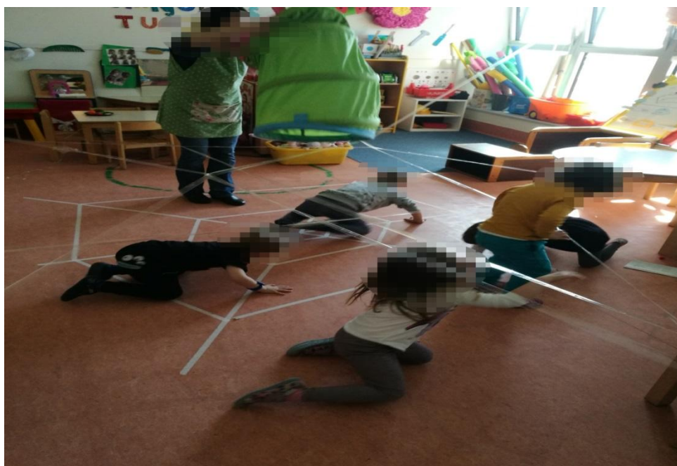
Slika 5. Tjelesni razvoj

Kada govorimo o tjelesnom razvoju mislimo na anatomske i fiziološke promjene kroz koje dijete prolazi. Kvalitetan dječiji razvoj ovisi o raznovrsnosti igre. Igra proširuje dječiju sposobnost i od iznimne je važnosti za razvoj tjelesne sposobnosti. U igri dijete pokreće svoje tijelo i postaje svjesno svojih mogućnosti. Kroz igru dijete usavršava motoriku. Dinamična igra i različiti pokreti tijela povoljno djeluju na tjelesni razvoj djece. Igra osigurava djetetu razvijanje svih motoričkih sposobnosti (fina i gruba motorika, koordinacija, spretnost itd). Dobre motoričke vještine preduvjet su za složenije radnje. Motoričke razvoj pridonosi razvoju drugih važnih vještina. Od rođenja pa do otprilike šeste godine tjelesne aktivnosti usmjerene su na jačanje i razvoj motoričkih vještina. Dijete prije nego što prijeđe na sljedeću motoričku fazu mora usavršiti onu predhodnu. Zato je važno ne pokušavati ubrzati djetetov razvoj. Zanimanje za različite vrste igara ovisi o zrelosti motoričkog razvoja. S razvojem motoričkih sposobnosti povezano je i tjelesno zdravlje. Kroz igru dijete zadovoljava potrebu za kretanjem. Kroz pokret dijete zapaža, misli, pamti i mašta. Zato je za kognitivni razvoj važan nesmetan tjelesni razvoj. Izostanak motoričkog razvoja može omesti kognitivni razvoj.