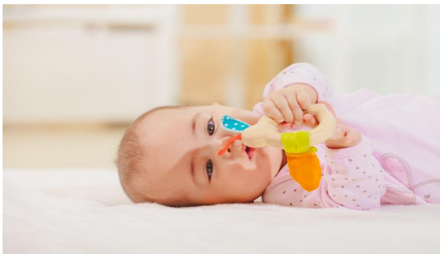
Slika 1. Funkcionalna igra

Funkcionalna igra je najjednostavniji oblik igre. Ona razvija dječije perceptivne i motoričke funkcije. Ovo je igra u kojoj dijete koristi, isprobava i razvija svoje sposobnosti. Dijete ispituje svoje funkcije i osobitosti objekta. Javlja se u najranijoj fazi djetetova života (dominira tijekom prve dvije godine života). To su jednostavni pokreti i radnje koje dijete izvodi. Dijete se igra sa vlastitim tijelom, dojenče upoznaje svoje ruke igrajući se njima. Svrha ovakve igre je priprema djeteta na hvatanje predmeta. Kasnije uči kontrolirati vlastite pokrete te razvija motoriku, koordinaciju i ravnotežu.