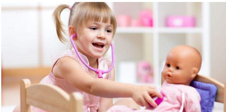
Slika 3. Simbolička igra

Igre s pravilima se javljaju u razdoblju od 6 godine života i zadržavaju se čitav život. To su igre s unaprijed poznatim pravilima i određenim ciljom. Primjeri takvih igara su igre skrivača, lovice, igre loptom te društvene igre poput „Čovječe ne ljuti se“ ili „Uno“... Kroz ovakve igre djeca uče da su u životu nužna određena pravila koja moraju poštivati i uče se odgovornosti. Potiče se socijalizacija, integracija u društvo i prihvaćanje socijalnih normi. Ovaj tip igre dobar je i za razvoj mozga jer od djece traži veću koncentraciju i pažnju.