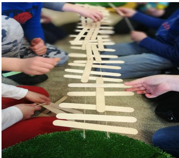
Slika 2. Konstruktivna igra

Naprimjer ako dijete želi odjenuti lutku ili pomoći pri odjevanju drugom djetetu potrebno mu je unutarnje razumjevanje.