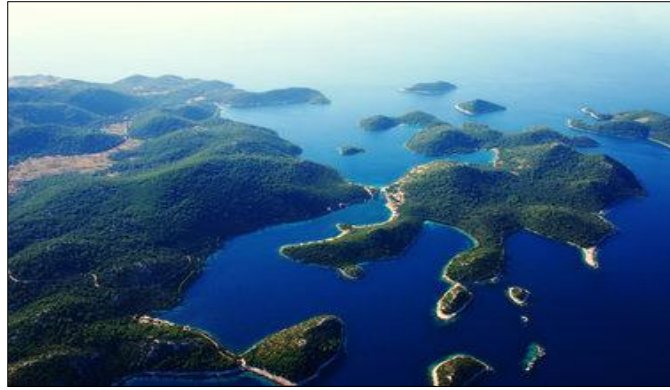
Slika 16. Park prirode Lastovsko otočje