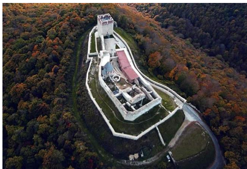
Slika 3. Medved-grad