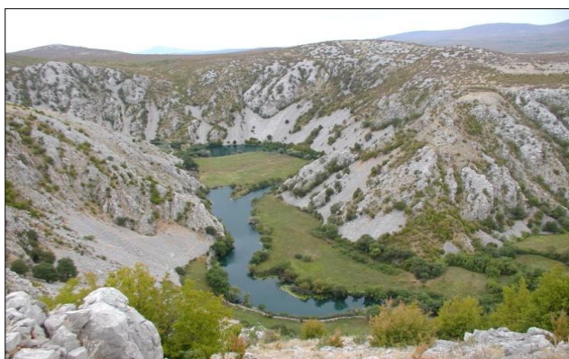
Slika 12. Kanjon Kupe