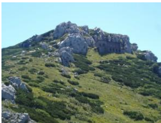
Slika 7. Snježnik (1 505 m)