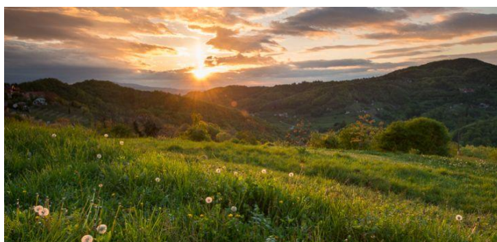
Slika 4. Park prirode Žumberačko-Samoborsko gorje

Žumberak i Samoborsko gorje karakterizira krajolik kojim dominira slikovita smjena šumskih i otvorenih prostora. Ta pejzažna slika je posljedica načina naseljavanja ovog prostora. Oko tih naselja šuma je iskrčena i pretvorena u livade i pašnjake. Brežuljci ovog parka prirode su jedan od najslikovitijih vinogradarskih krajolika u nas uopće. Također, dio ukupnih vrijednosti Žumberačko-Samoborskog gorja su brojni spomenički lokaliteti – stari gradovi i dvorci (Bralić, 1995/1996).