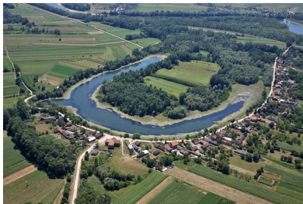
Slika 6. Park prirode Lonjsko polje

Mada je težište svakog parka prirode na njegovim prirodnim vrijednostima, treba ukazati i na vrijednu tradicionalnu arhitekturu posavskih drvenih kuća ovog parka prirode. Hrast lužnjak je dao sirovinu za gradnju kuća, čovjek je dodao umješnost i umjetnost, dok bijele rode na kućama potvrđuju skladan dojam i odnos čovjeka i prirode (Bralić, 1995/1996).