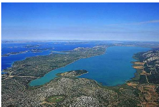
Slika 15. Park prirode Vransko jezero

Vransko jezero najveće je prirodno jezero u Hrvatskoj te predstavlja geomorfološku rijetkost našeg krškog područja jer se radi o kriptodepresiji ispunjenoj blago zaslanjenom vodom u kojoj se formirala specifična životna zajednica vodenih organizama. Sjeverozapadni rub jezera u zoni je intenzivnih poplava te je zbog bogatstva ptičjeg svijeta (ptica močvarica) proglašen posebnim ornitološkim rezervatom. U Parku je do sada zabilježeno 235 ptičjih vrsta, od čega su 102 gnjezdarice, a ostalima je područje Parka važno odmorište i zimovalište. 9