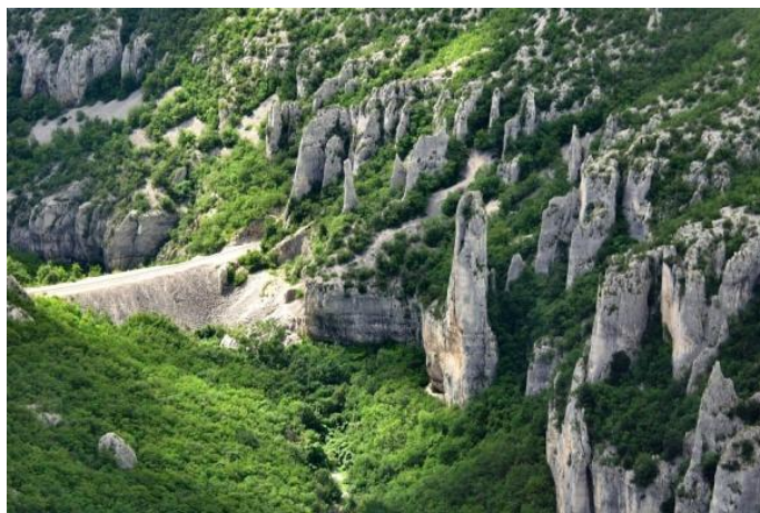
Slika 11. Park prirode Učka

Značajne su primorske šume bukve, pretplaninska šuma bukve, te naknadno podignute kulture četinjača. Uz to treba dodati livade i travnjake na kojima žive mnoge endemične, ugrožene i zaštićene biljne vrste. 7