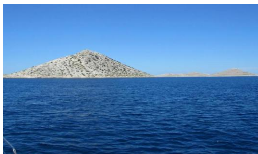
Slika 22. NP Kornati – jedinstveni morski labirint

Otočić Purara s pripadajućim morskim pojasom u radijusu od 1 nautičke milje, namijenjen je znanstvenim istraživanjima i zato nije dopušten ribolov, a posjet je moguć samo uz nadzor i dozvolu Uprave Nacionalnog parka (Bralić, 2005).