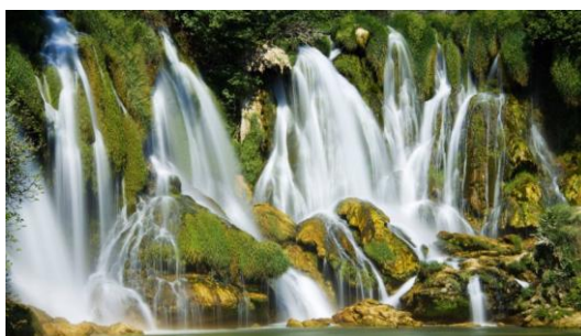
Slika 23. NP Krka

Područje parka obiluje tragovima drevne naseljenosti te brojnim kulturno-povijesnim spomenicima.