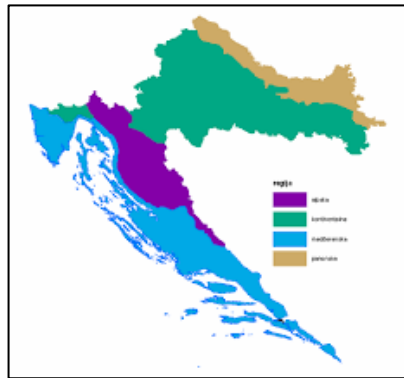
Slika 1. Biogeografske regije Hrvatske