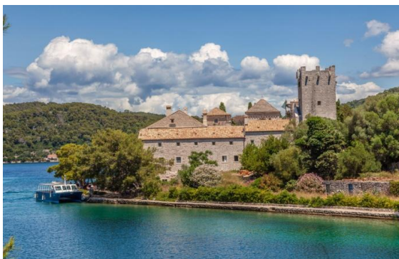
Slika 24. Kulturna baština naselja Polaće