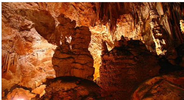
Slika 21. Manita peć