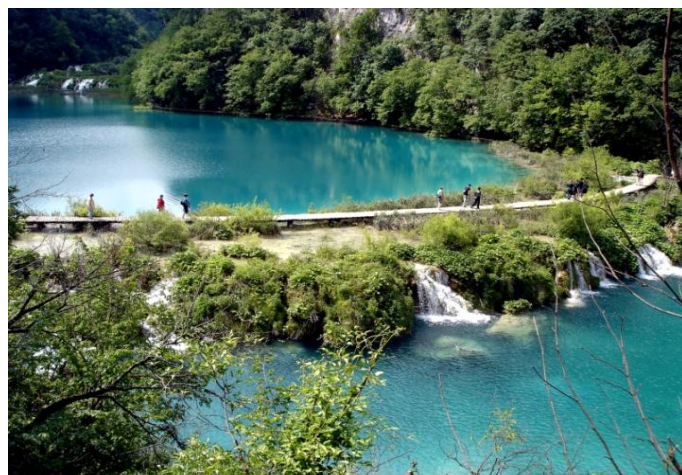
Slika 10. Prošćansko jezero