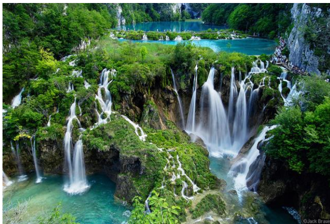
Slika 8. Plitvička jezera

Plitvička jezera smještena su u istočnoj Lici, između planina Male Kapele i Ličke Plješevice, a neposredno uz cestu što povezuje Zagreb i Dalmaciju. Ime se odnosi ponajprije na skupinu jezera, a u širem smislu i na cijeli okolni kraj. U skraćenoj, kolokvijalnoj verziji jednako se upotrebljava i izraz Plitvice (množina), koji treba razlikovati od imena Plitvica (jednina), koje označava selo i istoimenu rječicu u sjevernom dijelu Nacionalnog parka (Bralić, 2005).