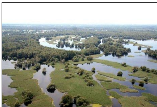
Slika 2. Park Prirode Kopački rit

3. veljače 2005. godine Vlada Republike Hrvatske podnosi Izvješće o Prijedlogu zakona o proglašenju Nacionalnog parka „Kopački rit“. 4