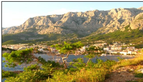
Slika 17. Park prirode Biokovo

Biokovo je parkom prirode proglašen zbog svoje izuzetne pejzažne prisutnosti u okolnom prostoru, a posebno na njegovoj primorskoj strani. Vršno područje Biokova čini valovita visoravan s bezbrojnim manjim depresijama koje se u kršu nazivaju ponikve ili vrtače. Za krajolik vršnog područja karakteristični su otvoreni kamenjari i šumarci bukve u zaklonjenim ponikvama. Biokovo je prvorazredni prostor za planinarsku rekreaciju (Bralić, 1995/1996).