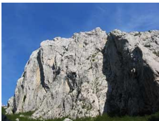
Slika 20. Anića-kuk

Nacionalni park Paklenica proteže se neposredno od Jadranskog mora do najviših velebitskih vrhova u zaleđu. Dva duboka kanjona – Velika i Mala Paklenica – usjekla su se u masiv planine u davnoj geološkoj prošlosti. Na dijelu kanjona Velike Paklenice koji se naziva Anića luka, nalazi se Anića-kuk, 400 metara visoka okomita stijena, najviša penjačka stijena na Velebitu i najpoznatija u Hrvatskoj, ujedno najposjećenije penjačko ili alpinističko središte u nas (Barišić i suradnici, 2008).