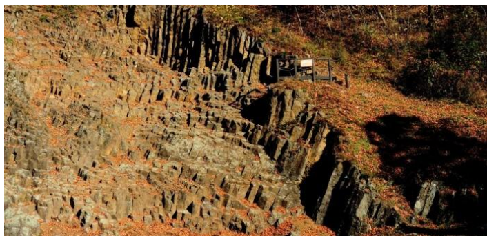
Slika 5. Rupnica

Geološki gledano Park je značajan zbog zastupljenosti gotovo svih vrsta stijena od paleozoika do kvartara, kao i zbog velike raznolikosti stijena, minerala, fosila, geoloških struktura i tekstura, krških pojava i objekata. Na sjeverozapadnom dijelu Parka nalazi se lokalitet Rupnica - prvi geološki spomenik prirode u Hrvatskoj - zaštićen zbog pojave stubastog lučenja vulkanskih stijena te predstavlja geološku jedinstvenost u našoj zemlji.