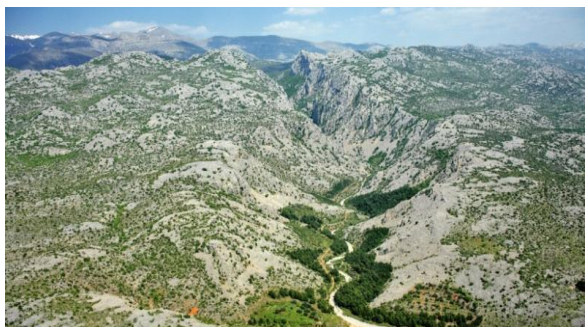
Slika 19. Nacionalni park Paklenica – prostor izuzetnih prirodnih i krških vrijednosti