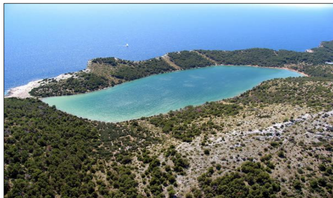
Slika 14. Jezero „Mir“

Telašćica je izvrsno zaštićena od svih vjetrova pa je od davnina poznata kao sidrište i sklonište za sve vrste brodova i čamaca. Jedna od zanimljivosti tog parka prirode je jezero Mir koje je ljeti do 6 stupnjeva toplije od okolnog mora, što za određene kategorije kupaca, može biti dragocjena razlika (Bralić, 1995/1996).