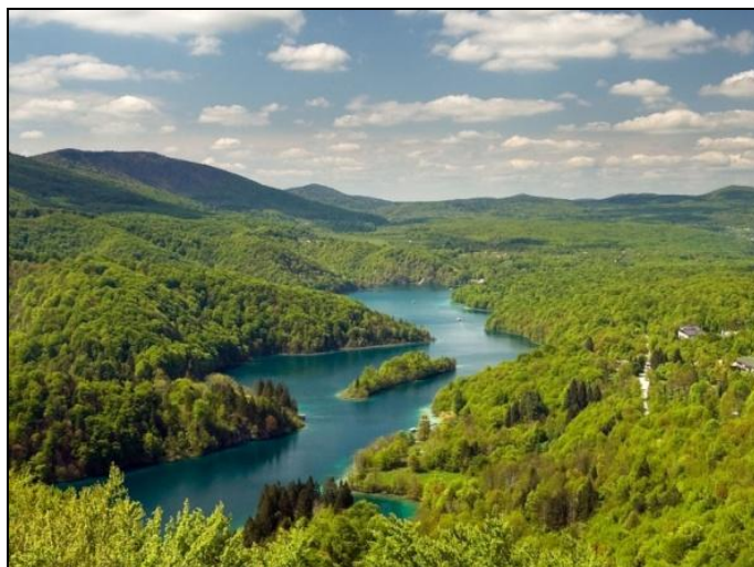
Slika 9. Jezero Kozjak