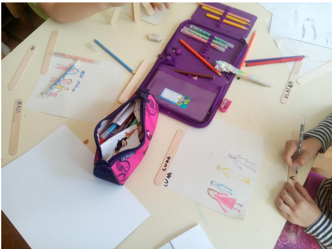
Slika 5 – Upisivanje imena članova obitelji na drvene štapiće