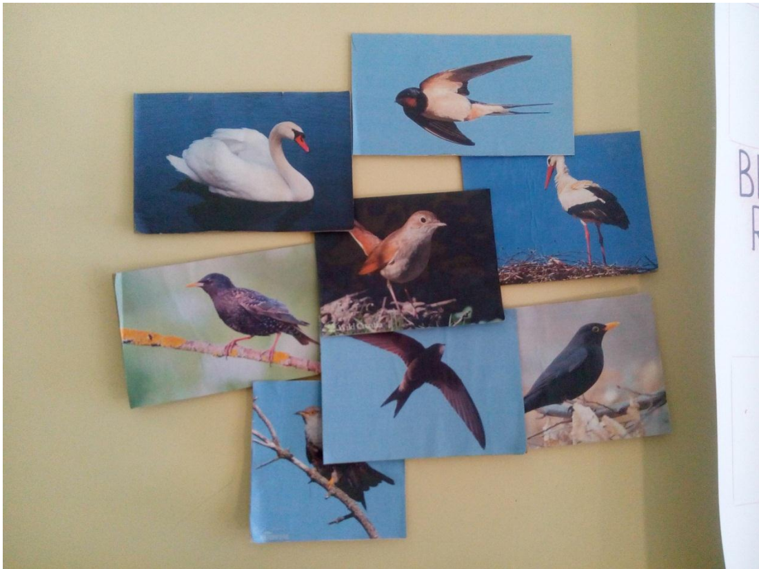
Slika 1 – Kartice s fotografijama ptica selica