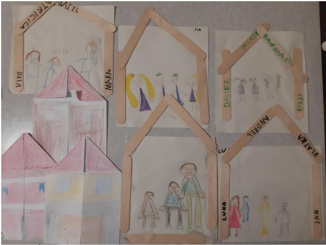
Slika 6 – Dio dječjih radova