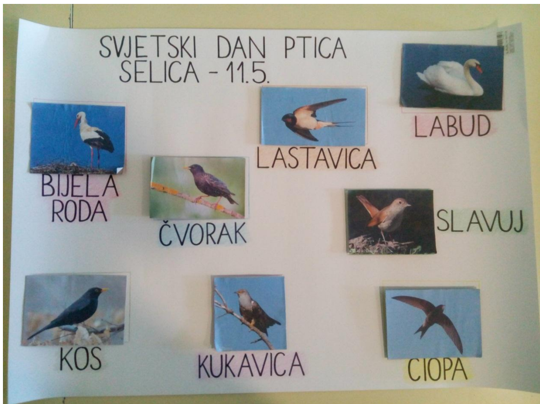
Slika 2 – Plakat s fotografijama ptica i njihovim nazivima