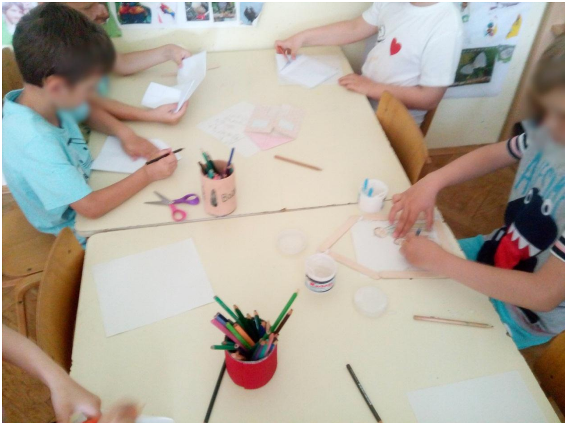
Slika 4 – Izrađivanje kućica od drvenih štapića i papira