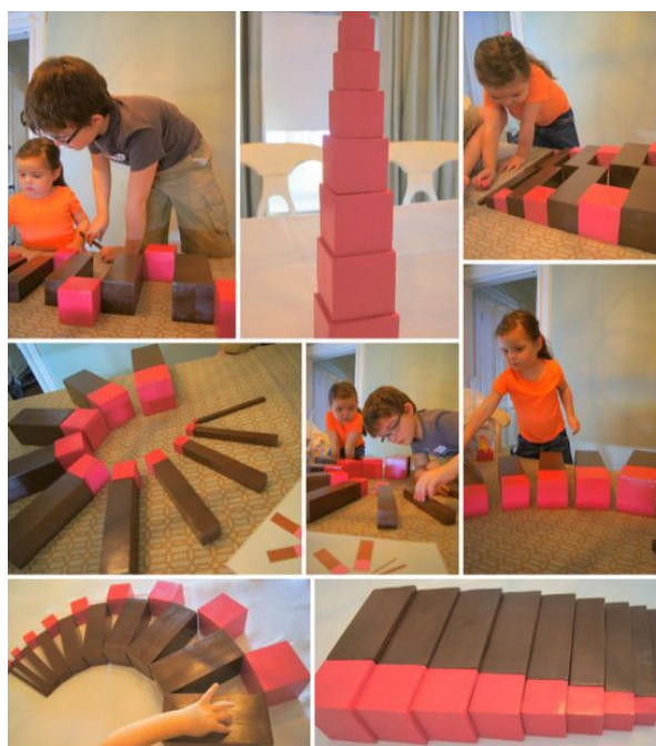
Slika 2: Montessori „ružičasti toranj“

Slaganje u nove oblike se postiže putem binomske i trinomske kocke gdje djeca različite kocke i kvadre slažu u jednu veliku kocku (Slika 3).