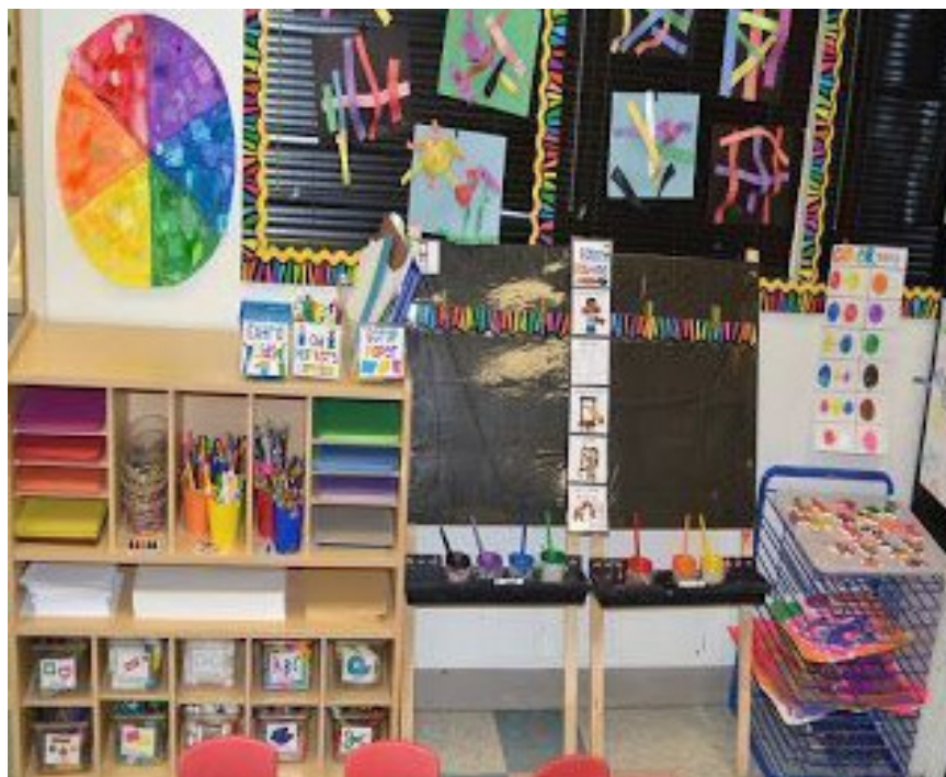
Slika 5: Likovni centar

U Montessori vrtićima važno je da u svako doba dana bude slobodno dostupan prostor za likovnu aktivnost, kao što je stol s velikom radnom površinom koja se nalazi na sredini. Važno je da prostor bude dobro pripremljen i osmišljen s raznovrsnim, stalno dostupnim materijalom kako bi djeca samostalno mogla birati aktivnost. Prostor treba biti bogat i diferencirano strukturiran svojim načelima za red, treba biti jasan i pregledan te kao takav na djecu djeluje poticajno i motivirajuće. Oni iniciraju i upravljaju svojim aktivnostima, istražuju i otkrivaju nove mogućnosti i sve to dok se zabavljaju. Djeca koncentrirano rade sama ili u grupi, sjedeći za stolom ili stojeći uz njega, ležeći na podu ili stojeći uz zid na kojem je ploča po kojoj mogu crtati ili slikarski stalak. Bitno je da postoji velika slobodna površina kako bi svi imali dovoljno prostora i mogućnosti za nesmetani rad. Također, treba postojati prostor gdje djeca mogu modelirati plastelin, crtati, slikati i tiskati (Seitz i Hallwachs, 1996). Montessori likovni centar vidljiv je slici 5 i 6.