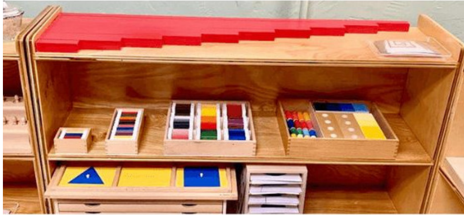
Slika 6: Police s materijalom za istraživanje

Dostupnost likovnog pribora pobuđuje djecu na kreativnu aktivnost. Pružimo li djeci obilje prilika za likovno izražavanje i pritom ih pustimo da sami stvaraju svoja likovna djela, oni će stvoriti svoj likovni izričaj. Likovno izražavanje djece ne smije biti nametnuto, nego bi trebalo poteći iz djetetovih potreba i interesa. Ono treba biti slobodno od ciljeva, usporedbi, prosudbi i konvencija. Djeca sama biraju likovni materijal i tehnike rada, sama oblikuju svoje teme, a učitelj/odgojitelj je uvijek nazočan, ali se drži po strani i savjetuje kad je potrebno (Seitz i Hallwachs, 1996).