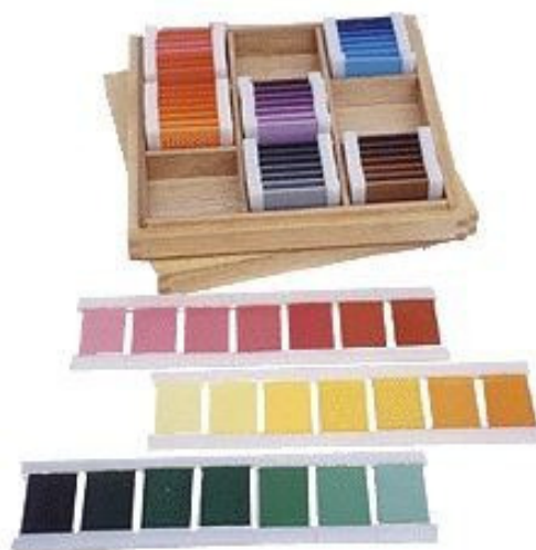
Slika 4: Obojene pločice

Razlikovanje boja vježba se pomoću obojenih pločica. Ova vježba se odvija na način da se upare isto obojene pločice nakon čega slijedi razlikovanje boja s obzirom na svjetlinu. Boje koje su prisutne na obojenim pločicama su crna, crvena, narančasta, žuta, zelena, plava, ljubičasta i smeđa. Od svake boje ukupno je njezinih 8 nijansi što bi značilo da postoji ukupno 64 pločice (Slika 4).