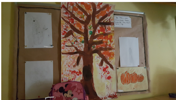
Slika 7: Likovni radovi djece izloženi na panou

Svako dijete ima mapu svojih likovnih radova, koju dobiva kada odlazi u školu. Dječje radove izlažemo na panou (Slika 7). Fotografiramo proces rada, individualno i grupno.