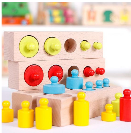
Slika 1: Montessori drveni valjčići