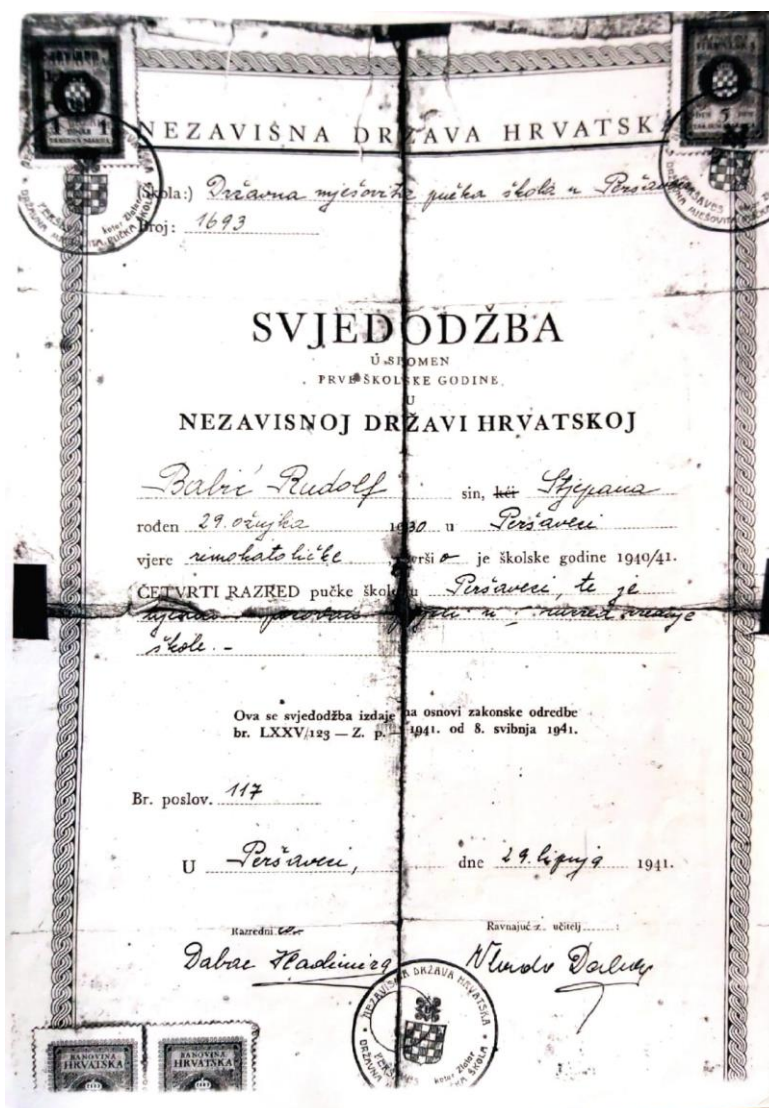
Slika 4. Svjedodžba Državne pučke mješovite škole Peršaves, 1941.

“Prosvjetne vlasti Nezavisne Države Hrvatske odmah 1941. mijenjaju sve školske propise pa i model ocjenjivanja učenika.” (Matijević, 2004, str. 41). U dvjema svjedodžbama iz 1941. ne navode se učenikove ocjene i postignuća već se samo navodi kako je učenik sposoban prijeći u viši razred (Slika 4 i 5) za razliku od sljedeće školske godine kada se uvodi ljestvica školskih ocjena za nastavne predmete (izvrstan (1), vrlo dobar (2), dobar (3), dovoljan (4), nedovoljan (5)) te ocjene za vladanje (uzorno (1), pohvalno (2), dobro (3), slabo (4)) po uzoru na njemački sustav (Matijević, 2004).