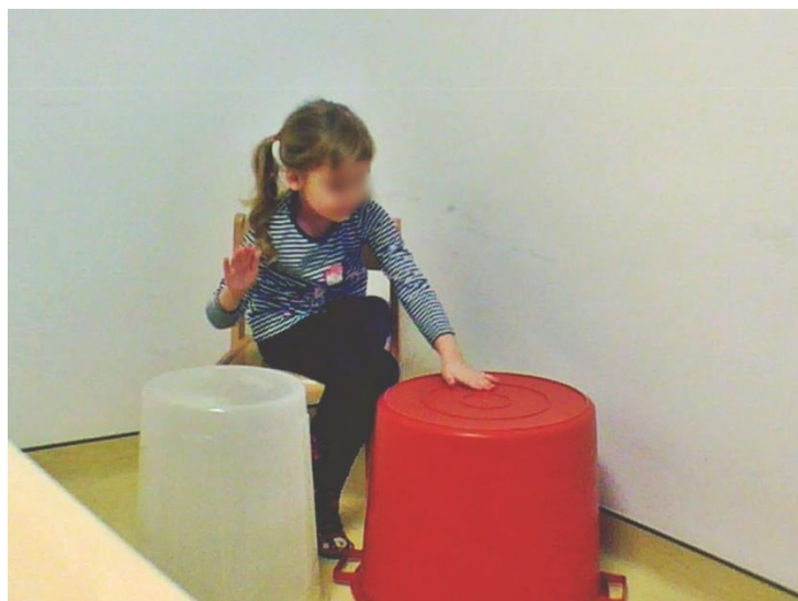
Fotografija 1. Aktivnost 1. Na koliko načina? Koji su drugi načini?

Određeni je broj djece uspostavljalo neformalnu komunikaciju prije samog početka izvođenja aktivnosti, za vrijeme samog izvođenja aktivnosti (između 'novih ideja') te nakon izvođenja aktivnosti. Djeca su verbalizirala trenutne asocijacije vezane za roditelje, doživljaje iz osobnih iskustava, a može se promišljati da su im te asocijacije poslužile kao 'prijelazni objekt' namijenjen opuštanju jer su ih izražavala u situacijama kada su osjećala napetost, nesigurnost ili nelagodu.