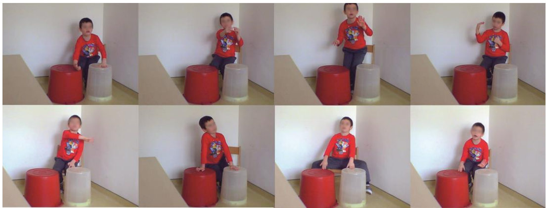
Fotografija 7. Zanesenost u glazbenom izričaju djeteta predškolske dobi

Zadane je ritmičke obrasce usvajao, mijenjao i nadograđivao. U situacijama u kojima nije mogao dočarati pojave prema vlastitoj zamisli (ograničenje glazbenih instrumenata) koristio je zvukove proizvedene tijelom i time otkrio mnoštvo novih ideja i mogućnosti kao i svojeg prikrivenog i do tada neizraženog glazbenog potencijala.