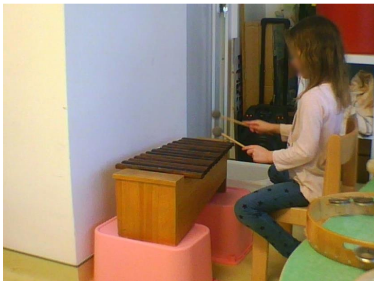
Fotografija 4. Aktivnost 3., Koji su drugi načini?

Pojedina djeca su samostalno oblikovala ritmičke obrasce i uključivala odgojitelja u interakciju na način da pokuša ponoviti fraze koje su oni osmislili.