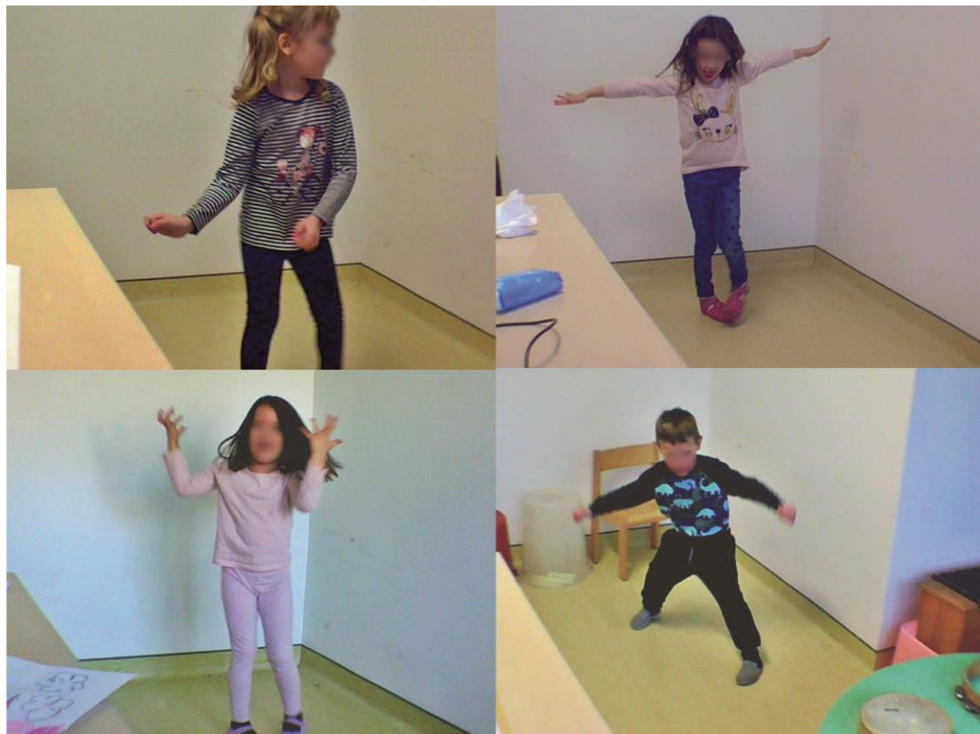
Fotografija 6. Aktivnost 4., Izričaji djece uz glazbeni poticaj (transformacije)

Najznačajniji element cjelokupnog istraživanja koji opravdava njegovu provedbu u segmentu zanesenosti je uočavanje navedenog stanja kod dječaka YY.