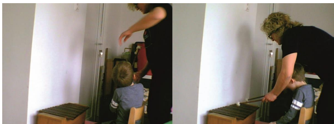
Fotografija 5. Uključivanje odgojitelja u aktivnost na zahtjev djeteta

Četvrta je aktivnost (Možeš li se kretati kao glazba?) pružala širok raspon djetetovog izričaja uz glazbeni poticaj. Temeljeno na procjeni odgojitelja i istraživača dvojica dječaka nisu pokazala nikakvu ili vrlo malu reakciju na ponuđene poticaje, a vizualnim opažanjem procijenjeno je da su obuzeti osjećajem nelagode ili zbunjenosti iz razloga što im se ponuđeni poticaj nije sviđao te se nisu bili u mogućnosti izraziti. U aktivnosti je ponuđeno šest različitih kratkih glazbenih