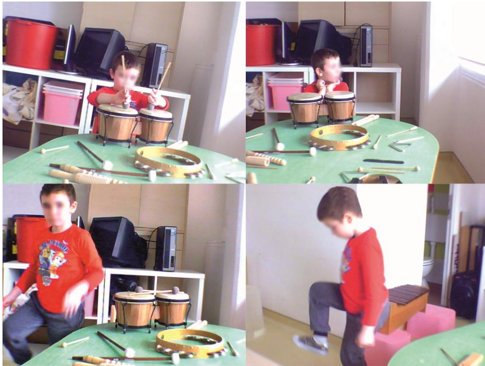
Fotografija 8. Faze upotrebe tijela kao glazbenog instrumenta

U četvrtoj je aktivnosti (Možeš li se kretati kao glazba?) vjerno dočaravao vlastite doživljaje i asocijacije na način da ih je odgojitelj bio u mogućnosti vizualizirati. Stanje glazbene zanesenosti dječaka YY potvrđeno je kroz sve indikatore najvišim vrijednostima (vrlo) znači da se dječak YY doimao vrlo sretnim, vrlo raspoložen, vrlo uključen (involviran), vrlo budan, vrlo aktivan, vrlo uzbuđen, vrlo uspješan te se osjećao vrlo ugodno. Svjestan prisutnosti kamere preuzeo je kontrolu nad stvaralačkim procesom. Sugerirao je vrijeme uključivanja snimanja („Akcija!“) kao i vrijeme prestanka snimanja („Stop!“). Vrijeme boravka u prostoriji za istraživanje je naprosto 'proletjelo', a dječak YY je u njoj boravio onoliko vremena koliko je zahtijevao njegov veliki glazbeno-kreativni potencijal. Dječaku ZZ, koji je prisustvovao i promatrao kompleksno izražavanje dječaka YY, je boravak u prostoriji postao monoton duljine vremenskog trajanja.