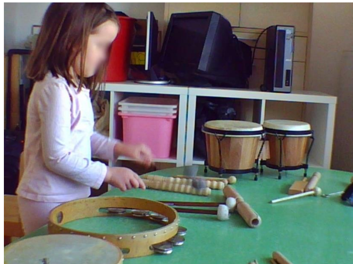
Fotografija 3. Istraživanje ritmičkih glazbenih instrumenata

Preferirani batići su bili od filca, a pojedini su s namjerom koristili drvene jer su proizvodili jače zvukove različito od prethodnih (filca) koji su zvučali prigušeno. Troje djece nije bilo u mogućnosti usvojiti zadani ritmički obrazac, ali su se sva