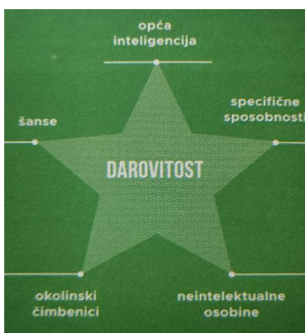
Slika 3. Model zvijezde A. Tannenbauma (Burušić i sur., 2019)