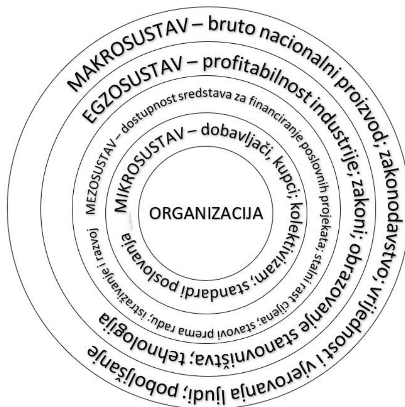
Slika 2. Prikaz okoline organizacije

Dobavljači utječu na organizaciju tako što neku sirovinu mogu proizvesti kvalitetnije pa će samim time i proizvod biti kvalitetniji što povoljno utječe na ponudu i prodaju. No, ako dobavljači povećaju cijene ili proizvedu sirovinu manje kvalitete, također utječu na proizvode odnosno uslugu neke organizacije. Dobavljači i organizacija tako imaju međusoban utjecaj. Ako je poduzeće na visokoj tržišnoj poziciji, može zahtijevati kvalitetnije sirovine od dobavljača. Organizacija konstantno prati svoje konkurente na tržištu, a isto tako i konkurencija prati kretanje i poslovanje poduzeća. Svaka poduzeta aktivnost izaziva reakciju, a konkurenti se moraju pratiti i nadmudriti. Do informacija o konkurenciji ponekad je teško doći pa se često moraju otkrivati njihove poslovne tajne. Praćenjem konkurencije, i spoznajom prednosti i nedostataka, lakše ih je eliminirati iz tržište utakmice. Tržište rada omogućava da poduzeće pronade ljude koji su mu potrebni za uspješno poslovanje. Teško je pronaći