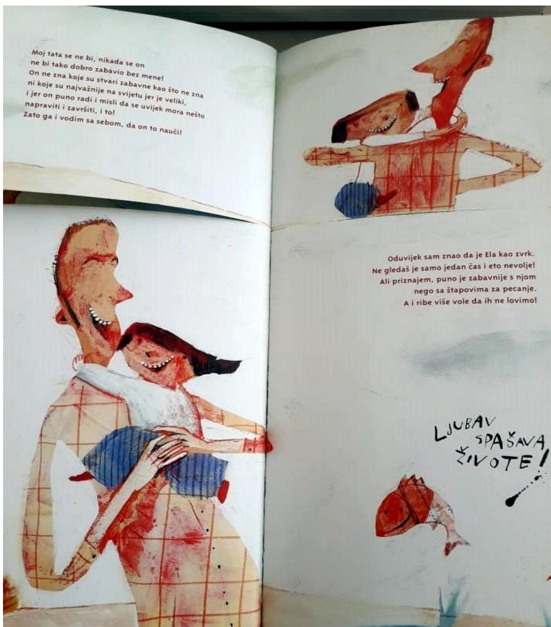
Slika 6. Primjer dvostranice iz slikovnice „ Ljubav spašava živote “ (Junaković, 2017)

prizore koji naznačuju tijek zapleta“ (Narančić Kovač, 2015, str. 151). Pri tome se zna dogoditi da slikovni pripovjedač „iskoristi mogućnost nizanja vremenski bliskih slika da bi postigao veću dinamičnost u pripovijedanju“ (Narančić Kovač, 2015, str. 151). Ovo je u slikovnici „ Ljubav spašava živote “ posebno vidljivo u posljednje dvije dvostranice, kada Ela skače u vodu, a otac ju spašava i grli. Možemo zaključiti da je u ovoj slikovnici od prve do zadnje plohe jasno vidljiva uloga oba pripovjedača: jezičnog i slikovnog, ali i dvije perspektive: oca i kćeri, a što je vidljivo i na posljednjoj dvostranici slikovnice: