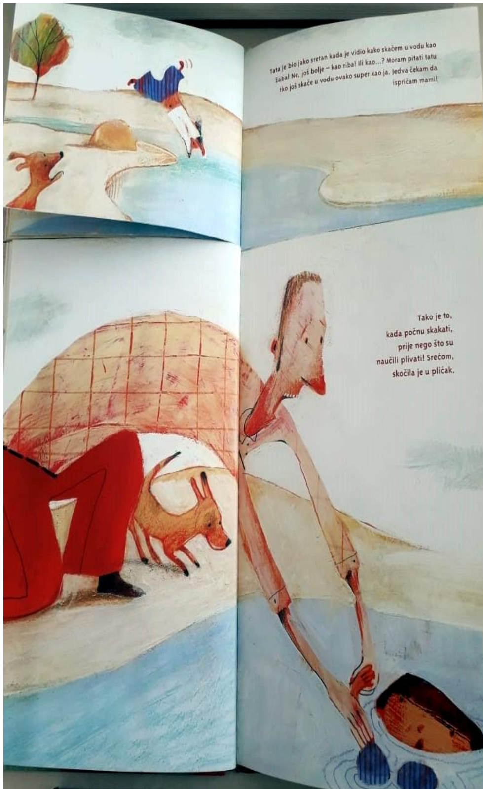
Slika 5. Primjer dvostranice iz slikovnice „ Ljubav spašava živote “ (Junaković, 2017)

čitati slikovnicu, sami biramo i količinu pripovjednih informacija koje ćemo dobiti, a time sami utječemo na pitanje pouzdanosti i nepouzdanosti pripovjedača.