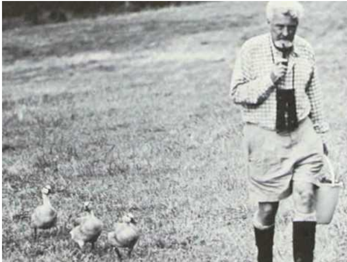
Slika 2 Austrijski zoolog, Konrad Lorenz i guske koje ga slijede