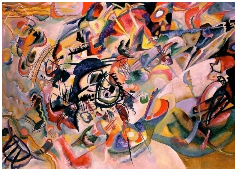
Slika broj 1. Vasilij Kandinski – Composition VII , 1913.