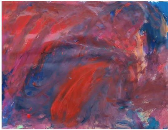
Slika broj 9. Učenički rad 7