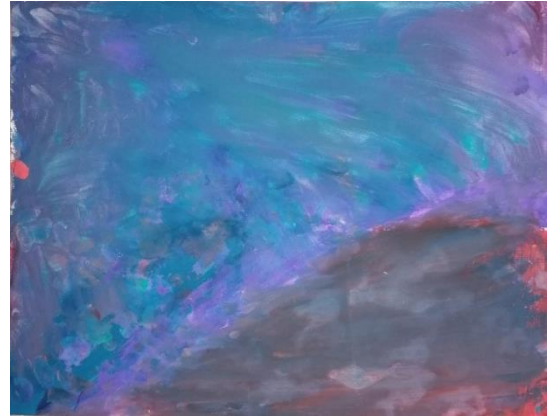
Slika broj 10. Učenički rad 8

Iako su prikazani radovi vrlo slični, po procesu nastajanja uvelike se razlikuju. Na prvom radu (Učenički rad 7) uočljiva je velika količina crvene i plave boje miješane na samom radu tehnikom mokro na mokro, dajući pritom različite tonove ljubičaste boje. Učenica je koristila samo osnovne boje (plava, crvena i jako malo žute) te je smireno i polako miješala boje stvarajući na taj način različite tonove ljubičaste boje. Tijekom stvaranja drugog rada (Učenički rad 8) učenik je koristio mnogo različitih boja slikajući linije, plohe i crte. Početkom sata bio je vrlo smiren i koncentriran, a tijekom sata njegovi su potezi kistom postali brži i intenzivniji. Krajem sata i neposredno prije analize učeničkih radova, učenik je istisnuo veliku količinu plave boje na likovni rad te ju rukom razmazao. Time je rad poprimio tamne i hladne tonove plave i ljubičaste boje.