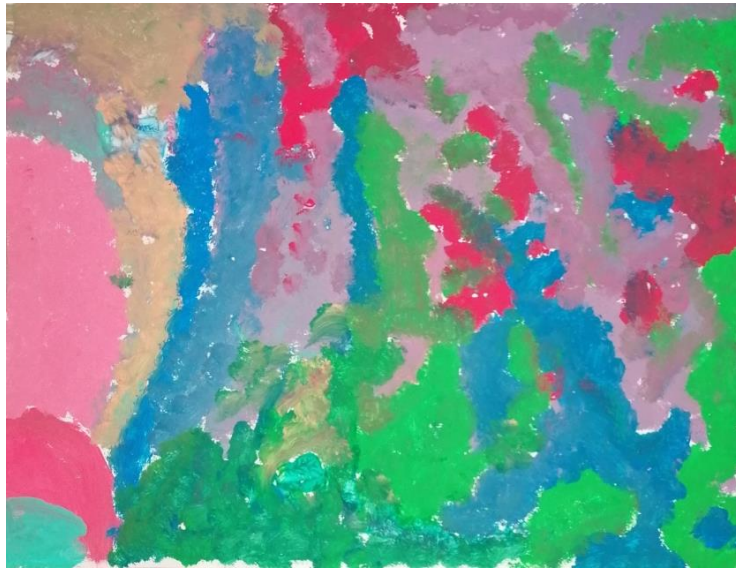
Slika broj 3. Učenički rad 1

Prikazani učenički rad nastao je „tapkanjem“ kistom po površini papira, a ne potezima. Odudaranje od patenta nalazi se u donjem lijevom kutu gdje su vidljive dvije plohe, ružičaste i tirkizne boje, kojima je učenik započeo svoj rad. Neovisno o drugačijem početku, učenik se tijekom sata odlučio za korištenje tamnih i zagastih nijansa pa radom dominiraju uglavnom hladne boje, odnosno plava, zelena i ljubičasta. Kompozicija rada vrlo je zanimljiva i složena zbog brzih udaraca kistom koji se pružaju u različitim smjerovima. Uočljiva je putanja i smjer kretanja boja po kojima možemo zaključiti da je dijete bilo vrlo smireno i koncentrirano tijekom stvaralačkog procesa.