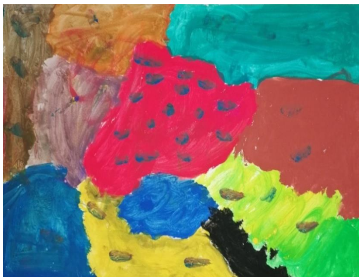
Slika broj 8. Učnički rad 6

dominiraju različiti tonovi zelene i plave boje, odnosno hladne boje, dok kod drugog rada prevladavaju ružičasto-crvena i narančasta, tj. tople boje. Učenici su bez obzira na smirujuću skladbu pokazali visok stupanj energije koji je vidljiv u njihovim uradcima.