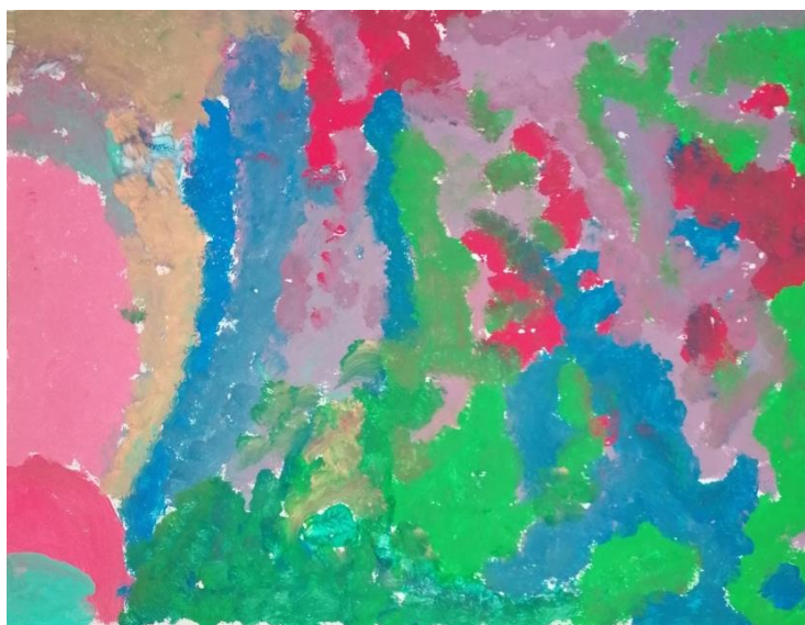
Slika broj 3. Učenički rad 1

Prikazani učenički rad nastao je „tapkanjem“ kistom po površini papira, a ne potezima. Odudaranje od patenta nalazi se u donjem lijevom kutu gdje su vidljive dvije plohe, ružičaste i tirkizne boje, kojima je učenik započeo svoj rad. Neovisno o drugačijem početku, učenik se tijekom sata odlučio za korištenje tamnih i zagastih nijansa pa radom dominiraju uglavnom hladne boje, odnosno plava, zelena i ljubičasta. Kompozicija rada vrlo je zanimljiva i složena zbog brzih udaraca kistom koji se pružaju u različitim smjerovima. Uočljiva je putanja i smjer kretanja boja po kojima možemo zaključiti da je dijete bilo vrlo smireno i koncentrirano tijekom stvaralačkog procesa.