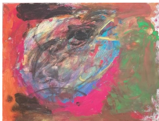
Slika broj 7. Učenički rad 5

Prikazani radovi nastali su vrlo brzim i energičnim potezima kistom te korištenjem guste boje uz vrlo mali dodatak vode. Potezi se kreću u različitim smjerovima, a njihova duljina varira od vrlo kratkih do dugih i kružnih poteza. Dok su kod prvog rada (Učenički rad 4) potezi kista neujednačeni i nasumični, drugi rad (Učenički rad 5) je komponiran kružno krećući se od rubova prema sredini gdje je izražena sva energičnost stvaraoca. Korištene boje kod prvog rada su slabog intenziteta, dok su kod drugog jarke. Kod oba učenika vidljivo je korištenje velikog opusa toplih i hladnih boja koje su, brzim potezima, slikane jedne preko drugih. Kod prvog rada