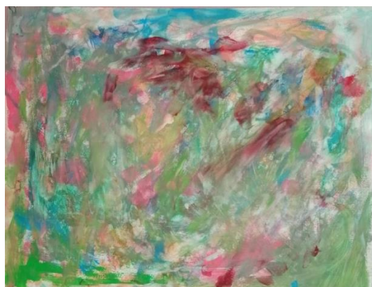
Slika broj 6. Učenički rad 4

Prikazani učenički radovi vrlo su slični zbog jednake palete korištenih boja, ali ujedno i zbog slične tehnike slikanja. Učenici su sjedili zajedno te su jednako započeli svoje stvaralaštvo prekrivajući površinu papira velikim plohama plave, narančaste i crvene boje. Tijekom sata, oba učenika su bila puna energije te likovni zadatak shvatila kao igru različitih boja, što je vidljivo i na prikazanim radovima. Potezi kistom su brzi, neujednačeni i u različitim smjerovima, a učenici su također udarali kistom tvoreći pritom različite mrlje. Do promjene u načinu rada dolazi krajem sata. Na prvom radu (Učenički rad 2) vidimo da je učenik „zašarao“ svoj rad, miješajući pritom mokre boje te stvarajući različite nijanse smeđe i ljubičaste. Drugi rad (Učenički rad 3) ima vrlo zanimljivu i kompleksnu slikarsku teksturu. Učenik je nastavio sa stvaranjem mrlja i debljih linija dodajući pritom crnu i zelenu boju. Krajnji produkt u oba slučaja je vrlo taman i zagasit te nema grubih i jasno ocrtanih linija kao ni obojanih ploha. Radovi su heterogene mješavine toplih i hladnih boja koje se protežu u različitim smjerovima.