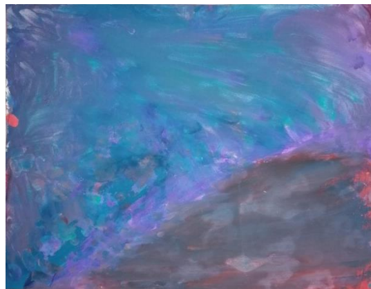
Slika broj 10. Učenički rad 8

Iako su prikazani radovi vrlo slični, po procesu nastajanja uvelike se razlikuju. Na prvom radu (Učenički rad 7) uočljiva je velika količina crvene i plave boje miješane na samom radu tehnikom mokro na mokro, dajući pritom različite tonove ljubičaste boje. Učenica je koristila samo osnovne boje (plava, crvena i jako malo žute) te je smireno i polako miješala boje stvarajući na taj način različite tonove ljubičaste boje. Tijekom stvaranja drugog rada (Učenički rad 8) učenik je koristio mnogo različitih boja slikajući linije, plohe i crte. Početkom sata bio je vrlo smiren i koncentriran, a tijekom sata njegovi su potezi kistom postali brži i intenzivniji. Krajem sata i neposredno prije analize učeničkih radova, učenik je istisnuo veliku količinu plave boje na likovni rad te ju rukom razmazao. Time je rad poprimio tamne i hladne tonove plave i ljubičaste boje.