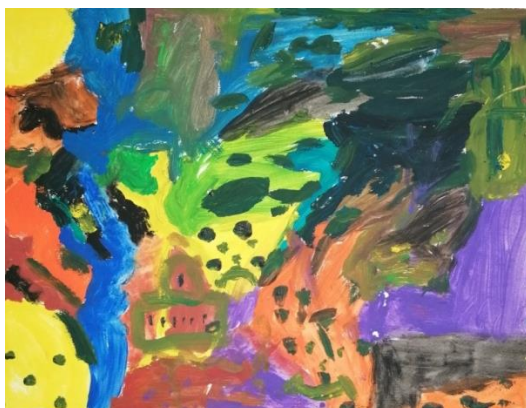
Slika broj 11. Učenički rad 9

Iako su prikazani radovi vrlo slični, po procesu nastajanja uvelike se razlikuju. Na prvom radu (Učenički rad 7) uočljiva je velika količina crvene i plave boje miješane na samom radu tehnikom mokro na mokro, dajući pritom različite tonove ljubičaste boje. Učenica je koristila samo osnovne boje (plava, crvena i jako malo žute) te je smireno i polako miješala boje stvarajući na taj način različite tonove ljubičaste boje. Tijekom stvaranja drugog rada (Učenički rad 8) učenik je koristio mnogo različitih boja slikajući linije, plohe i crte. Početkom sata bio je vrlo smiren i koncentriran, a tijekom sata njegovi su potezi kistom postali brži i intenzivniji. Krajem sata i neposredno prije analize učeničkih radova, učenik je istisnuo veliku količinu plave boje na likovni rad te ju rukom razmazao. Time je rad poprimio tamne i hladne tonove plave i ljubičaste boje.