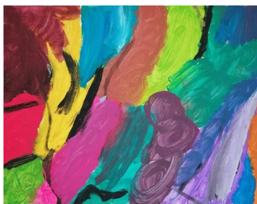
Slika broj 21. Učenički rad 19

Prikazani radovi stvoreni su korištenjem intenzivnih i jarkih boja koje su pretežito hladne. Tijekom bojanja velikih ploha učenici su koristili brze poteze kistom, a na