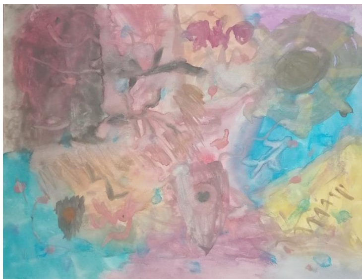
Slika broj 14. Učenički rad 12

Prikazani rad poseban je zbog odabira pastelnih i nježnih tonova boja te korištenja velike količine vode tijekom slikanja. Slikanje je teklo vrlo smireno i uravnoteženo, a vidljiva je i tehnika rada mokro na mokro. Korištene su podjednako hladne i tople boje, ali miješanjem boja, učenica je većinu rada prekrila hladnom plavom i ljubičastom bojom. Vidljivo je i razlijevanje boja te korištenje različitih poteza kistom čime su nastale cik-cak, razlomljene, ravne i valovite linije.