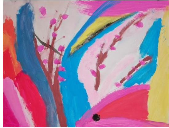
Slika broj 28. Učenički rad 26

Učenice su tijekom stvaranja radova koristile različite nijanse ružičaste boje te njima oblikovale plohe i linije. Boje su vrlo intenzivne i vedre, a korišten je mali postotak hladnih boja. Potezi kistom su brzi i razigrani, a vidljiv je i utjecaj umjetničkog djela Improvisation 31 (Sea Battle) . Na drugom radu (Učenički rad 26) možemo uočiti smeđe linije s ružičastim mrljama koje asociraju na drveće u cvatu pa rad nije u potpunosti apstraktan. Miješanjem boja i različitih ploha, učenice su stvorile vrlo vedre i razigrane radove.