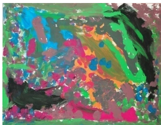
Slika broj 5. Učenički rad 3