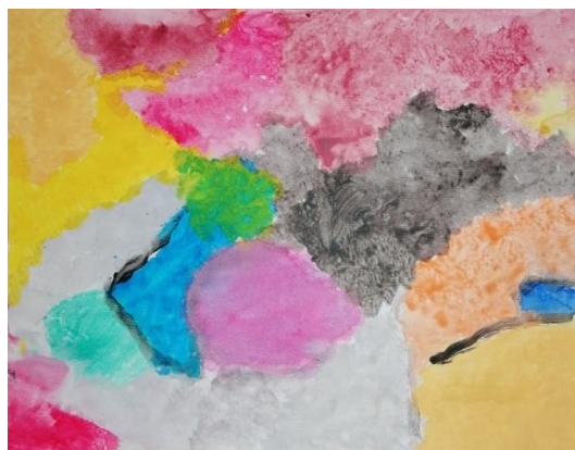
Slika broj 19. Učenički rad 17

Prikazani radovi slični su kako zbog palete korištenih boja, tako i zbog bojenja velikih površina papira i korištenja mnogo vode tijekom slikanja. Na prvom radu (Učenički rad 16) korištena je različita gustoća boja te su vidljivi potezi kistom, dok isti izostaju na drugom radu (Učenički rad 17). Zbog korištenja različite gustoće boje, odnosno veće ili manje uporabe vode tijekom slikanja, na prvom radu su boje intenzivnije i jače dok se drugi rad odlikuje prozirnošću boja. U oba slučaja korištene su tople i svijetle boje uz manji postotak upotrebe hladnih boja te crne. Vidljivo je i slikanje bojom preko boje te tehnika slikanja mokro na mokro. Učenice su bile smirene i usredotočene te koristile lagane poteze kistom bez intenzivnih pritisaka. Vidljiv je utjecaj umjetničke reprodukcije Improvisation 31 (Sea Battle) .