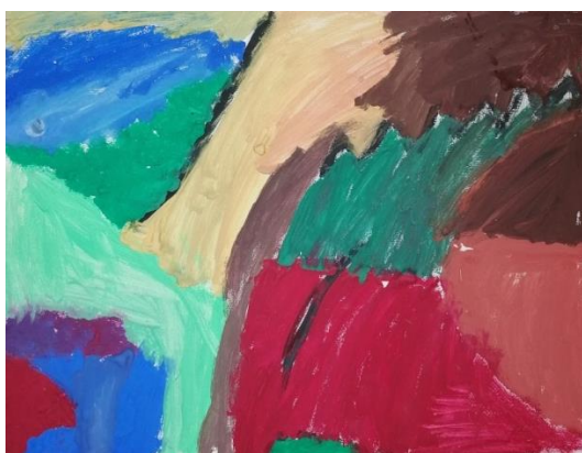
Slika broj 20. Učenički rad 18

Prikazani radovi slični su kako zbog palete korištenih boja, tako i zbog bojenja velikih površina papira i korištenja mnogo vode tijekom slikanja. Na prvom radu (Učenički rad 16) korištena je različita gustoća boja te su vidljivi potezi kistom, dok isti izostaju na drugom radu (Učenički rad 17). Zbog korištenja različite gustoće boje, odnosno veće ili manje uporabe vode tijekom slikanja, na prvom radu su boje intenzivnije i jače dok se drugi rad odlikuje prozirnošću boja. U oba slučaja korištene su tople i svijetle boje uz manji postotak upotrebe hladnih boja te crne. Vidljivo je i slikanje bojom preko boje te tehnika slikanja mokro na mokro. Učenice su bile smirene i usredotočene te koristile lagane poteze kistom bez intenzivnih pritisaka. Vidljiv je utjecaj umjetničke reprodukcije Improvisation 31 (Sea Battle) .