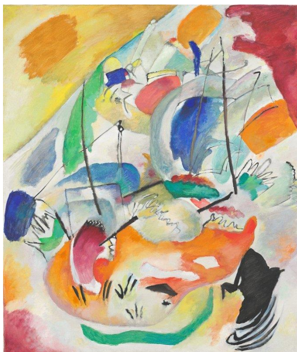
Slika broj 2. Vasilij Kandinski – Improvisation 31 (Sea Battle) , 1913.

Nakon analize prvog umjetničkog djela, učenicima je prikazano drugo djelo istog autora - Improvisation 31 (Sea Battle) . Učenici su drugo djelo lakše, brže i samostalnije analizirali te zaključili da je djelo svjetlije, da sadrži manje likovnih elemenata te da je prisutno više ploha nego linija. Prevladavaju osnovne i čiste boje te ima manje miješanja boja, ali je djelo također apstraktno, razigrano i ispunjeno bojom.