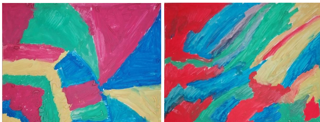
Slika broj 22. Učenički rad 20

drugom radu (Učenički rad 19) vidljivi su kružni pokreti rukom. Već spomenuti kružni pokreti su svakom djetetu najprirodniji pa možemo zaključiti da je učenik bio opušten tijekom stvaralačkog procesa. Na prvom radu (Učenički rad 18) osim brzih poteza u različitim smjerovima, možemo uočiti (tamno zelena površina u gornjem lijevom kutu) i intenzivno pritiskanje kista na površinu papira. Izuzev različitih ploha, učenici su svoje radove upotpunili crnim valovitim i ravnim linijama koje odudaraju od pozadine.