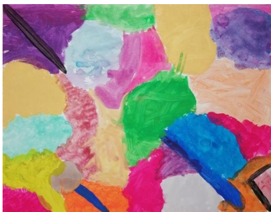
Slika broj 18. Učenički rad 16