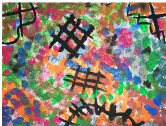
Slika broj 12. Učenički rad 10