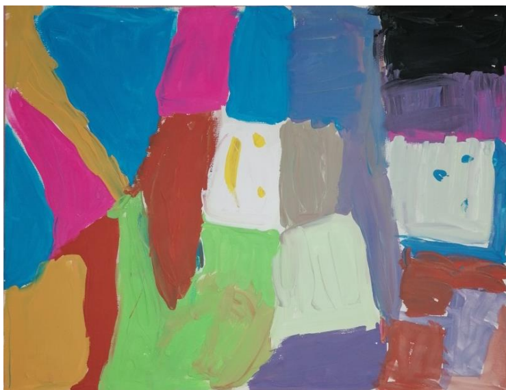
Slika broj 24. Učenički rad 22

Prikazani rad također se sastoji od obojanih ploha, a uglavnom prevladavaju intenzivne hladne i tercijarne boje. Plohe su prvotno nacrtane, a zatim smirenim i polaganim potezima obojene. U sredini rada vidljiv je shematski prikaz „smješka“ te samim time likovni rad nije u potpunosti apstraktan. Učenik se poigrao miješanjem boja te vrlo smireno izvršavao zadatak. Utjecaj glazbe i umjetničkih djela nije prepoznatljiv.