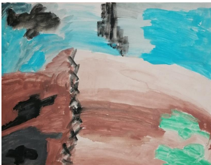
Slika broj 25. Učenički rad 23.

Prikazani rad također se sastoji od obojanih ploha, a uglavnom prevladavaju intenzivne hladne i tercijarne boje. Plohe su prvotno nacrtane, a zatim smirenim i polaganim potezima obojene. U sredini rada vidljiv je shematski prikaz „smješka“ te samim time likovni rad nije u potpunosti apstraktan. Učenik se poigrao miješanjem boja te vrlo smireno izvršavao zadatak. Utjecaj glazbe i umjetničkih djela nije prepoznatljiv.