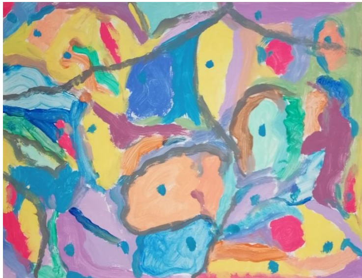
Slika broj 13. Učenički rad 11

Na sljedećim učeničkim radovima vidljiv je utjecaj umjetničke reprodukcije promatrane i analizirane tijekom motivacijskom dijela sata. Korištene su podjednako tople i hladne boje te jarki i zagasiti tonovi. Na prvom radu (Učenički rad 9) sličnost je vidljiva u zanimljivoj i razigranoj kompoziciji te odabiru tamnijih tonova zelene i plave boje, dok su na drugom radu (Učenički rad 10) sličnosti vidljive u crnim linijama koje odudaraju od pozadine. Suprotno korištenju sličnih boja, potezi kistom se vrlo razlikuju. Prvi rad je nastao energičnim i brzim potezima u različitim smjerovima, dok su na drugom radu vidljivi udarci kistom na površinu papira tvoreći pritom mrlje različitih boja. Oba rada su vrlo heterogena i kompozicijski zanimljiva.