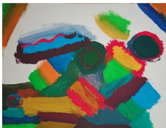
Slika broj 15. Učenički rad 13

Prikazani rad poseban je zbog odabira pastelnih i nježnih tonova boja te korištenja velike količine vode tijekom slikanja. Slikanje je teklo vrlo smireno i uravnoteženo, a vidljiva je i tehnika rada mokro na mokro. Korištene su podjednako hladne i tople boje, ali miješanjem boja, učenica je većinu rada prekrila hladnom plavom i ljubičastom bojom. Vidljivo je i razlijevanje boja te korištenje različitih poteza kistom čime su nastale cik-cak, razlomljene, ravne i valovite linije.