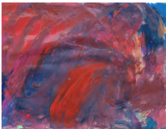
Slika broj 9. Učenički rad 7