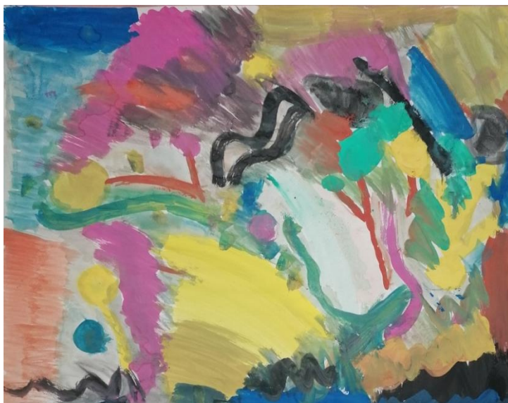
Slika broj 17. Učenički rad 15

Prikazan rad je vrlo cjelovit i razgranat, ali ne i u potpunosti apstraktan. Učenik je započeo sa slikanjem drveća, a nakon pojašnjenja pojma „apstraktno“, fokusirao se na miješanje boja te slikanje ploha i linija. Krajnji rezultat je vrlo heterogen s mnoštvom različitih boja. Vidljive su hladne i tople boje, kao i svijetle i intenzivne, ali i tamne i zagasite tercijarne boje. Tehnika slikanja je dinamična te su uočljivi brzi potezi kistom, a vidljiv je i utjecaj umjetničke reprodukcije u smislu slobodne kompozicije i preklapanja, odnosno miješanja boja.