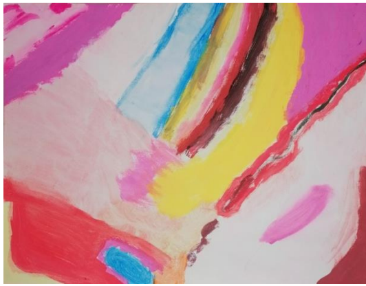
Slika broj 27. Učenički rad 25