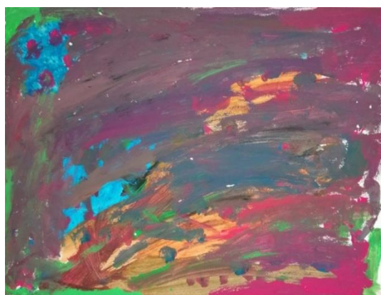
Slika broj 4. Učenički rad 2

Prikazani učenički rad nastao je „tapkanjem“ kistom po površini papira, a ne potezima. Odudaranje od patenta nalazi se u donjem lijevom kutu gdje su vidljive dvije plohe, ružičaste i tirkizne boje, kojima je učenik započeo svoj rad. Neovisno o drugačijem početku, učenik se tijekom sata odlučio za korištenje tamnih i zagastih nijansa pa radom dominiraju uglavnom hladne boje, odnosno plava, zelena i ljubičasta. Kompozicija rada vrlo je zanimljiva i složena zbog brzih udaraca kistom koji se pružaju u različitim smjerovima. Uočljiva je putanja i smjer kretanja boja po kojima možemo zaključiti da je dijete bilo vrlo smireno i koncentrirano tijekom stvaralačkog procesa.