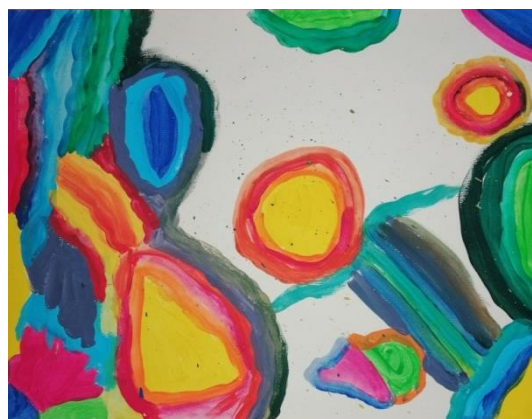
Slika broj 16. Učenički rad 14

Posljednja dva učenička rada nisu dovršena. Učenice su koristile podjednako hladne i tople boje oslikavajući plohe. Na prvom radu (Učenički rad 13) uglavnom dominiraju hladne i tamne boje, dok na drugom (Učenički rad 14) možemo