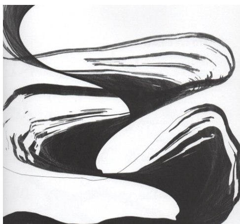
Slika 4. Što sve gmiže