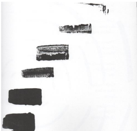
Slika 5. Što sve nestaje