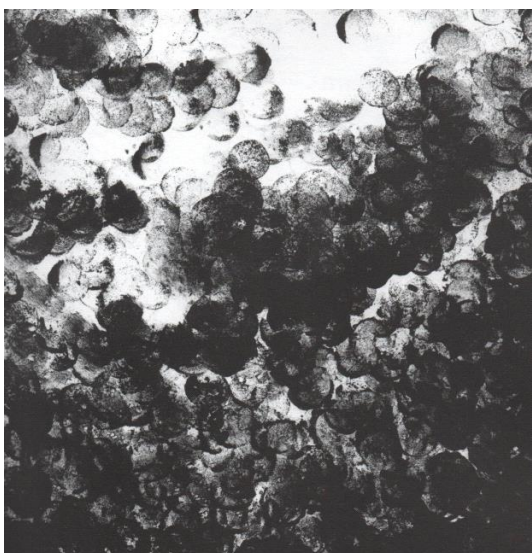
Slika 3. Što sve dimi