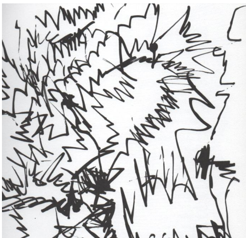
Slika 7. Što sve zvrnda