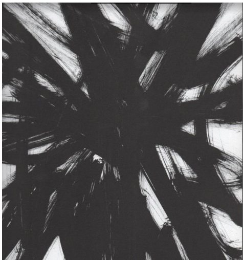
Slika 1. Što sve buči