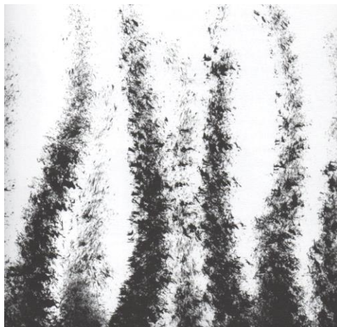
Slika 6. Što sve raste