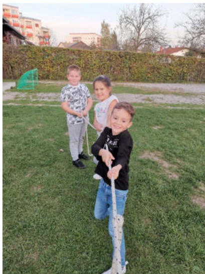
Slika 4. Tjelesna aktivnost kroz igre unutar kolektiva

Poticanje tjelesne aktivnosti u dječjim vrtićima ima vrlo velik udio u ukupnom kretanju kod djece predškolske dobi. Prema tome, razlikuje se više vrsta vježbi. U dječjim vrtićima prakticiraju se vježbe koje potiču razvoj prirodnih oblika kretanja. Također, djeca izvode i vježbe kojima razvijaju mišićne skupine cijelog tijela, ali i vježbe čiji primarni cilj nije tjelesna aktivnost, već razvoj discipline i kretanja grupa odnosno kolektiva.