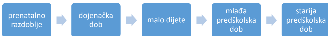
Slika 1. Grafički prikaz razdoblja u životu djeteta do polaska u školu, vlastiti rad autora

Iako se čini kako je predškolska dob vrlo rano razdoblje djetetova života, važno je skrenuti pažnju na određena razdoblja koja prethode toj fazi. Razvoj djeteta počinje već u majčinoj utrobi i tu je riječ o prenatalnom razdoblju. Ono traje otprilike devet mjeseci nakon kojih dijete dolazi na svijet i započinje sljedeću fazu svog života. To je dojenačka dob koja započinje djetetovim rođenjem i traje cijelu prvu godinu djetetova života. Još jedno razdoblje dijeli dijete od predškolske dobi, a to je razdoblje između prve i treće godine života u kojoj se radi o fazi malog djeteta. 1 Tek nakon nje slijedi predškolska dob koja se dijeli na mlađu i stariju predškolsku dob. Mlađa predškolska dob odnosi se na djecu od tri i četiri godine života, dok se starija predškolska dob odnosi na djecu pete i šeste godine života. Iako se predškolskim razdobljem može smatrati čak i posljednja godina dana života prije polaska u školu, važno je obuhvatiti šire razdoblje koji taj pojam obuhvaća.