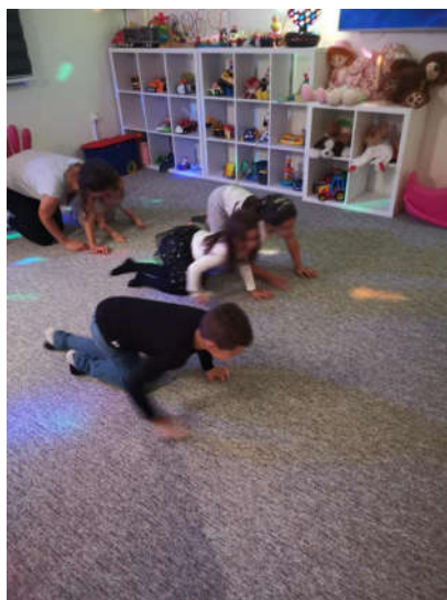
Slika 3. Primjer tjelesne aktivnosti u dječjem vrtiću

Osim roditelja, važno je da tjelesnu aktivnost potječu i odgojno – obrazovni djelatnici koji su gotovo svakodnevno u kontaktu s djecom.