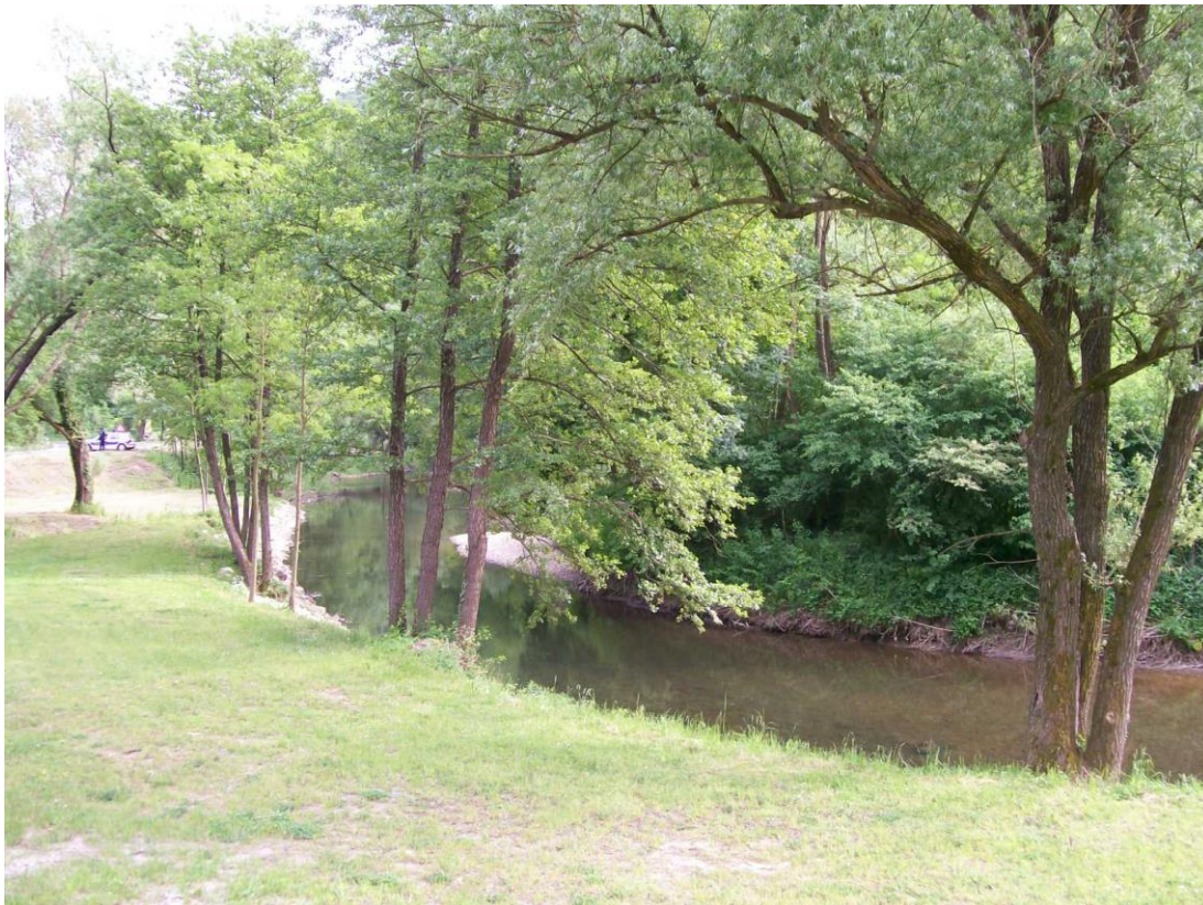
Slika 7. Rijeka Sutla kod Zelenjaka

krajobraz. Tamo se nalazi spomenik hrvatskoj himni „ Lijepa naša“ u čast Antunu Mihanoviću. Sutla se ulijeva u Savu. Na Slici 7. možemo vidjeti rijeku Sutlu (Radović i sur. 2000).