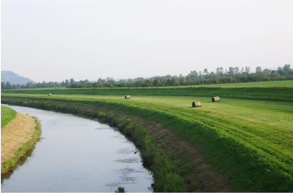
Slika 4. Rijeka Krapina kod Zaboka