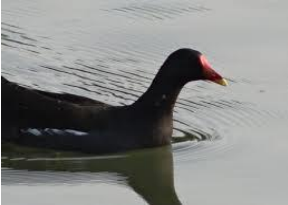
Slika 16. Mlakuša zelenoga na površini jezera