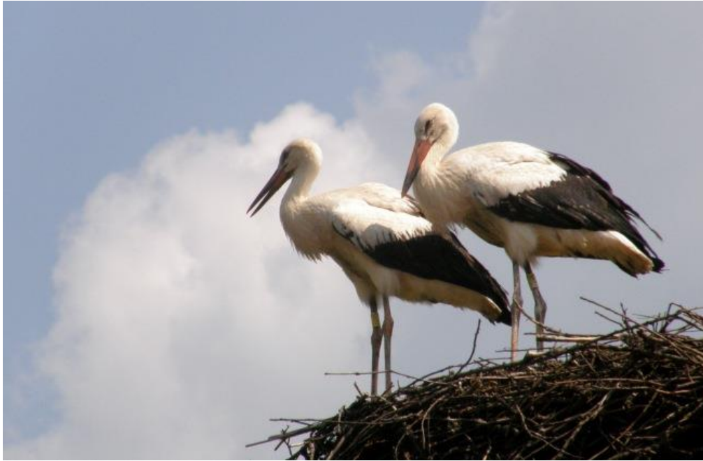
Slika 12. Bijele rode u gnijezdu