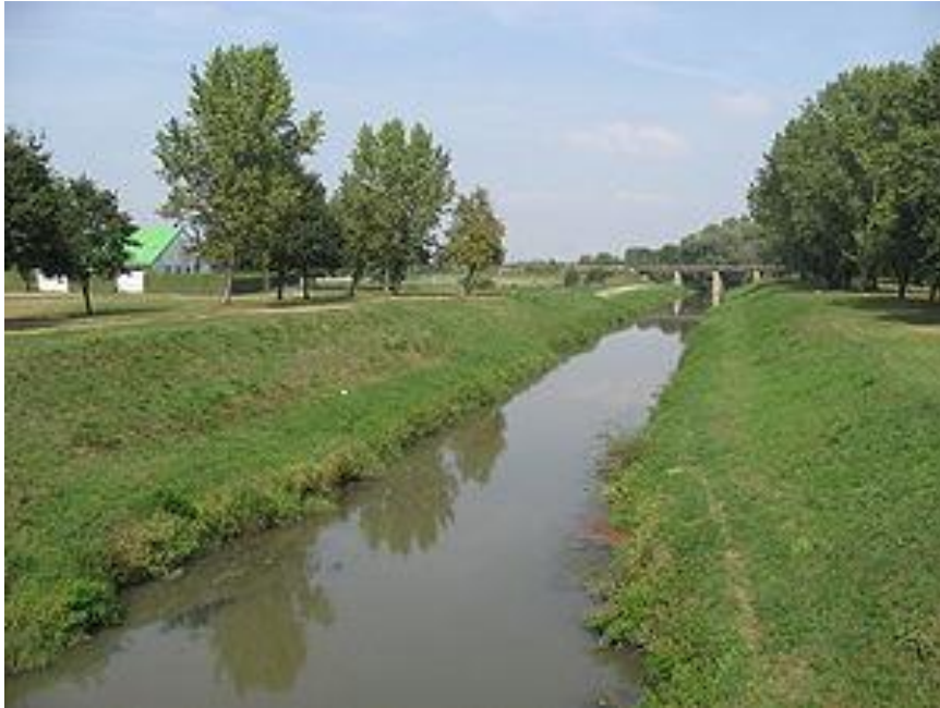
Slika 5. Rijeka Bednja u Ludbregu