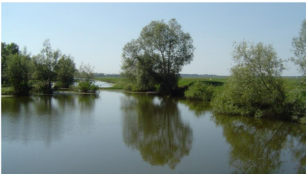
Slika 6. Rijeka Lonja kod Lonjskog polja