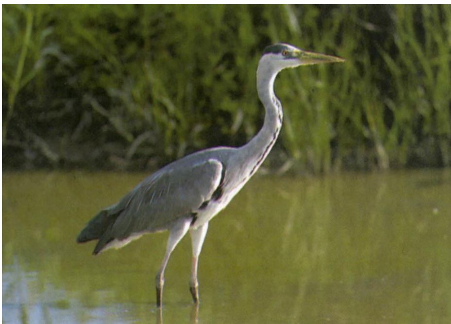
Slika 11. Siva čaplja na močvarnom području

postoji 1.500 do 2.500 parova. Status joj je siguran. U Krapinsko-zagorskoj županiji možemo je naći na području Bedekovčanskih jezera te na rijekama; Krapini, Bednji, Lonji i Sutli ( Krnjeta, 2008).