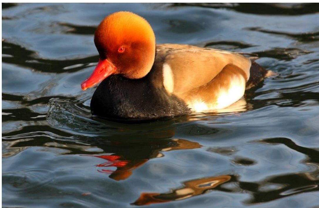
Slika 15. Patka gogoljica na površini rijeke

Kod patke se gogoljice ( Netta rufina ) mužjak i ženka razlikuju). Mužjak ima jarko kestenjastu glavu, ružičasti kljun, crni vrat i prsa te svijetao truh i bijelu krilnu prugu, a ženka je svijetlosmeđa ptica s bijelim obrazima. Gnijezdi se jednom godišnje od svibnja do lipnja. U gnijezdo na zemlji polaže 8-11 zelenih jaja, a vodi ih 45- 50 dana. Prvo gniježđenje imaju u prvoj godini. Nastanjuju jezera obrasla vegetacijom. Hrane se vodenim biljem, a životni im je vijek 10 godina. Slika 13. prikazuje patku gogoljicu. Karakteristična je po tome što zaranja samo prvim dijelom tijela. Status joj je siguran. U Krapinsko-zagorskoj županiji možemo je naći na području Bedekovčanskih jezera ( Krnjeta, 2008).