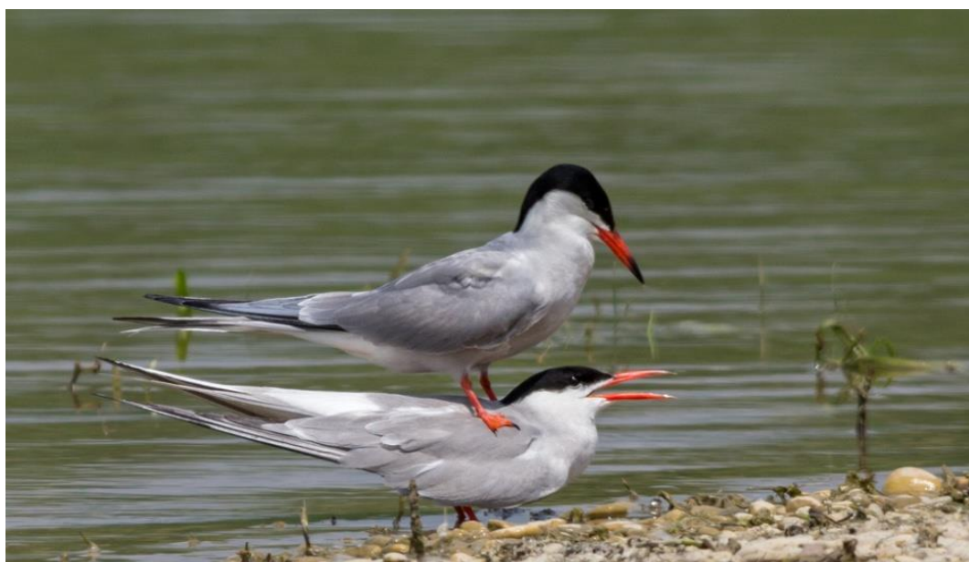
Slika 19. Crvenokljuna čigra na obali jezera

Crvenokljunu čigru ( Sterna hirundo ) krasi crveni kljun i prsa. Vrat i krila su bijeli, a krila i leđa jesu sive boje. Spolovi su slični. Crvenokljuna čigra ima jedno gniježđenje od ožujka do kolovoza. Kolonijalno, u udubinu tla polaže 2-3 kremasto-smeđa jaja koja inkubiraju i mužjak i ženka, a mlade hrani 21-26 dana. Prvo gniježđenje imaju u prvoj godini života. Stanište joj je uz rijeke, a živi do 10 godina. Slika 17. prikazuje crvenokljune čigre. Status joj je siguran. U Krapinsko-zagorskoj županiji možemo je naći na području Bedekovčanskih jezera te na rijeci Krapini (Krnjeta, 2008).