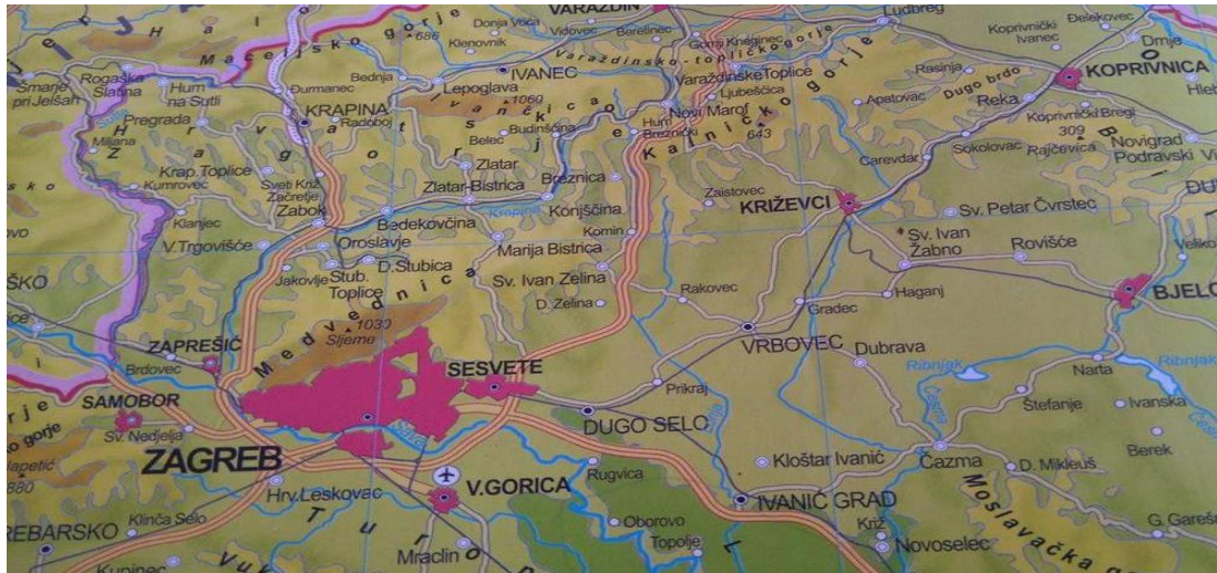
Slika 3. Geografski smještaj Krapinsko- zagorske županije