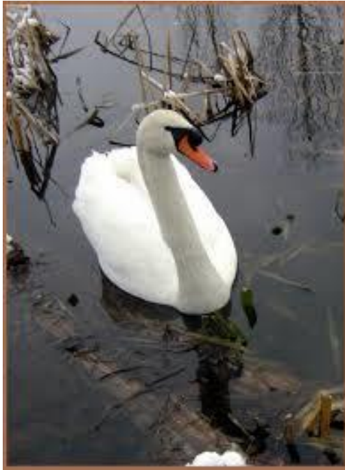
Slika 14. Crvenokljuni labud na površini bajera