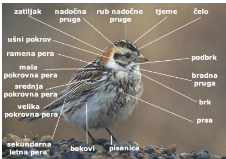
Slika 9. Građa tjelesnog pokrova ptice.