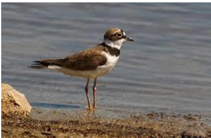
Slika 17. Kulik sljepić na obali jezera

Kulika sljepića ( Charadrius dubius ) možemo prepoznati po žutom očnom okviru, tamnom kljunu i žućkastim nogama dok mu je ruho sastavljeno od smeđih leđa, svijetlog trbuh te crne prsne i nadprsne pruge. Gnijezdi se dva puta godišnje od travnja do rujna. U dubine tla između šljunka polaže 4 smeđa jaja s tamnim točkama koje inkubiraju mužjak i ženka te ih hrane 24-27 dana. Slika 15. prikazuje kulika sljepića . Prvo gniježđenje ima u prvoj godini. Životna dob mu je 5-10 godina. Status mu je siguran. U Krapinsko-zagorskoj županiji možemo ga naći na području Bedekovčanskih jezera te na rijekama: Krapini, Bednji, Lonji i Sutli ( Krnjeta, 2008).