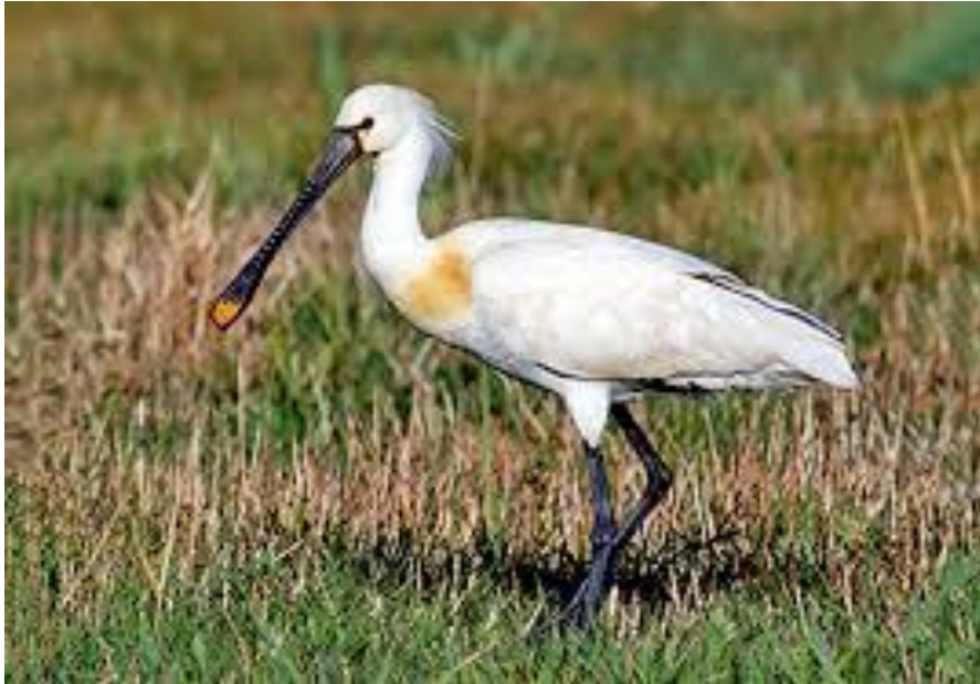
Slika 13. Žličarka u polju