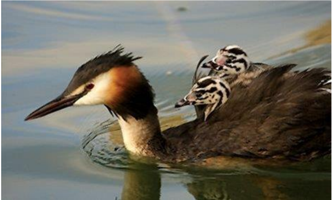
Slika 10. Čubasti gnjurac na površini jezera