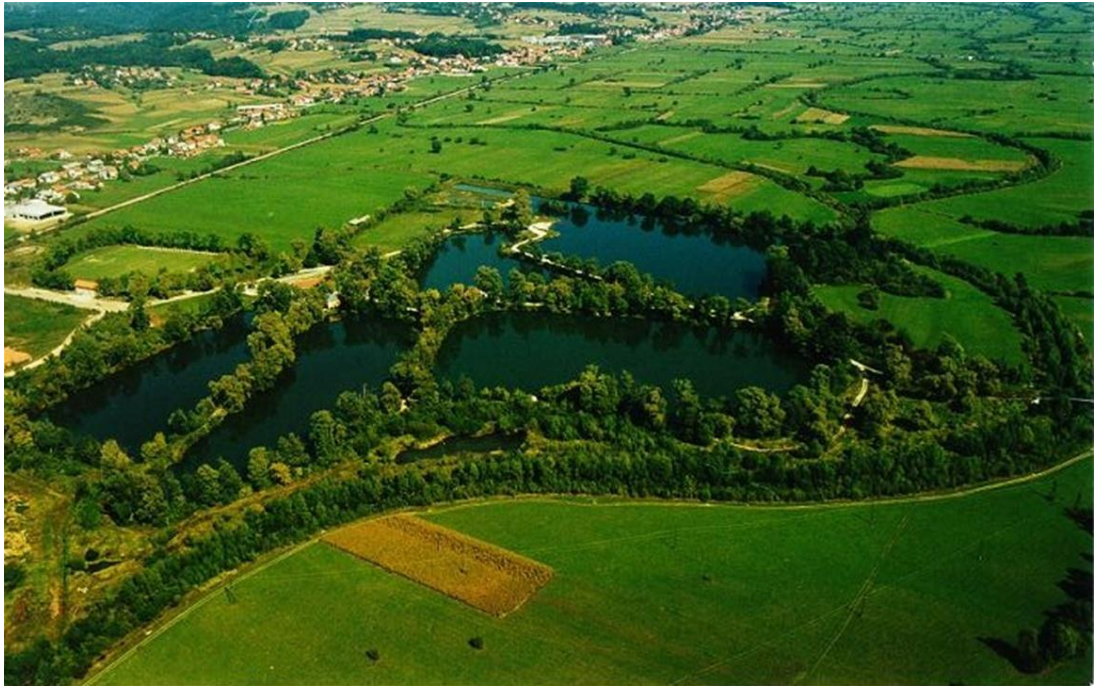
Slika 8. Bedekovčanska jezera

rijeku Krapinu. Kakvoća vode u jezerima je zadovoljavajuća za piće pa je određena kao moguća rezerva u slučaju elementarnih nepogoda posebno u Plavom (Modrom) jezeru. Ovo vlažno područje dobro je stanište za život ptica (Krapinsko-zagorska županija, 2010.)