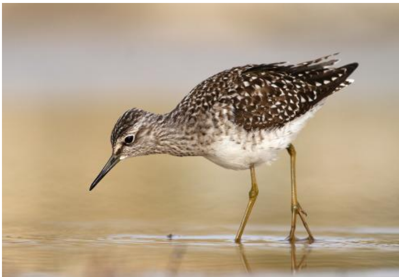
Slika 18. Prutka migavica na vodi

sa smeđim točkama. Inkubiraju ih i mužjak i ženka te ih vode 35-40 dana. Prvo gniježđenje imaju u prvoj godini. Nastanjuju močvare. Na Slici 16. možemo vidjeti prutku migavicu. Hrani se beskralježnjacima i insektima. Životna dob joj je do 10 godina. Status joj je u opadanju. U Krapinsko-zagorskoj županiji možemo je naći na rijekama Lonji i Sutli (Dolenec, 2013).