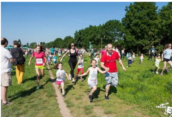
Slika 12 Zajednička obiteljska rekreacija

Primarna razina prevencije pretilosti usmjerena je populaciju, kako bi se informiralo o značaju pretilosti za zdravlje. Programi primarne prevencije su usmjereni prema trudnicama, djeci i adolescentima.. Strukture nacionalne, regionalne i lokalne vlasti svojim zanimanjem, financijskom potporom i razumijevanjem važni su u provođenju tih programa. Dobri primjeri su: dostupnost sportskih terena i plivališta. izgradnja biciklističkih i pješačkih staza, te ostalog za dječju rekreaciju.