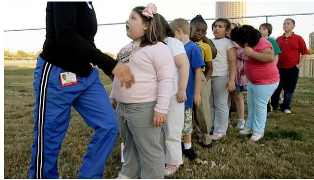
Slika 3 Grupa pretile djece

Neadekvatna prehrana i tjelesna aktivnost te uzrokujući unos energije veći od potrošnje, najvažniji su čimbenici rizika od epidemije modernoga doba - pretilosti. Suvremeno se društvo suočava sa sve većim javnozdravstvenim problemom rastućeg broja pretilih osoba svih dobnih skupina, a osobito zabrinjava trend povećanja broja pretile djece. Osobito je važno praćenje prehrane i stanja uhranjenosti djece i mladeži, jer su te ugrožene skupine u razdoblju najbržeg rasta i razvoja, pa su ujedno i dobar pokazatelj prehrambenog stanja u lokalnoj zajednici. Nepravilna i nedostatna prehrana može značajno utjecati na rast i razvoj djece i mladeži, te privremeno ili čak trajno ugroziti njihovo zdravstveno stanje (Antonić-Degač, K., 2004.)