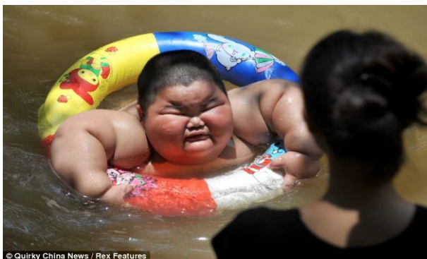
Slika 13 Pretili trogodišnjak pliva

http://www.dailymail.co.uk/news/article-1368790/Lu-Hao-Chinese-toddler-3-weighs-staggering-132lbs-hes-growing.html