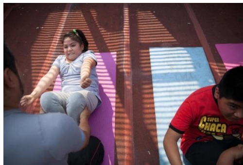
Slika 10 Pretila devetogodišnja djevojčica pri izvođenju tjelesne aktivnosti

Većinu djece koja je pretila, potrebno je poticati u održavanju vlastite tjelesne težine, tako da je izrastu, rastom u visinu. Nikako ih ne treba stavljati na redukcijsku dijetu bez medicinskog nadzora, jer se može ugroziti djetetov rast. U dobi od prve do pete godine starosti uz dijetetski pristup potrebno je poticati tjelesnu aktivnost djeteta primjerenu mogućnostima. Naglasak je na vježbanju, a ne na dijeti (Bralić, I., 2014.).