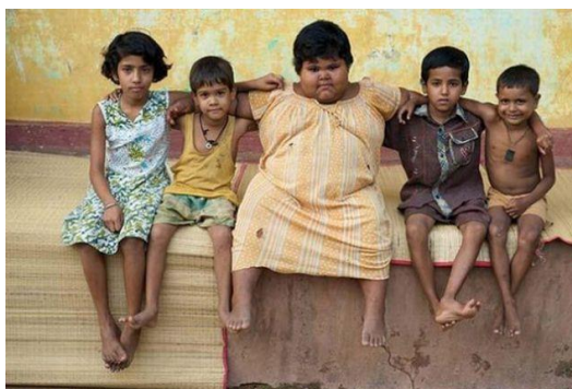
Slika 5 Pretila petogodišnja djevojčica u društvu vršnjaka