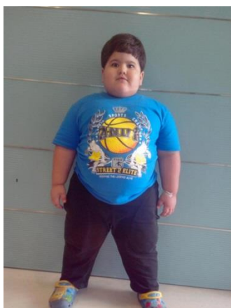
Slika 4 Pretili četverogodišnji dječak

Pretilost nastaje kao rezultat nepravilnih životnih i prehrambenih navika pojedinca i njegove obitelji. Pretilost kod djece donosi brojne zdravstvene rizike kao što su: kardiovaskularne bolesti, dječja hipertenzija, dijabetes, problemi sa zglobovima, a sve su češće smetnje s disanjem tijekom spavanja. Takva djeca imaju brojne psihičke probleme u smislu druge djece prema njihovom punašnom izgledu. Vršnjaci ih često izbjegavaju i zadirkuju, čime lakše gube samopoštovanje i sklonija su depresiji.