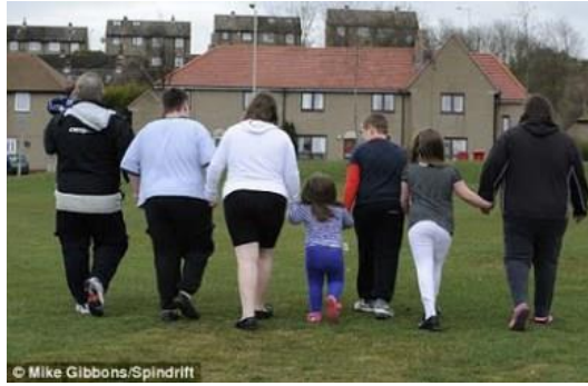
Slika 9 Pretila obitelj

https://theyouthofhealth.wordpress.com/2013/05/12/inside-the-life-of-an-obese-child-2/