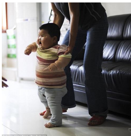
Slika 14 Pretili jedno i pol godišnji dječak u pokušaju hodanja uz podršku majke

U poduzimanju mjera prevencije se treba paziti, da se pretilo dijete ne usmjeri prema potpuno suprotnom smjeru poremećaja prehrane (anoreksija i bulimija). U radu s pretilom djecom i njihovim obiteljima važna je motivacija, empatija stručnjaka te stalna potpora. Iako rješenje problema pretilosti zahtjeva angažiranost stručnjaka različitih specijalnosti, aktivnosti treba usmjeravati prema obitelji u kojoj se stvaraju i oblikuju prehrambene navike i stil života članova obitelji.