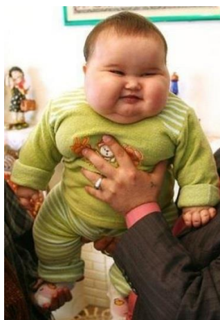
Slika 11 Pretilost šestomjesečne djevojčice izazvana čestim hranjenjem

U dojenačkom razdoblju, edukacija se sastoji od preporuka za dojenje, prepoznavanja prejedanja, zaustaviti hranjenje prije nego što se beba prepuni. Ako siše, ne treba je previše često dojit, npr. svakog sata, bebe koje bi htjele često sisati ne rade to zbog gladi, već zbog ugone ili nesigurnosti. Ako se dojenče hrani adaptiranim mlijekom, bočica ne treba biti spremna u svakom trenutku i ne treba hraniti bebu, kad god zaplače jer plač ne mora značiti da je gladna ili žedna. Poznato je da su prve tri godine razdoblje intelektualnog i psihičkog oblikovanja, to je također razdoblje oblikovanja zdravih navika u prehrani (Bralić, I., 2014.).