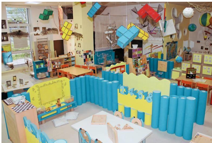
Slika 3. Organizacija prostora u DV Dječja igra

potencijala, umijeća i vještina svakog djeteta. Slika 3. prikazuje jedan od prostora u tom dječjem vrtiću, pa je na slici vidljivo kako je prostor pun boja i raznih poticaja za učenje, npr. slova i brojeva, te dječjih radova, pribora za izražavanje kreativnosti i slično.