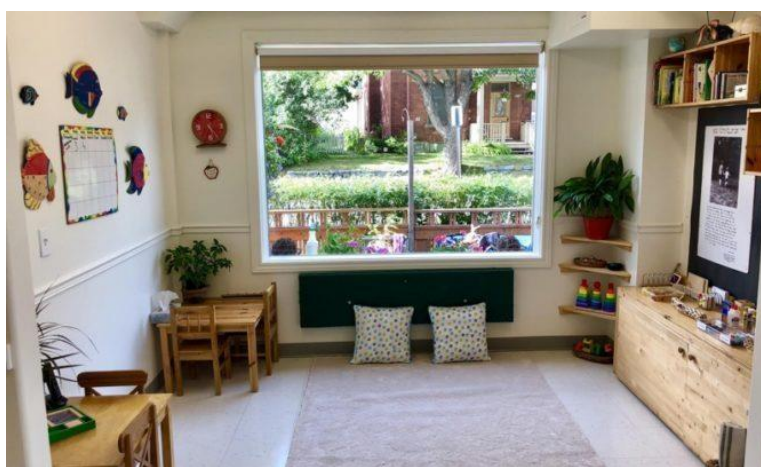
Slika 1. Primjer organizacije prostora u Reggio vrtiću, (Izvor: Mrežne stranice Glebe Reggio Centre)

djetetu za istraživanje. Dječji vrtić kao mjesto za kognitivni i socijalni razvoj vodi računa o odabiru materijala i njegovom smještanju u prostoru kako bi bio poticajan za interakciju, razgovor među sudionicima. Dobro planiranim prostorno-materijalnim okruženjem osigurava se rast i razvoj svakog pojedinog djeteta. Takvo okruženje doprinosi stvaranju kulture i osigurava suradnju odgojitelja i roditelja (Edwards i sur., 1998). Primjer organizacije Reggio prostora u vrtiću (Slika 1.) prikazuje prostor pun nježnih boja, puno prirodnog svjetla, kutije s raznovrsnim materijalom za poticanje kreativnosti, stol za dječju kreativnost, mnogo igračaka i drugih alata koji omogućavaju kreativnu ekspresiju djeteta.