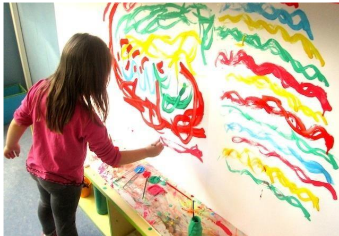
Slika 4. Izražavanje dječje kreativnosti u DV Dječja igra

Na Slici 4. vidljivo je dijete koje pohađa prethodno spomenuti dječji vrtić koje bojama ukrašava zid i time izražava svoju kreativnost.