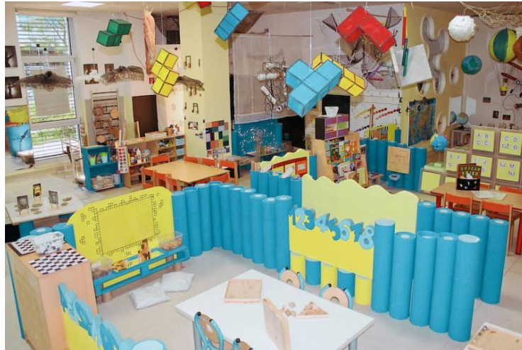
Slika 3. Organizacija prostora u DV Dječja igra

potencijala, umijeća i vještina svakog djeteta. Slika 3. prikazuje jedan od prostora u tom dječjem vrtiću, pa je na slici vidljivo kako je prostor pun boja i raznih poticaja za učenje, npr. slova i brojeva, te dječjih radova, pribora za izražavanje kreativnosti i slično.