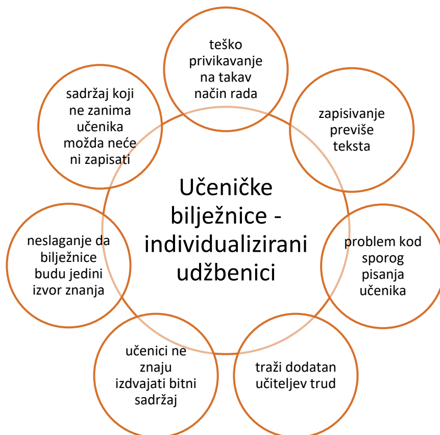
Graf 2. Mišljenje učiteljica o učeničkim bilježnicama koji služe kao udžbenici

U grafu su mišljenja učiteljica o učenikovo samostalnoj izradi bilježnica koje služe kao udžbenik.