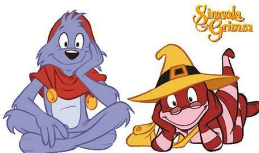
Slika 3: Likovi Jojo i Kroki iz Simsale Grimm

životinje koju utjelovljuje, poput tvrdoglavosti, ishitrenosti i nepromišljenosti. Lik s desne strane je doktor Kroki, biće nalik gušteru. Za razliku od Joja, Kroki ne utjelovljuje osobine slične onima koje ima životinja koju prikazuje. On je mudar i promišljen, no ponekad se izgubi u svom djelovanju.