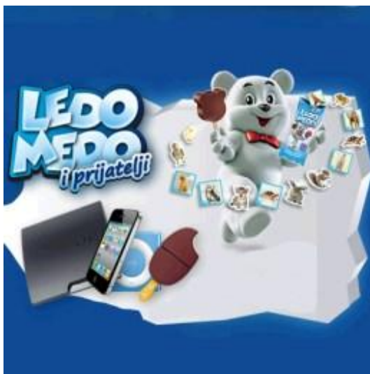
Slika 2: Ledo Medo dijeli super poklone

vrijedne poklone. Ovdje oglašivač pomoću atributa super opisuje sladoled i poklone što zapravo ne otkriva ništa o kvaliteti proizvoda, a uz to čitava reklama odiše subjektivnošću. U skladu s modernim društvom, Ledo kampanja uspješno prati trendove zbog čega ovaj put djeci nudi privlačne poklone kako bi kupovali sladoled i skupljali naljepnice. Također, može se primijetiti kako je prva vijest u reklami da je Ledo Medo donio novi sladoled što stvara uzbuđenje i želju da se što prije kuša novi okus sladoleda. Glazba u pozadini je opuštena, vesela i zvuči avanturistički dok ton glasa muškarca koji prenosi sadržaj poruke pobuđuje zabavu i uzbuđenje. Može se zaključiti da je sadržaj reklamne poruke vješto oblikovan, poruka je jasna, kratka i zanimljiva. Reklama traje dvadeset dvije sekunde što ju čini lako pamtljivom te zbog kratkoće ne pobuđuje dosadu već privlači i osvaja gledatelja.