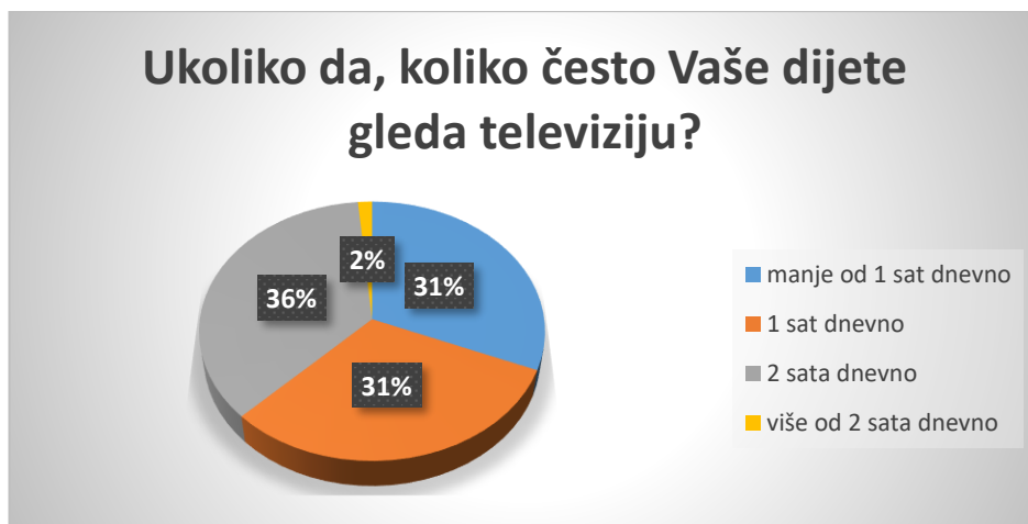
Slika 2. Učestalost gledanja televizije kod djece

Prema rezultatima istraživanja 31% djece televiziju gleda manje od 1 sat dnevno, isto tako 31% 1 sat dnevno, najveći broj djece (36%) televiziju gleda 2 sata dnevno, a 2% djece televiziju gleda više od 2 sata dnevno. Većina roditelja (85%) djece koja gledaju televiziju u potpunosti kontrolira sadržaj koji djeca gledaju, 15% samo djelomično kontrolira sadržaj, a niti jedan ispitanik ne dozvoljava djeci da samostalno bira sadržaj koji će gledati na televiziji.