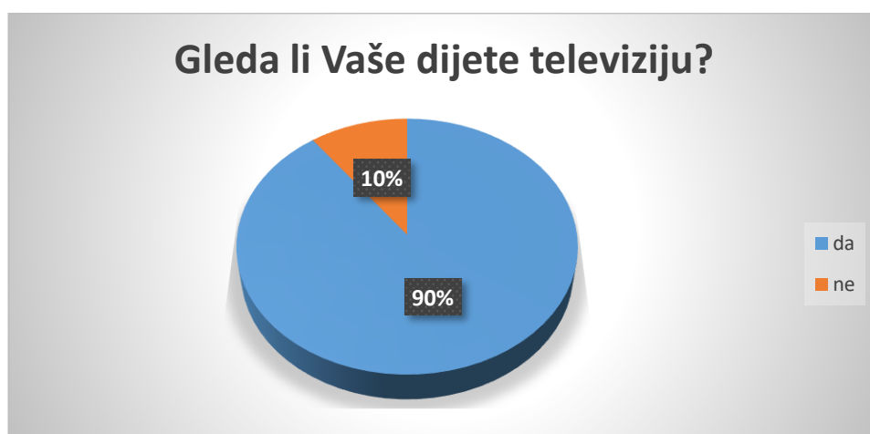
Slika 1. Navika gledanja televizije kod djece

U istraživanju je sudjelovalo 56% muške i 44% ženske djece rane i predškolske dobi, od čega je 8% u dobnoj skupini od 0 do 11 mjeseci, 33% u dobnoj skupini od 1 do 2 godine, 25% u dobnoj skupini od 3 do 4 godine, te 34% djece u dobnoj skupini od 5 do 6 godina.