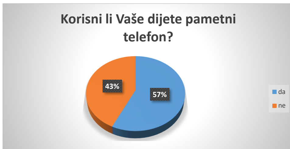
Slika 3. Navika korištenja pametnog telefona kod djece

Prema rezultatima istraživanja 31% djece televiziju gleda manje od 1 sat dnevno, isto tako 31% 1 sat dnevno, najveći broj djece (36%) televiziju gleda 2 sata dnevno, a 2% djece televiziju gleda više od 2 sata dnevno. Većina roditelja (85%) djece koja gledaju televiziju u potpunosti kontrolira sadržaj koji djeca gledaju, 15% samo djelomično kontrolira sadržaj, a niti jedan ispitanik ne dozvoljava djeci da samostalno bira sadržaj koji će gledati na televiziji.