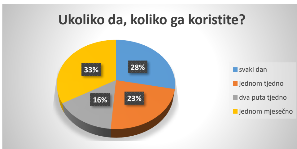
Slika 13. Učestalost korištenja računala u dječjem vrtiću

Istraživanje je pokazalo kako 38% odgojitelja koristi računalo, dok 62% odgojitelja ne koristi računalo u direktnom radu s djecom.