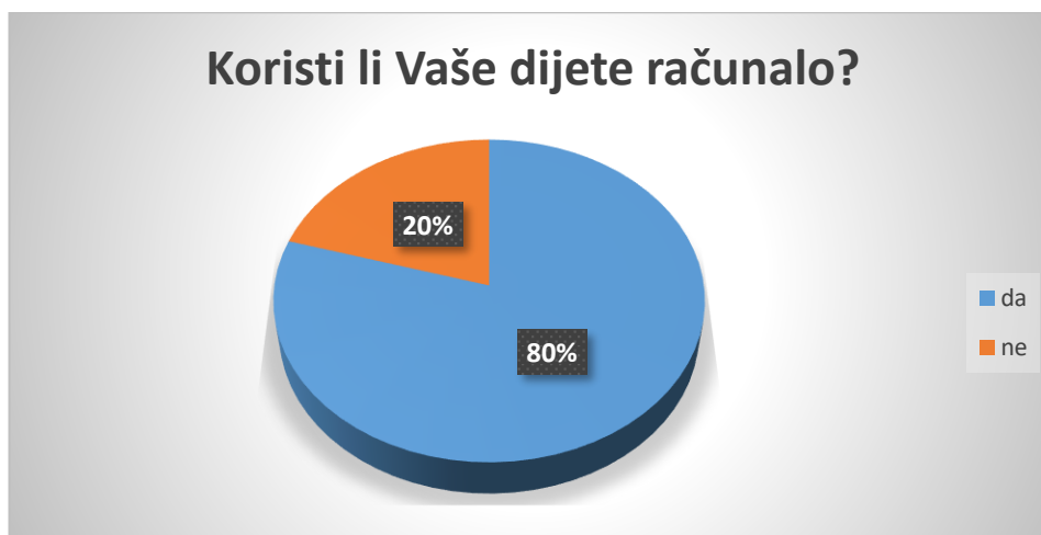
Slika 5. Navika korištenja računala kod djece

Kao što je vidljivo na slici 4., pametni telefon manje od 1 sat dnevno koristi 61% djece, 1 sat dnevno koristi 25%, dok po 7% djece pametni telefon koristi 2 sata dnevno i više od 2 sata dnevno. Većina roditelja (84%) djece koja koriste pametni telefon u potpunosti kontrolira sadržaj koji djeca koriste, njih 8% samo djelomično kontrolira sadržaj, dok 8% dozvoljava djeci da samostalno biraju sadržaj koji koriste na pametnom telefonu.