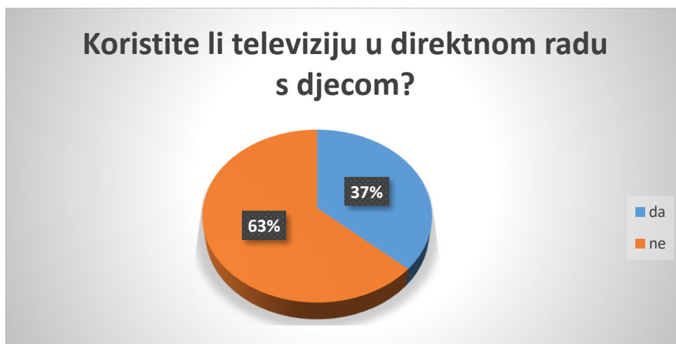
Slika 8. Navika korištenja televizije u dječjem vrtiću

Anketni upitnik za odgojitelje sastojao se od 20 pitanja (16 zatvorenog i 4 otvorena tipa). U istraživanju je sudjelovao 101 odgojitelj.