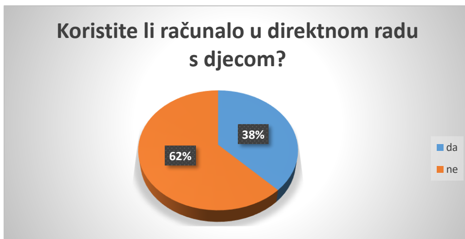
Slika 12. Navika korištenja računala u dječjem vrtiću

fotografija (55%), igranje mobilnih igara (3%), te za nešto drugo (29%), kao npr. slušanje audio priča, gledanje videozapisa, te za istraživanje edukativnih sadržaja.