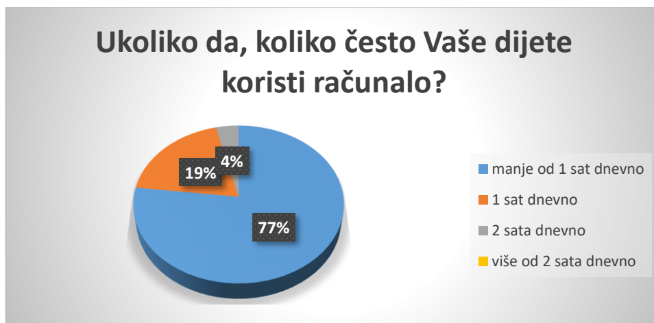
Slika 6. Učestalost korištenja računala kod djece

Istraživanje je pokazalo kako u svome domu 77% djece koristi računalo manje od 1 sat dnevno, 19% djece koristi 1 sat dnevno, 4% djece računalo koristi 2 sata dnevno, te nema djece koja računalo koriste više od 2 sata dnevno. Roditelji čija djeca koriste računalo u svojim domovima naveli su kako svi kontroliraju sadržaj koji djeca koriste na računalima.