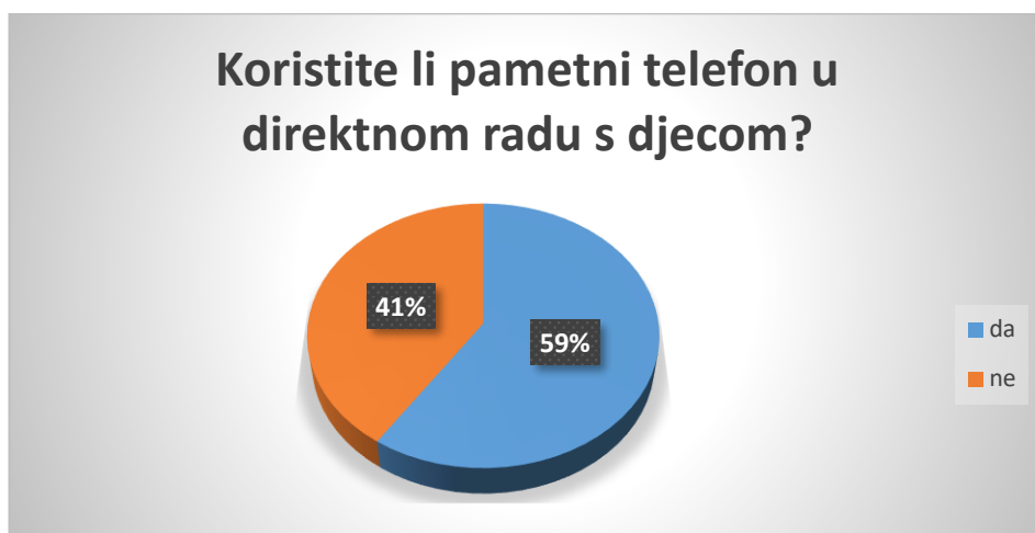
Slika 10. Navika korištenja pametnog telefona u dječjem vrtiću

odgojitelja koristi televiziju za gledanje dokumentarnih filmova, jednako toliko (46%) televiziju koristi za gledanje animiranih filmova, 56% je koristi za slušanje glazbe, a 13% je označilo kako televiziju koristi za nešto drugo. Sudionici navode gledanje fotografija i snimki djece kao druge aktivnosti korištenja televizije.