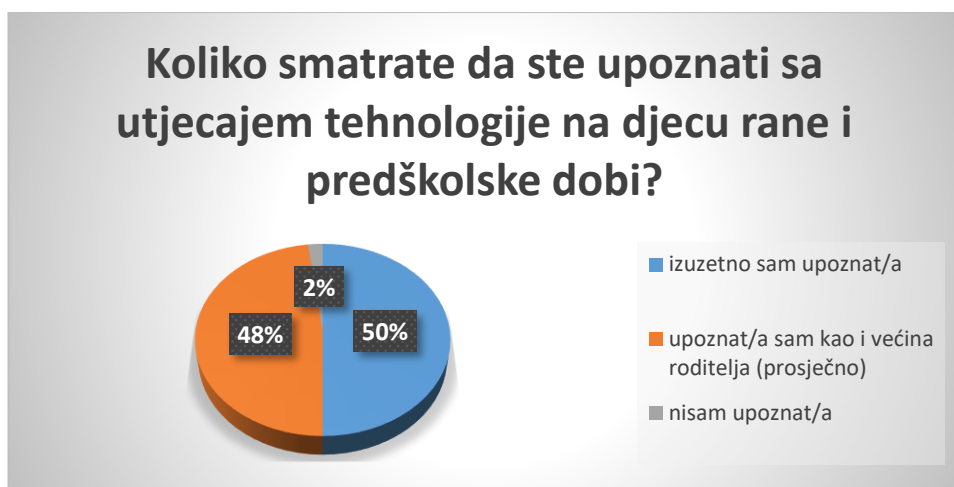
Slika 7. Razina svijesti roditelja o utjecaju tehnologije na djecu

Istraživanje je pokazalo kako u svome domu 77% djece koristi računalo manje od 1 sat dnevno, 19% djece koristi 1 sat dnevno, 4% djece računalo koristi 2 sata dnevno, te nema djece koja računalo koriste više od 2 sata dnevno. Roditelji čija djeca koriste računalo u svojim domovima naveli su kako svi kontroliraju sadržaj koji djeca koriste na računalima.