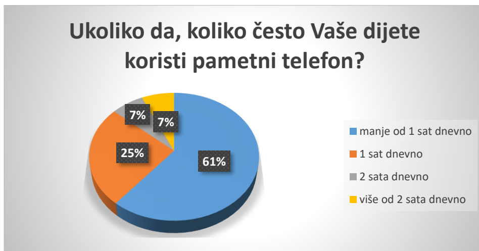
Slika 4. Učestalost korištenja pametnog telefona kod djece

Kao što je vidljivo na slici 4., pametni telefon manje od 1 sat dnevno koristi 61% djece, 1 sat dnevno koristi 25%, dok po 7% djece pametni telefon koristi 2 sata dnevno i više od 2 sata dnevno. Većina roditelja (84%) djece koja koriste pametni telefon u potpunosti kontrolira sadržaj koji djeca koriste, njih 8% samo djelomično kontrolira sadržaj, dok 8% dozvoljava djeci da samostalno biraju sadržaj koji koriste na pametnom telefonu.