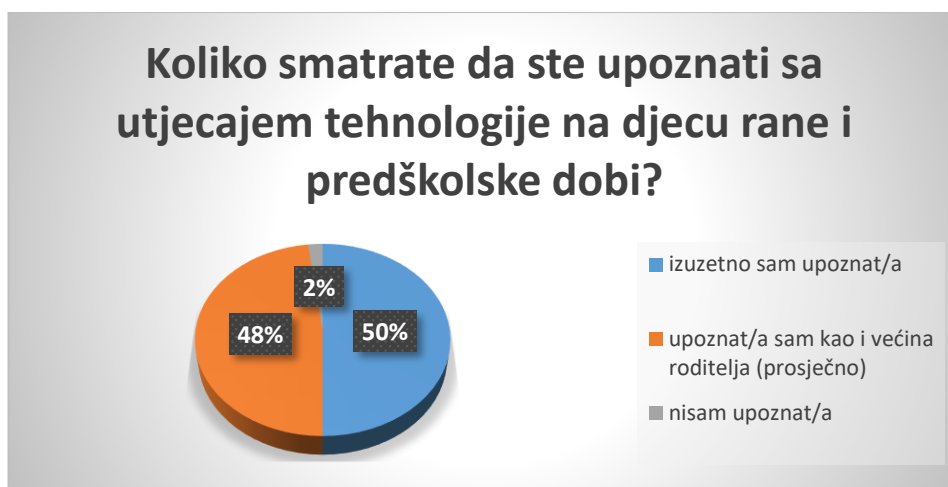
Slika 7. Razina svijesti roditelja o utjecaju tehnologije na djecu

Istraživanje je pokazalo kako u svome domu 77% djece koristi računalo manje od 1 sat dnevno, 19% djece koristi 1 sat dnevno, 4% djece računalo koristi 2 sata dnevno, te nema djece koja računalo koriste više od 2 sata dnevno. Roditelji čija djeca koriste računalo u svojim domovima naveli su kako svi kontroliraju sadržaj koji djeca koriste na računalima.