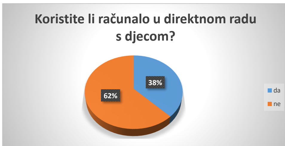
Slika 12. Navika korištenja računala u dječjem vrtiću

fotografija (55%), igranje mobilnih igara (3%), te za nešto drugo (29%), kao npr. slušanje audio priča, gledanje videozapisa, te za istraživanje edukativnih sadržaja.