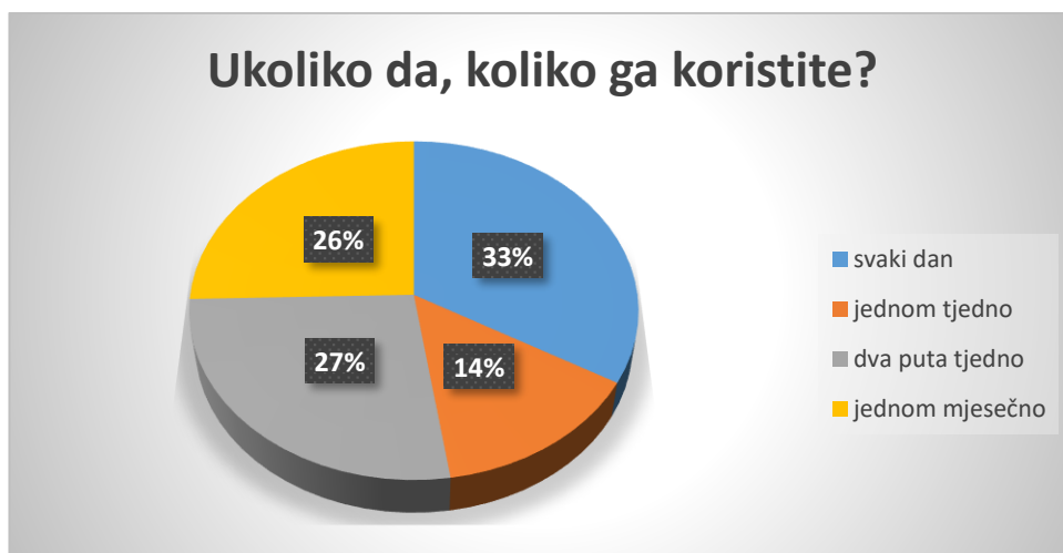
Slika 11. Učestalost korištenja pametnog mobitela u dječjem vrtiću

Na pitanje „Koristite li pametni telefon u direktnom radu s djecom?“, 59% ispitanika odgovorilo je da koristi, dok je 41% odgovorilo da ne koristi pametni telefon u direktnom radu s djecom.