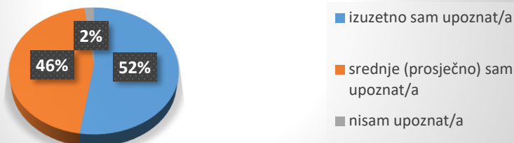
Slika 14. Razina svijesti odgojitelja o utjecaju tehnologije na djecu

U istraživanju smo doznali kako 52% odgojitelja smatra da su izuzetno upoznati sa utjecajem tehnologije na djecu, 46% smatra da su srednje, odnosno prosječno upoznati, dok samo 2% smatra kako nisu upoznati sa utjecajem tehnologije na djecu rane i predškolske dobi. Na pitanje „Biste li željeli da se tehnologija više koristi u radu s djecom u vrtićima?“ 39% odgojitelja odgovorilo je da bi željeli, dok 61% odgojitelja to ne želi.