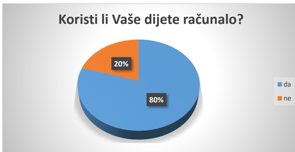
Slika 5. Navika korištenja računala kod djece

Kao što je vidljivo na slici 4., pametni telefon manje od 1 sat dnevno koristi 61% djece, 1 sat dnevno koristi 25%, dok po 7% djece pametni telefon koristi 2 sata dnevno i više od 2 sata dnevno. Većina roditelja (84%) djece koja koriste pametni telefon u potpunosti kontrolira sadržaj koji djeca koriste, njih 8% samo djelomično kontrolira sadržaj, dok 8% dozvoljava djeci da samostalno biraju sadržaj koji koriste na pametnom telefonu.