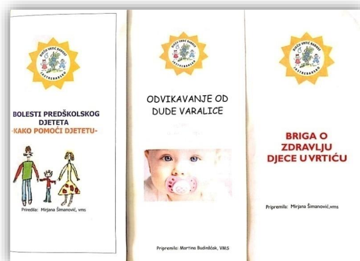
Slika 1. Primjer informiranja i motiviranja roditelja putem letaka u Dječjem vrtiću "Radost", Jastrebarsko

Letak „Bolesti predškolskog djeteta – kako pomoći djetetu“ (Slika 1) pruža informacije kako prepoznati znakove bolesti i na koji način roditelj može najbolje pomoći svojem djetetu. Letak „Odvikavanje od duche varalice“ informira o dobrim i lošim stranama korištenja duche, kako održavati i koristiti duche te daje savjete na koji način odviknuti dijete od duche. Naposljetku, letak „Briga o zdravlju djece u vrtiću“ kaže da je jedno od temeljnih dječjih prava - pravo na zdravlje te na koji se način provodi zdravstvena zaštita u vrtiću, koji su najčešći zdravstveni problemi djece i kako pomoći bolesnom djetetu.