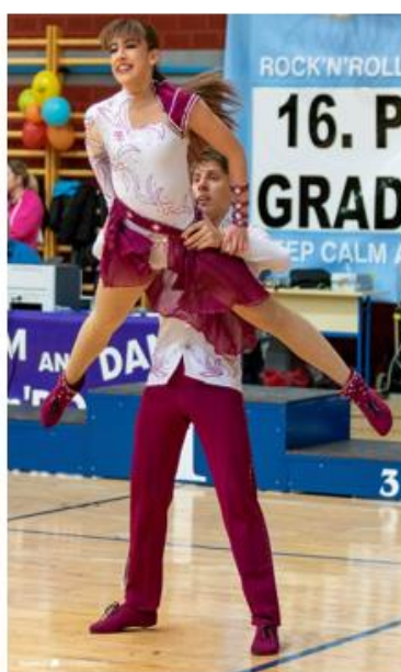
sigurnosni nivo 4