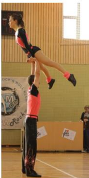
sigurnosni nivo 3