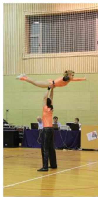
sigurnosni nivo 2