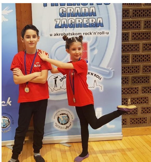
Slika 7. Mlađi osnovci 2

Ove kategorije ne dijele se prema dobi djece već po tome koji su razred osnovne ili srednje škole. Mlađe osnovce 1 i mlađe osnovce 2 čine učenici osnovnih škola do 5.razreda. Razlikuju se po tome što su mlađi osnovci 1 početnici koji se u toj kalendarskoj godini natječu prvi puta, dok su mlađi osnovci 2 napredniji, odnosno prethodnu su godinu već pristupili natjecanjima. Stariji osnovci su učenici škola viši od 5.razreda, ali još nisu spremna za profesionalna natjecanja. Formacije imaju jednaku dobnu podjelu, a sastoje se od sljedećih kategorija: