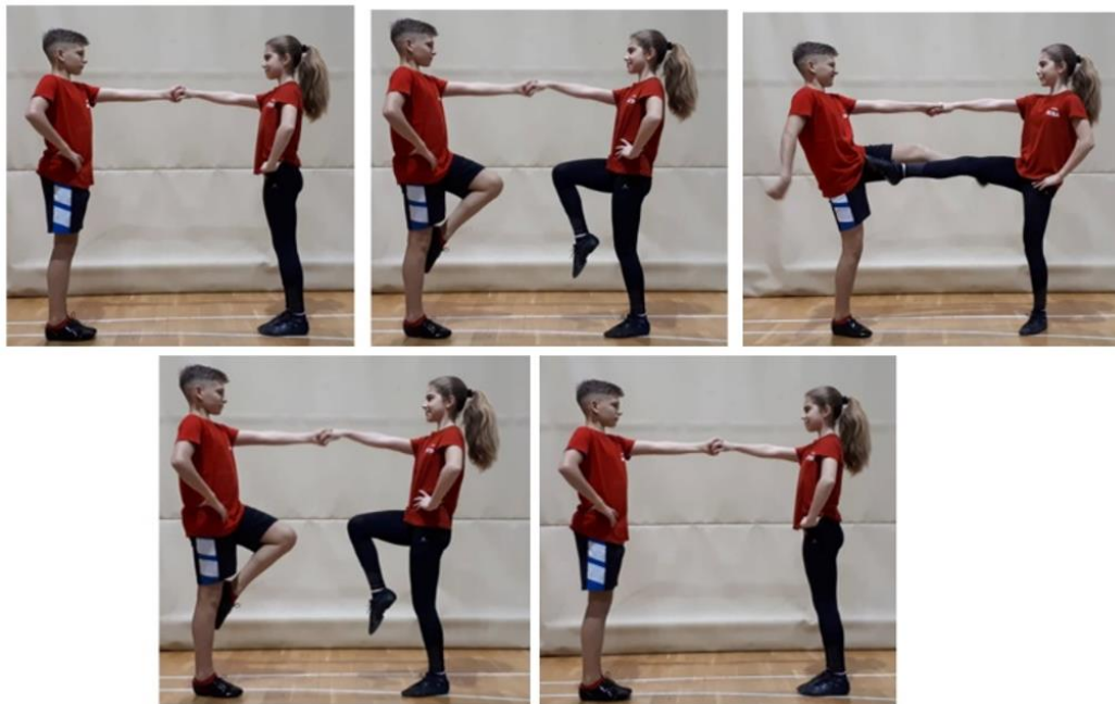
Slika 1. Osnovni korak (držanje, podizanje koljena, ispućavanje 'kicka', pogrčena koljena, spuštanje noge)

Razlikujemo i nekoliko varijanti osnovnih koraka, poput francuskog - kada ženski i muški partner izvode duple 'kickove' bez okretanja bokova te ih izvode sasvim ravno, te npr. švicarski - kada ženski i muški partner izvode duple 'kickove' sa okretanjem bokova pa ih iz tog razloga izvode malo na stranu.