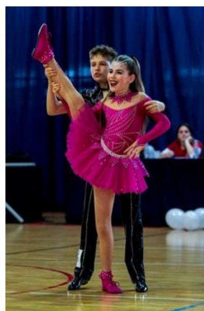
sigurnosni nivo 5