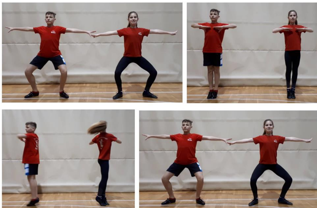
Slika 2. Etape 'spina' (početna pozicija, pripremna pozicija, okret, završna pozicija)

Zavisno o načinu držanja među partnerima, izvode se figure s 'kickovima'. One se izvode s različitih pozicija, ali najviše sa strane, tzv. 'shadow' pozicije. Podijeljeni su na 'kickove' s ravnim nogama u oba smjera ili u križ, te 'kickove' s podizanjem nogu (koljena) ili 'kickovi' koji se izvode s jedne strane na drugu stranu, npr. s lijeva na desno) te dupli 'kickovi' u ritmu glazbe.