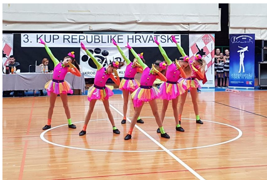
Slika 6. Mala formacija 2 – Rock Cirkus

Kategorije početnika i naprednih plesača, pod okriljem Hrvatskog Rock' n' Roll Saveza i Zagrebačkog Rock' n' Roll Saveza, natječu se na zasebnim natjecanjima.