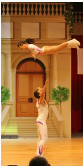
sigurnosni nivo 0