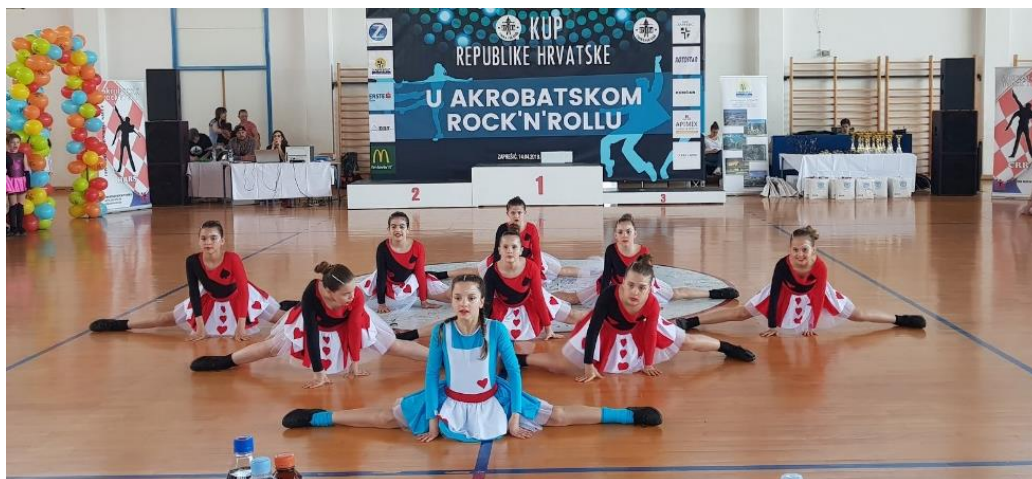
Slika 5. Velika formacija 2 – Alise

Za svaku od MF nabrojanih kategorija vrijede iste dobne granice kao i za VF, a jedina razlika je u dopuštenom broju plesača. Male formacije sastoje se od četiri plesača do najviše devet plesača.