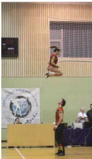
sigurnosni nivo 1