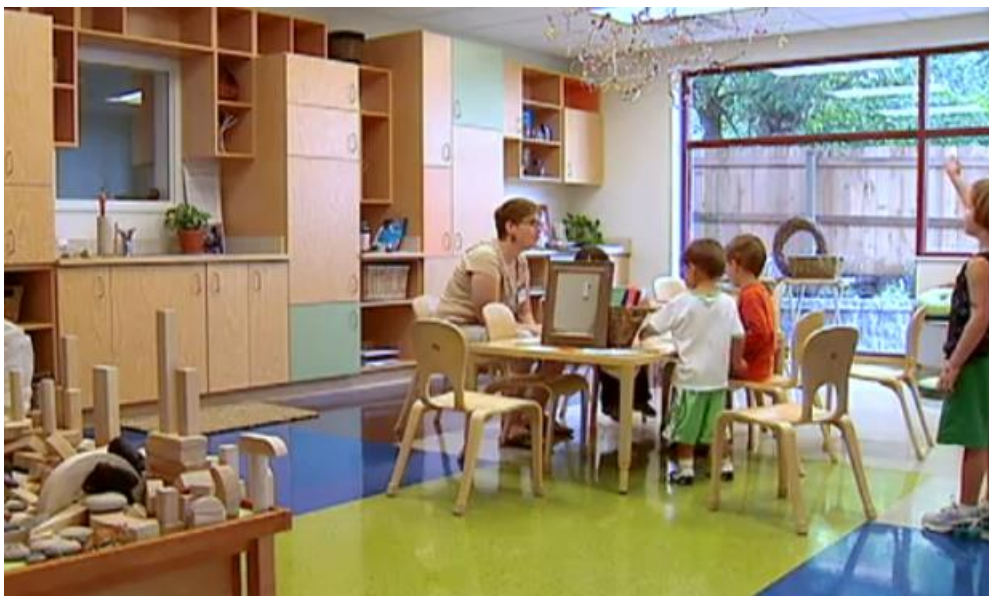
Slika 4. Istraživanje djetinjstva