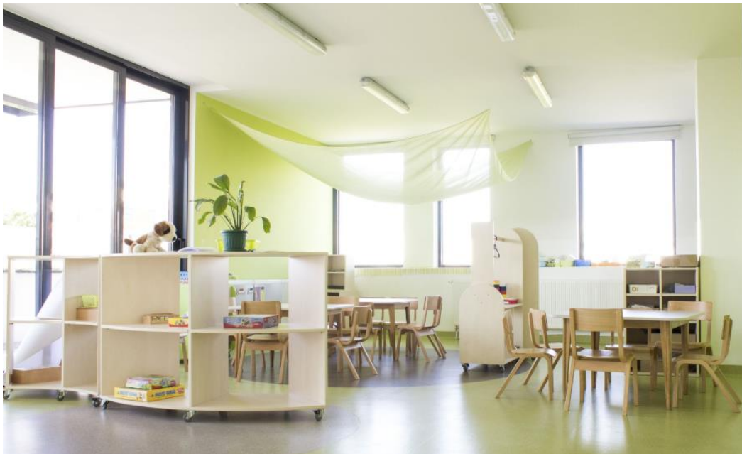
Slika 5. Soba dnevnog boravka ustanove za rani predškolski odgoj