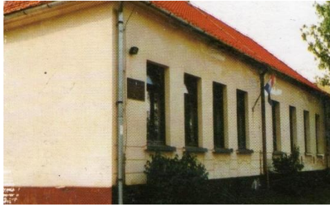
Slika 5 Područna škola Prigorec nekad

(Osobni arhiv, naslovnica razredne fotografije 2004./2005.)