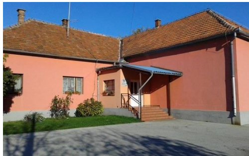
Slika 6 Područna škola Prigorec danas