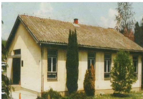
Slika 3 Područna škola Kuljevčica nekad

Škola unatoč malom prostoru ima dovoljno materijala za rad, no nedostatak je knjižnica koja se ne nalazi u školskoj užoj blizini. Područna škola Kuljevčica ima pripadajuće školsko dvorište i nedaleko od škole nalazi se dječje igralište na kojemu se može održavati nastava tjelesne i zdravstvene kulture, no škola u svom sastavu nema pripadajuću dvoranu pa se sve bitnije aktivnosti i manifestacije obilježavaju na školskom holu ili u razredima. Trenutno su u školi zaposlene četiri učiteljice, a školu pohađa 37 učenika (OŠ Ivan Kukuljević Sakcinski Ivanec 2019).