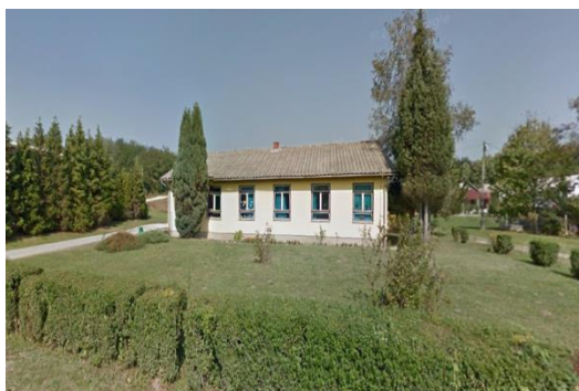
Slika 4 Područna škola Kuljevčica danas

( https://www.google.com/maps/@46.2029968,16.1287686,14z 29.3.2020)