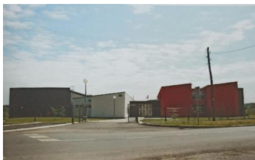
Slika 2 Nova Područna škola Tin Ujević, Salinovec