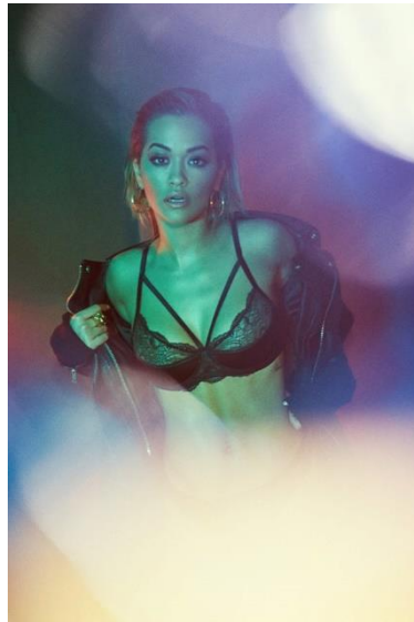
Slika 2: Rita Ora u aktualnoj reklami „Tezenis“ dućana za donje rublje

hiperseksualizacije djece. Žensko tijelo predstavlja se kao objekt požude, a ženu se ne gleda kao cjelinu, već kao skup dijelova. Primjer toga vidljiv je na slici 2.