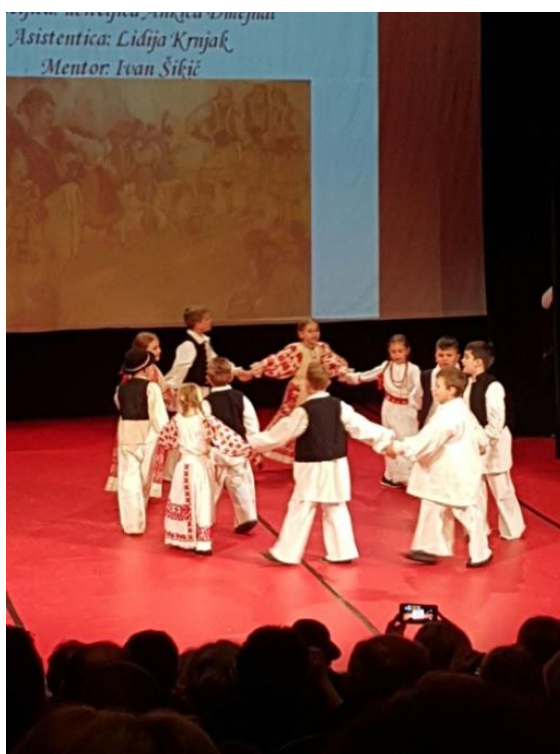
Slika 10. Djeca plešu kolo

„U kolu su svi jednaki i ravnopravni, i bogatiji i siromašniji, i poslodavac i radnik, i građanin i seljak, i muško i žensko, i mlado i staro. To je ples koji spaja najraznovrsnije elemente, ples zajednice koja ljude izjednačuje, vezuje, miri i usklađuje“ (Ivančan, 1971, str. 5).