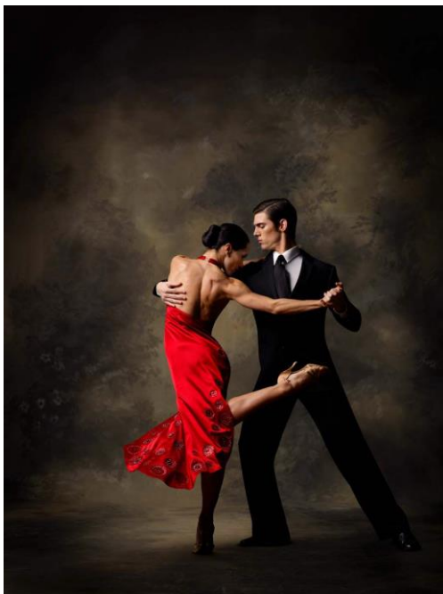
Slika 6. Standardni ples – tango

društvenim prigradama, stoga možemo reći kako su društveni plesovi vrlo pogodna aktivnost za učenike mlađe školske dobi (Šumanović i sur., 2005).