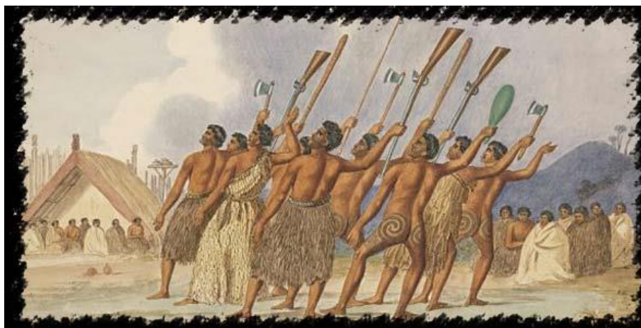
Slika 1. Ratnički ples