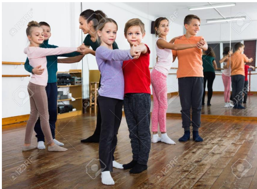
Slika 11. Djeca plešu društveni ples

prilagodi sadržaju pojedinih dijelova sata nastavnog procesa. Na primjer, tako se već naučeni plesovi mogu koristiti u prvom dijelu sata za zagrijavanje, ako se izvode u brzem tempu (polka, bečki valcer, foxtrot, jive i sl.) ili lagani plesovi za smirenje u završnom dijelu sata (engleski valcer, lagani foxtrot, rumba i sl.) (Jocić, 1999). (Slika 11)