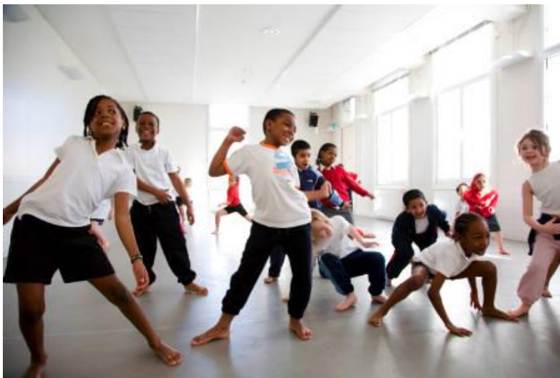
Slika 12. Jazz ples u školi

Jazz ples moguće je provoditi u različitim organizacijskim oblicima rada u nastavi tjelesne i zdravstvene kulture. (Slika 12) Kao programski sadržaj može se provoditi u svim dijelovima sata nastave tjelesne i zdravstvene kulture, dakle od uvodnog dijela do završnog dijela sata. Jazz plesne strukture u frontalnom obliku provedive su, u uvodnom dijelu sata, kroz jednostavne plesne elemente kretanja uz glazbu. U pripremnom dijelu sata provode se kao pripremne vježbe uz glazbu s pomagalima i bez njih, dok u glavnom dijelu sata obrađujući i usavršavajući elemente tehnike jazz plesa kao i elemente realizacije različitih glazbenih (plesnih) ritmova. Tijekom završnog dijela sata moguće je primijeniti jednostavne i opuštajuće korake i kratke koreografije uz relaksirajuću glazbu. Pri obradi plesnih sadržaja uvijek treba započeti jednostavnim pokretima koji se po strukturi ne razlikuju od prirodnih oblika kretanja (hodanja, poskoka, okreta) poštujući princip postupnosti (Vlašić i sur., 2015).