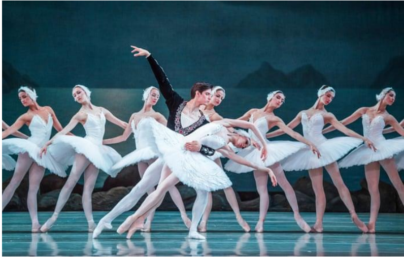
Slika 9. Umjetnički ples – balet