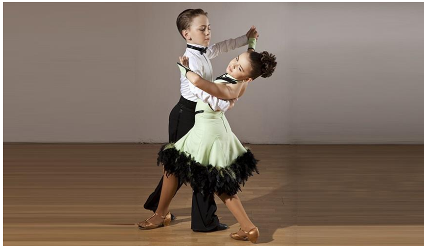
Slika 13. Standardni ples kao izvanškolska aktivnost

Djeca koja vole plesati, svoju potrebu za plesnim izričajem ostvaruju u izvannastavnim i izvanškolskim aktivnostima poput folklornog plesa, ritmičke/plesne grupe ili u plesnim klubovima. Folklorna društva u okviru svog djelovanja organiziraju plesne sekcije koje su namijenjene i mlađim polaznicima te se tako kod djece budi interes za folklornu tradiciju. Osim folklornog plesa, kao izvannastavna aktivnost u nižim razredima osnovnih škola, često se organizira ritmička/plesna grupa u kojoj učenici plešu uglavnom uz pjesme popularnog karaktera. Plesne korake djeca usvajaju i u okviru plesnih klubova, što podrazumijeva izvanškolske aktivnosti, no oni najčešće djeluju isključivo u gradskim sredinama. Ovisno o vrsti plesnog kluba usvajaju se plesni koraci standardnih (Slika 13) i latinoameričkih plesova, jazz dancea, akrobatskog rock'n'rolla (Slika 14) i mnogih drugih plesova. (Šulentić Begić i sur., 2016).