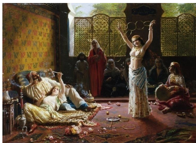
Slika 2. Zabavni ples

Specifičnost ovog doba su masovni ekstatički (strastveni) plesovi koji se u Grčkoj nazivaju „bahanalije“, a u Rimu „juvenilije“ i „floralije“. Njihova je osnovna karakteristika ispoljavanje primarnih nagona i podsvjesnih želja koje se u svakodnevnom životu prikrivaju moralnim načelima i uobičajenim ponašanjem (Bijelić, 2006).