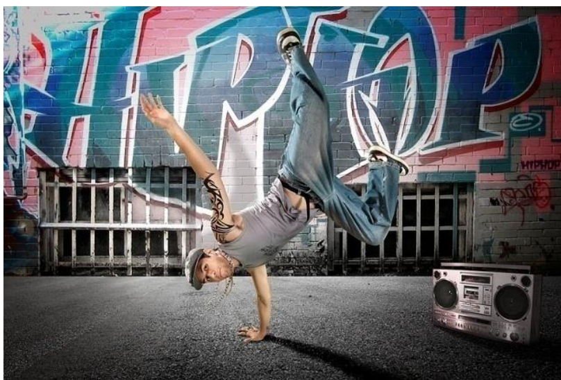
Slika 4. Hip-hop

Kasnije su se pojavili plesovi quickstep, slowfox, charleston, blues, shimmy i jazz. Strast, gibanje i lelujanje tijela donijeli su plesovi iz Latinske Amerike (mambo, bolero, rumba, quaracha i calypso), a u Ameriku su stigli plesovi ragtime, dixieland, blues, swing te boogie-woogie. Sve dalje, razvijali su se potpuno drugačiji plesovi: atraktivni plesovi rock 'n' roll, cha-cha-cha i lambada. Tek 80-ih javljaju se ulični plesovi poput breakdancea, electric boogieja, salse i hip-hopa koji sa sobom nose i nove elemente kao što su gimnastičko-akrobatski elementi, okretanje na glavi i vratu, imitiranje robota i sl. (Bijelić, 2006). (Slika 4.)