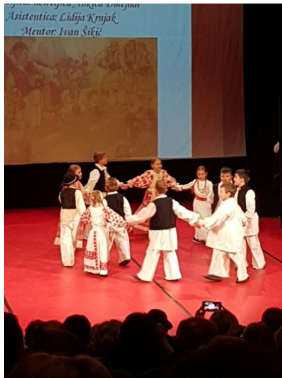
Slika 10. Djeca plešu kolo

„U kolu su svi jednaki i ravnopravni, i bogatiji i siromašniji, i poslodavac i radnik, i građanin i seljak, i muško i žensko, i mlado i staro. To je ples koji spaja najraznovrsnije elemente, ples zajednice koja ljude izjednačuje, vezuje, miri i usklađuje“ (Ivančan, 1971, str. 5).