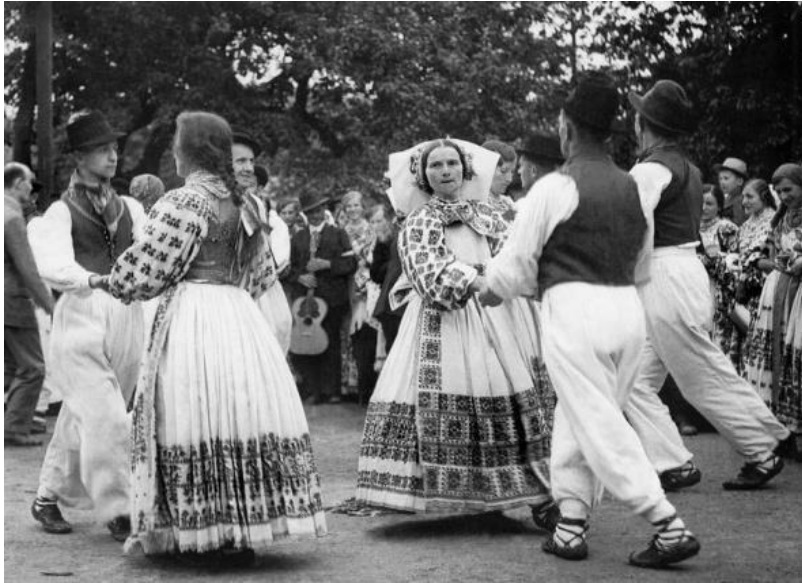
Slika 5. Narodni ples