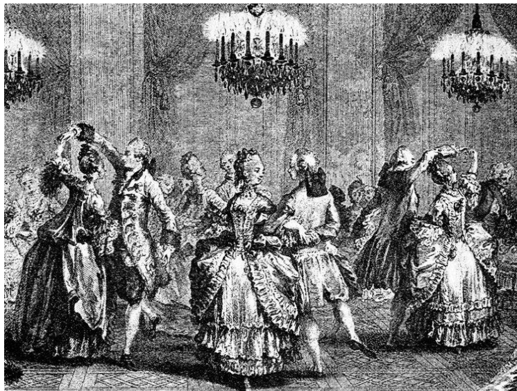
Slika 3. Plemićki ples