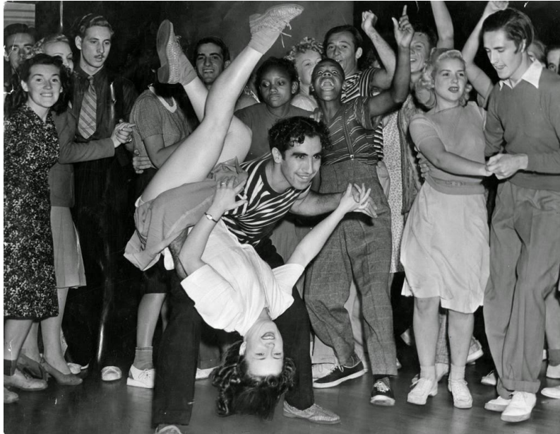
Slika 8. Sjevernoamerički (moderni) ples – rock 'n' roll