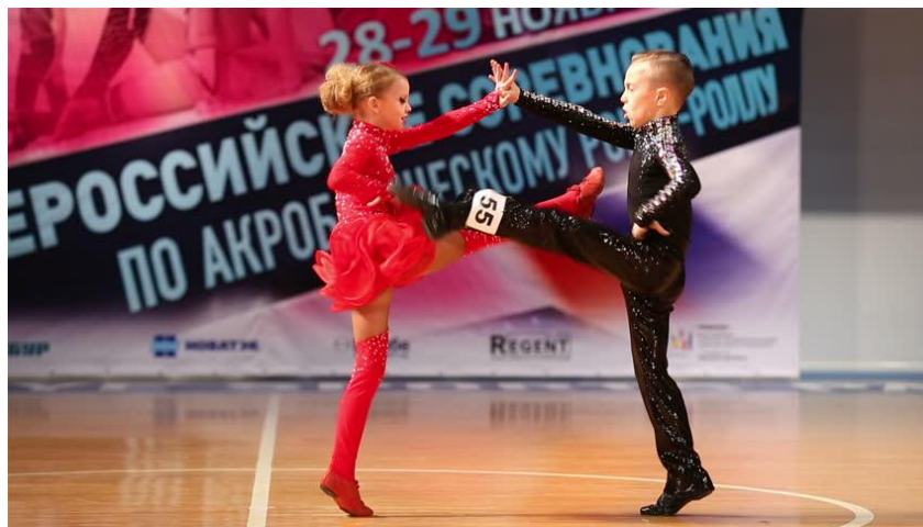
Slika 14. Akrobatski rock 'n' roll kao izvanškolska aktivnost