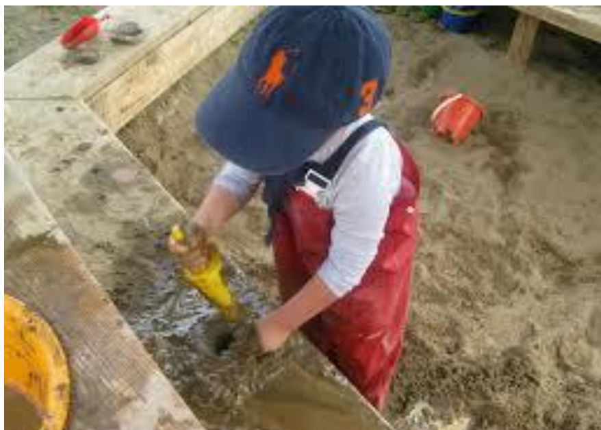
Slika 5. Slobodna igra djeteta 8

Slobodna igra utječe na razvoj pojedinih kompetencija djeteta, a to su: jezični razvoj pomoću spontanog govora i izražavanja tijekom igre, ujedno iz konkretnih primjera iz okoline. Zatim razvoj socijalnih vještina putem stupanja u kontakt s drugom djecom ili odraslima iz okoline, razvitak vještina dijeljenja s drugima, suradnja, percepcija, poštivanje. Slobodna igra utječe i na emocionalni razvoj djeteta na način da dijete tijekom igre želi oponašati izraze lica ili mu neke od emocija dođu spontano. Na taj način dijete jača sposobnost kontroliranja vlastitih emocija. Slobodna igra utječe i na kognitivni razvoj djeteta igrajući se igračkama načinjenih od prirodnih materijala ili nedefiniranim materijalima za koje koristi svoju maštu. Prije upoznavanja sa simbolima u pisanom obliku, dijete koristi oblike slobodne simbolike koje primjećuje na različitim objektima s kojima se igra. 7