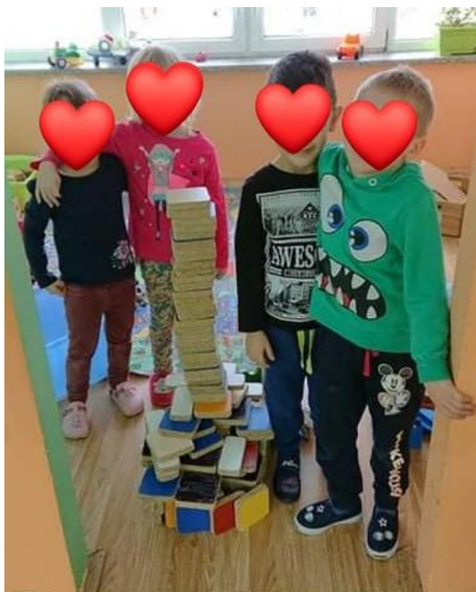
Slika 1. Završetak zajedničke izgradnje građevine vršnjačke djece