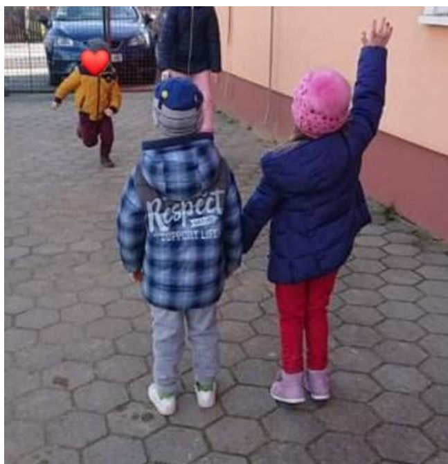
Slika 2. Vršnjačko prijateljstvo

Neka djeca su povučeniija od drugih i kada žele ostvariti prijateljstvo ne mogu jer su spriječena strahom od socijalne interakcije što izaziva izbjegavanje drugih. Kod ovakve djece dominiraju slabije socijalne veze, povučenost, usamljenost i nedostatak socijalnih odnosa s drugima. U tom slučaju odrasli imaju zadaću pomoći djetetu da