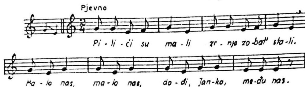
SLIKA 2. IGRA „PILIĆI“ (PREUZETO IZ MANASTERIOTTI, 1988: 80)

Kad završi s pjevanjem, odabere neko dijete iz kolone, koje stane uz njega, te zajedno sipaju hranu i pjevaju pjesmu. Tako se igra nastavlja dok u koloni ne ostane ni jedno dijete.