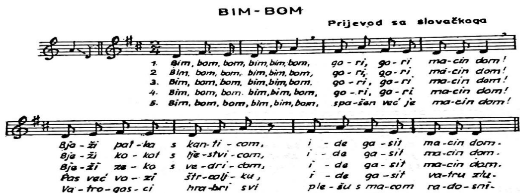
SLIKA 3. „BIM-BOM“ (PREUZETO IZ MANASTERIOTTI, 1988: 104)

Bježi patka s kanticom, ide gasit macin dom!