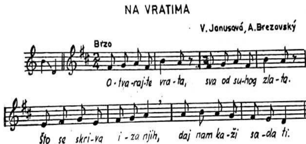
SLIKA 4. IGRA „NA VRATIMA“ (PREUZETO IZ MANASTERIOTTI, 1988: 107)

Otvorajte vrata, sva od suhog zlata. Što se skriva iza njih, daj nam kaži sada ti.