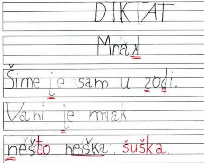
Slika 2: Zrcalno okretanje slova u diktatu

utječe na nemogućnost učenja ispravnog oblika riječi. Otežano čitanje i zastoji u čitanju nastaju ako se djetetu slova okrenu ili umjesto riječi vidi prazno polje.