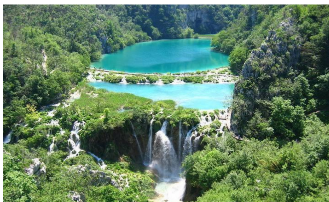
Slika 7. Nacionalni park Plitvička jezera (1979.)

Nepokretna kulturna baština je sa svojim kulturno – povijesnim značenjem sastavni dio čovjekove okoline. Zaštita i njezino očuvanje ne samo da je zaštićeno zakonskim odredbama, nego bi to trebalo biti dio čovjekove vlastite svijesti i odgovornosti kao individue.