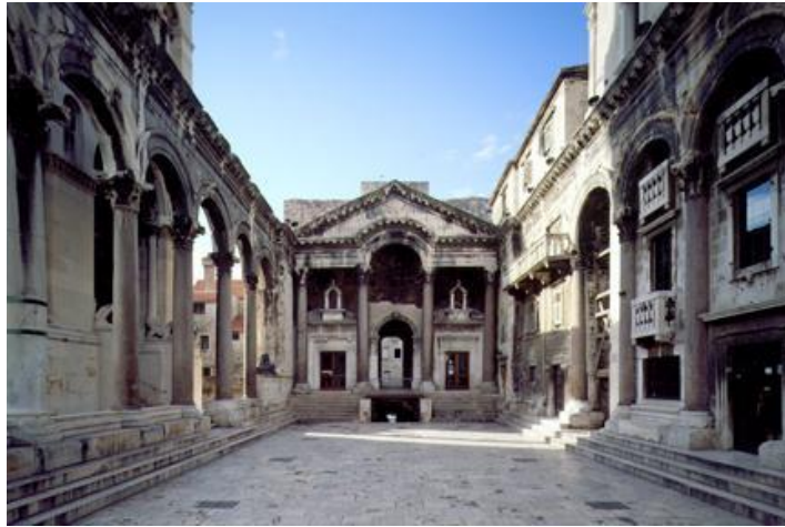
Slika 1. Povijesni kompleks Splita i Dioklecijanova palača (1979.)

Upisana dobra Republike Hrvatske na UNESCO – ovom Popisu svjetske baštine su: