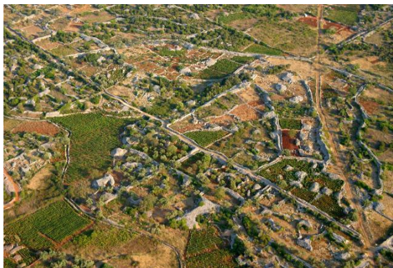
Slika 6. Starogradsko polje (2008.)