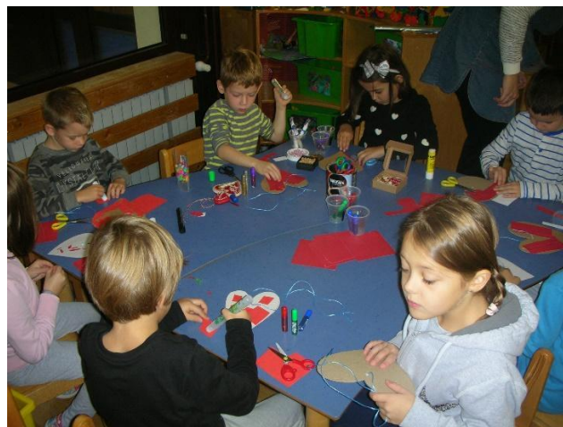
Slika 23. Stvaralački rad: ukrašavanje vlastitih licitara

Glavna aktivnost bila je da djeca od kolaž papira i mnoštva drugih ukrasnih predmeta koje sam donijela, naprave vlastito licitarsko srce. Djeci se izrada vlastitih licitara jako svidjela i važno je napomenuti kako se u aktivnost uključio dječak koji je inače vrlo nemotiviran za rad. Djeca su prvo proizvoljno (rukama ili škarama) trgala ili izrezivala crveni kolaž koji je bio baza na kartonski oblikovanom srcu. Ostalim materijalima (ljepilom, ljepilom u boji, korektorom, perlicama, kamenčićima i drugim ukrasima) stvarali su vlastiti licitar. Za vrijeme aktivnosti djeci sam ispričala običaj darivanja licitarskog srca mladića djevojci. Neki su tražili pomoć oko obrubljivanja srca bijelim korektorom, a umjesto stakalca zalijepili su komadić aluminijske folije koji im je bio ponuđen.