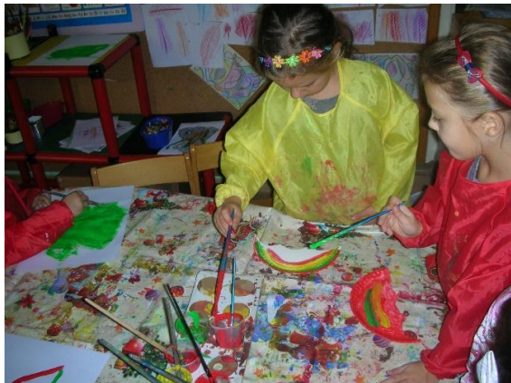
Slika 11. Slikanje kišobrana temperom

finu motoriku. Nakon aktivnosti, razgovarali smo o tome što smo toga dana radili; refleksija.