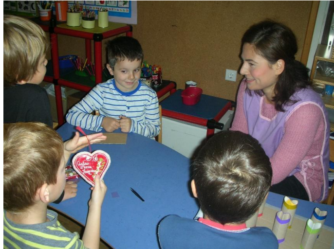
Slika 19. Upoznavanje sa licitarskim srcima

Nakon toga sam po centrima raspodijelila sve poticaje koje sam izradila zasebno za projekt. Na raspolaganju su imali slagarice s motivom licitara; srce i konj, zatim u obliku srca napravljeni zamotuljci od wc papira i mnoštvo boja koje je pincetom trebalo rasporediti u odgovarajuće kućice. I zadnji poticaj; slaganje životinja i drugih likova iz oblika srca. Dječaci su sagradili konstrukciju od kocaka u obliku srca, a druga su djeca na papiru crtala licitare.