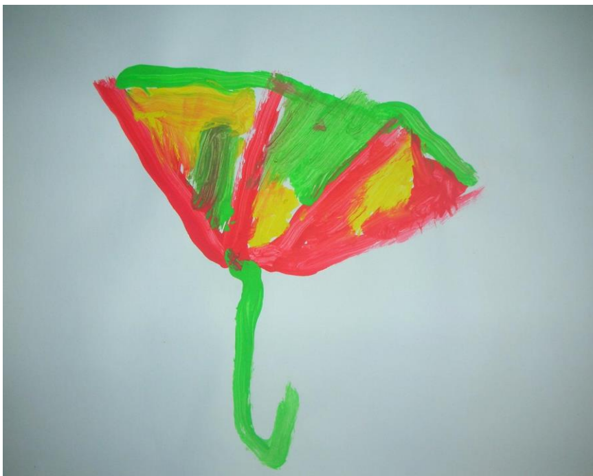
Slika 14. Nensi 6 godina