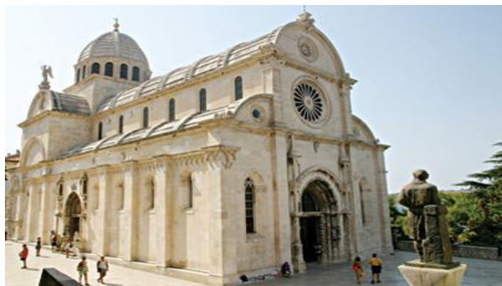
Slika 5. Katedrala svetog Jakova u Šibeniku (2000.)