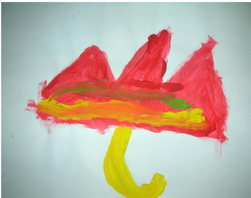
Slika 13. Mia, 6 godina