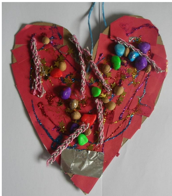
Slika 26. Marko, 6 godina