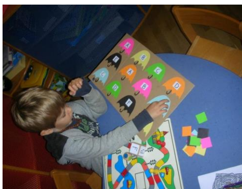
Slika 8. Igre poticajima

Za uvod u temu „Šestinski kišobran“ djeci sam po centrima rasporedila poticaje koje sam izradila. Za centar čitanja i pisanja; prepoznavanje slova putem bacanja kocke i pokrivanja slova koja su bila unutar kišobrana. U centru stolno manipulativnih igara ponuđena im je igra „Križić - kružić“ s motivima kišobrana i kapljica. U centru za matematiku djeca su na kartonskim pločama ispod šestinskog kišobrana dodavala kapljice kiše onoliko koliko je pisalo na kišobranu.