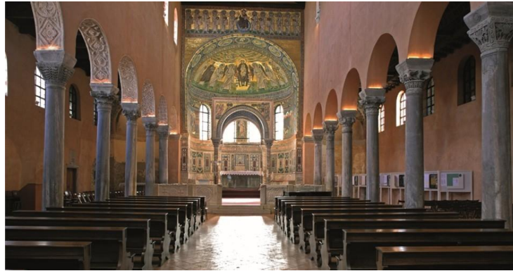
Slika3. Eufrazijeva bazilika u Poreču (1997.)