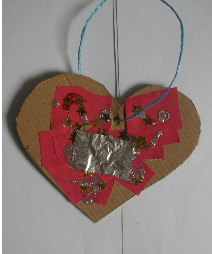
Slika 27. Mislav, 6 godina

Kolaž mlađa djeca obično rade da trgaju papir i lijepe na podlogu, dok ga starija djeca trgaju i režu škarama. Od materijala za kolaž obično upotrebljavaju raznobojne papire (kolažne mape), novinski papir, ručno obojan papir i tkanine. U starijoj predškolskoj dobi djeca najprije izrezuju ili trgaju željene oblike, zatim ih na plohi slažu kombinirajući ih i tražeći odgovarajuće kompozicije i oblike, a tek kada su zadovoljni složenim lijepe ih na papir. Kombiniranje tehnika