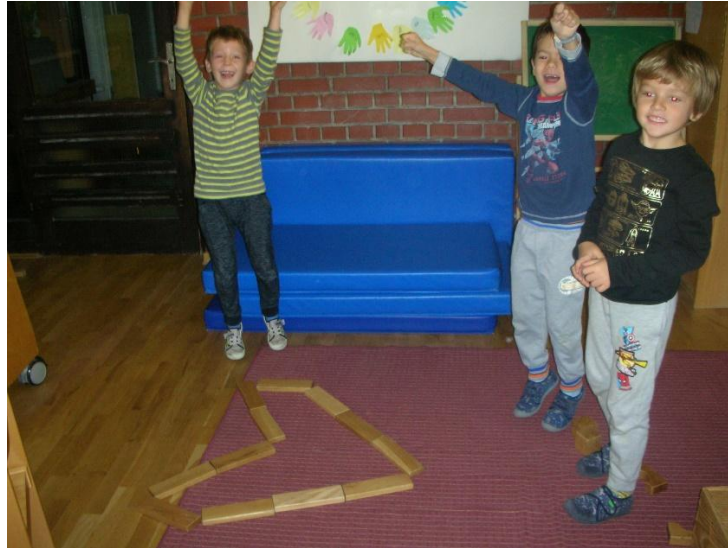
Slika 22. Novonastale aktivnosti iz poticaja

Glavna aktivnost bila je da djeca od kolaž papira i mnoštva drugih ukrasnih predmeta koje sam donijela, naprave vlastito licitarsko srce. Djeci se izrada vlastitih licitara jako svidjela i važno je napomenuti kako se u aktivnost uključio dječak koji je inače vrlo nemotiviran za rad. Djeca su prvo proizvoljno (rukama ili škarama) trgala ili izrezivala crveni kolaž koji je bio baza na kartonski oblikovanom srcu. Ostalim materijalima (ljepilom, ljepilom u boji, korektorom, perlicama, kamenčićima i drugim ukrasima) stvarali su vlastiti licitar. Za vrijeme aktivnosti djeci sam ispričala običaj darivanja licitarskog srca mladića djevojci. Neki su tražili pomoć oko obrubljivanja srca bijelim korektorom, a umjesto stakalca zalijepili su komadić aluminijske folije koji im je bio ponuđen.