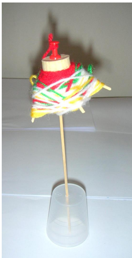
Slika 18. Mislav, 6 godina