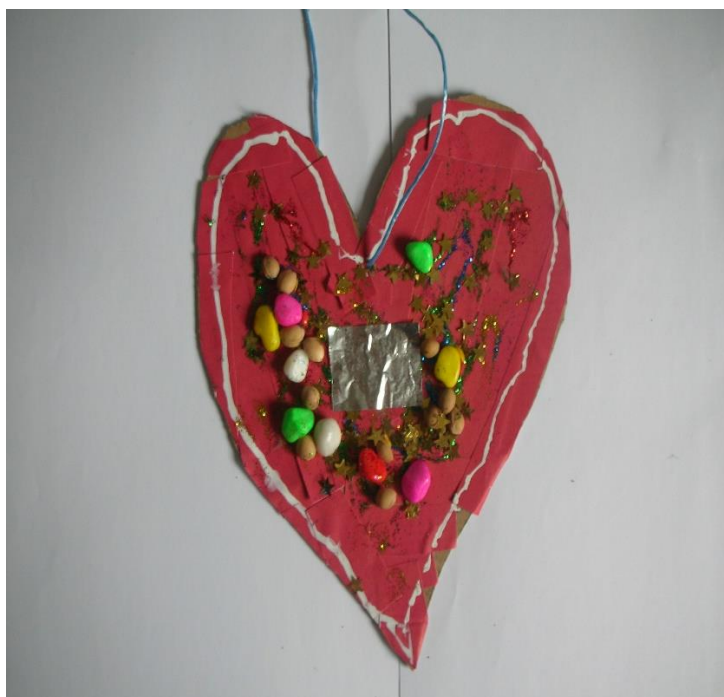
Slika 25. Nensi, 6 godina