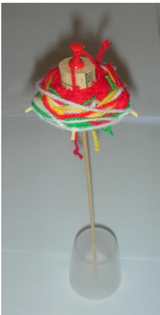
Slika 17. Mihael, 6 godina

Često u ovoj dobi djeca jednostavno istražuju boju tako da prekrivaju cijeli papir različitim bojama, bez da išta prikazuju. Zadnji rad predstavlja upravo tu igru boja, u ovom slučaju su korištene boje šestinskog kišobrana.