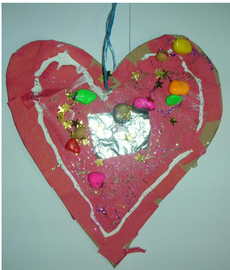
Slika 24. Anja, 6 godina