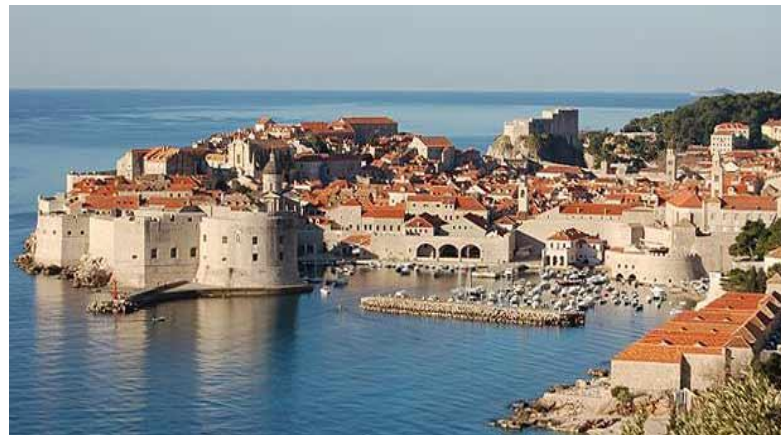
Slika 2. Stari grad Dubrovnik (1979.)