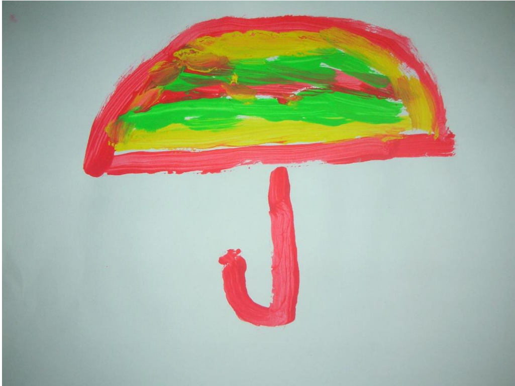
Slika 15. Tomislav 6 godina