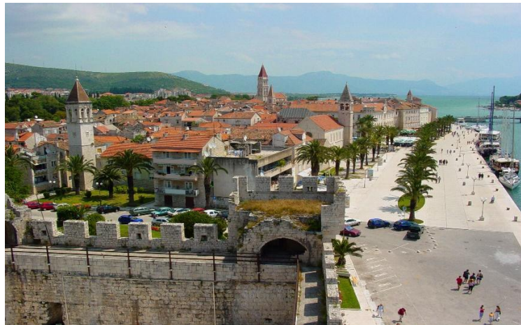
Slika 4. Povijesni grad Trogir (1997.)