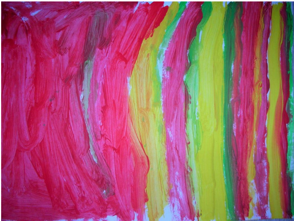
Slika 16. Marko 6 godina