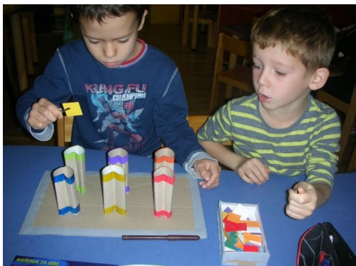
Slika 20. igranje poticajima

Nakon toga sam po centrima raspodijelila sve poticaje koje sam izradila zasebno za projekt. Na raspolaganju su imali slagarice s motivom licitara; srce i konj, zatim u obliku srca napravljeni zamotuljci od wc papira i mnoštvo boja koje je pincetom trebalo rasporediti u odgovarajuće kućice. I zadnji poticaj; slaganje životinja i drugih likova iz oblika srca. Dječaci su sagradili konstrukciju od kocaka u obliku srca, a druga su djeca na papiru crtala licitare.