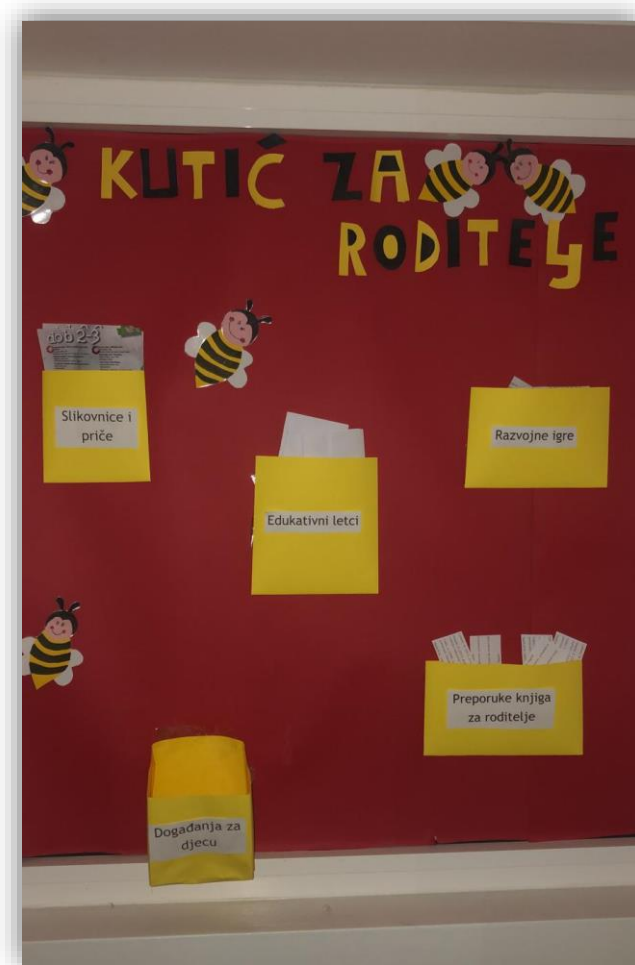
Slika 6 Kutić za roditelje

potencijalno žele ukazati roditeljima na određene aktualnosti unutar odgojne skupine. Odličan način za prikupljanje pismenih privola (za izlete, predstave, fotografiranje djece) je upravo izlaganje takvih lista na pano kutića za roditelje, pod uvjetom da su roditelji prethodno pristali na takav oblik prikupljanja informacija, obzirom na zaštitu osobnih podataka. Time se postiže informiranje svih roditelja temeljem samo jedne obavijesti (primjerice tablice za prikupljanje pismenih privola za sudjelovanje djece u predstavi koja se odvija u vrtiću).