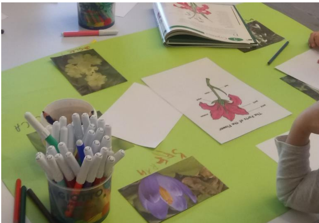
Slika 14. Istraživanje enciklopedija- predaktivnost likovnom prikazu proljetnog cvijeća

Ovoj aktivnosti prethodila su dječja zapažanja u njihovom okruženju. Naime, djeca su opazila pojavu prvih visibaba, šafrana i ostalog proljetnog cvijeća. Uz pomoć enciklopedija upoznali smo se s različitim vrstama cvijeća. Djeca su prepoznala baš ono cvijeće koje su već vidjela u prirodi. Osim promatranja vrsta cvijeća, pokušali smo uočiti i strukturu cvijeta.