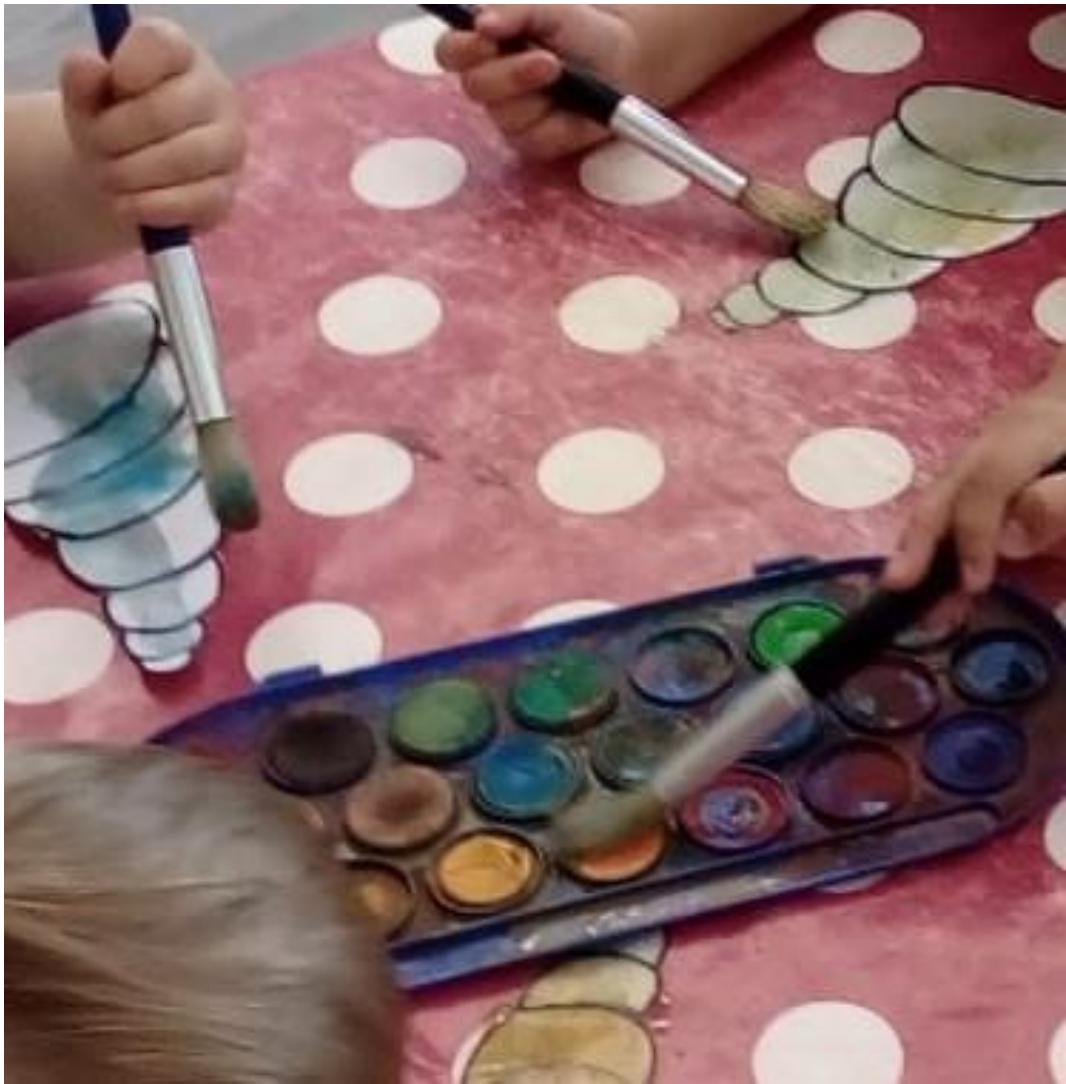
Slika 28. Bojanje predložaka- akvarel