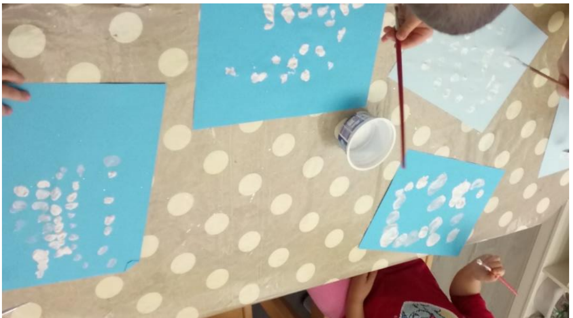
Slika 13. Slikanje snježnih pahuljica