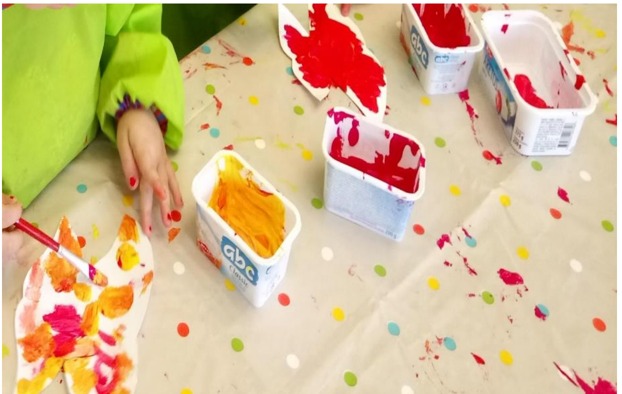
Slika 25. Bojanje lista- tempera

Djeci nudim posude s razliĉitim bojama, odnosno sugeriram im boje koje smo zamijetili na lišću. Svatko od njih bira boju koju Źeli. Ujedno miješaju Źutu i crvenu