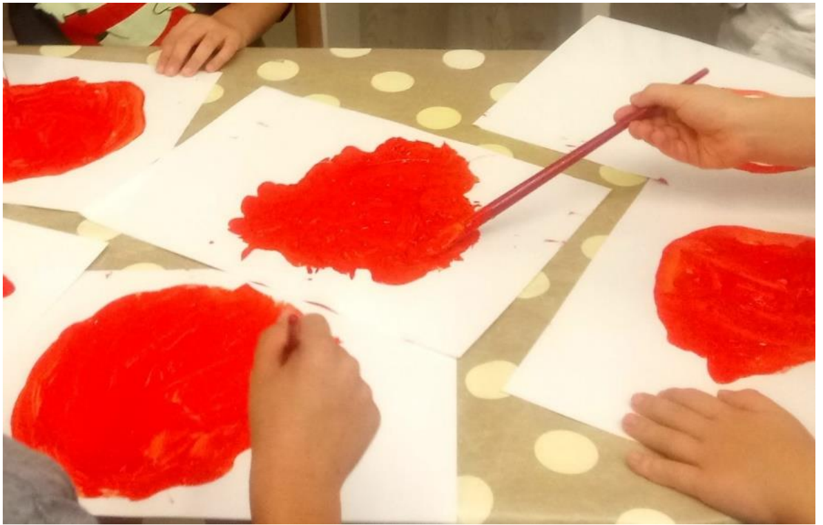
Slika 10. Slikanje bundeve temperom. Dob djece: 5-6g.