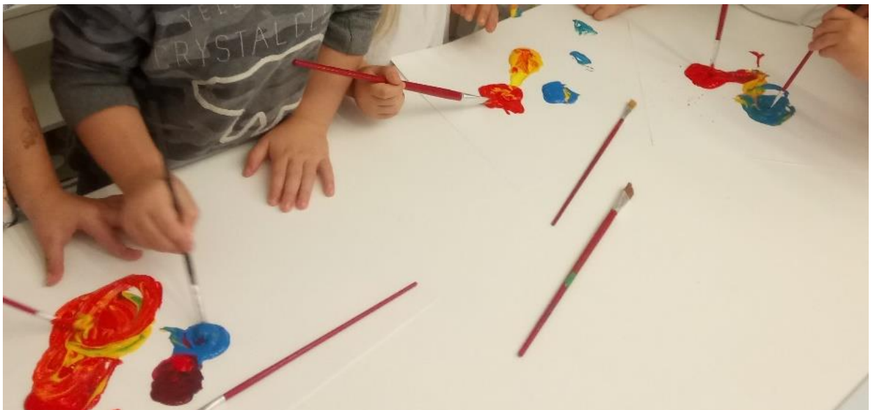
Slika 9. Nastanak sekundarnih boja

U slučaju likovnog prikaza bundeve djeci su ponuđene dvije primarne boje- crvena i žuta kako bi djeca sama dobila željenu nijansu kojom će prikazati bundevu. Djeci dobi 3-5 godina miješanje boje postala je centralna aktivnost. Nastavili su istraživati što se događa s bojama kad se pomiješaju te su različite nijanse prenosili na papir bez da su bojom kreirali određeni oblik. Ono što ih je isključivo zanimalo je trag koji boja ostavlja po papiru. Komentirali su međusobno svaku nijansu koja je bila različita od prethodne odnosno svaku koja se razlikovala od one njihovih prijatelja. Također je uočeno kako su mlađa djeca imala potrebu bojati si ruke dobivenom bojom. Zaključak