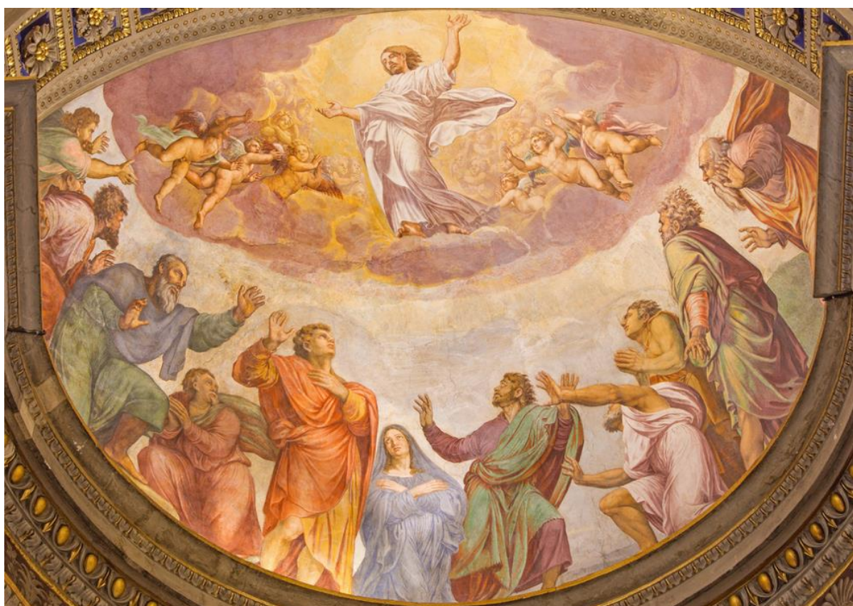
Slika 3. Francesco Salviati: Freska u crkvi Santa Maria dell'Anima u Rimu

Freska je tehnika čiji naziv dolazi od talijanske riječi fresco, što znači svježe. Freska je tehnika svježeg slikanja na zidu. Slikar sastavlja smjesu od mramornog pijeska i vapna te njome prekrije zid na kojem će slikati. Dok je smjesa mokra, nanosi boju koja je pomiješana s vapnenom vodom. Prije toga izradi nacrt, koji se zove karton. Namjena kartona je da pomogne slikaru da ne griješi (Peić, 1971).