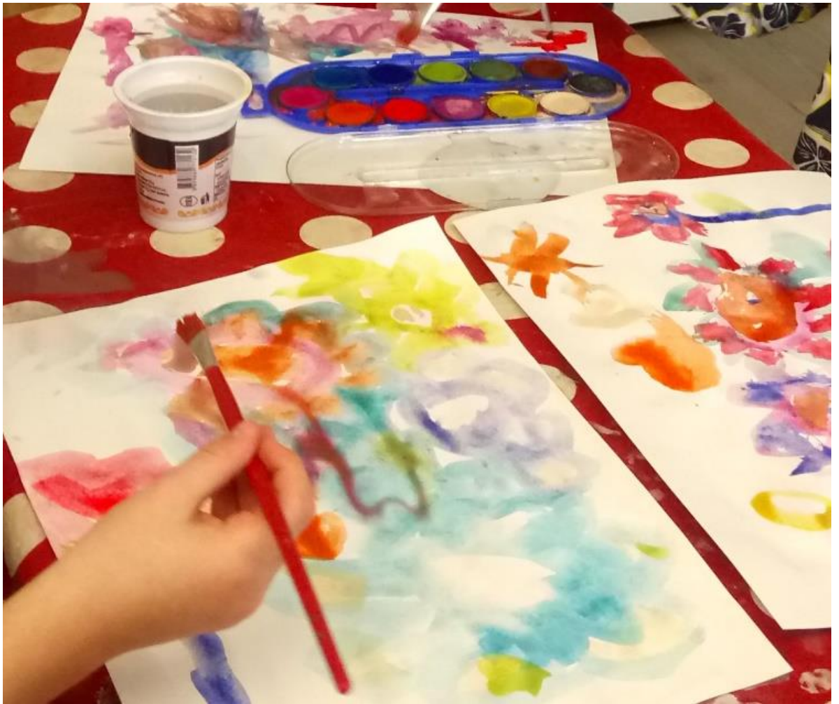
Slika 17. Prolječno cvijeće-tehnika akvarel