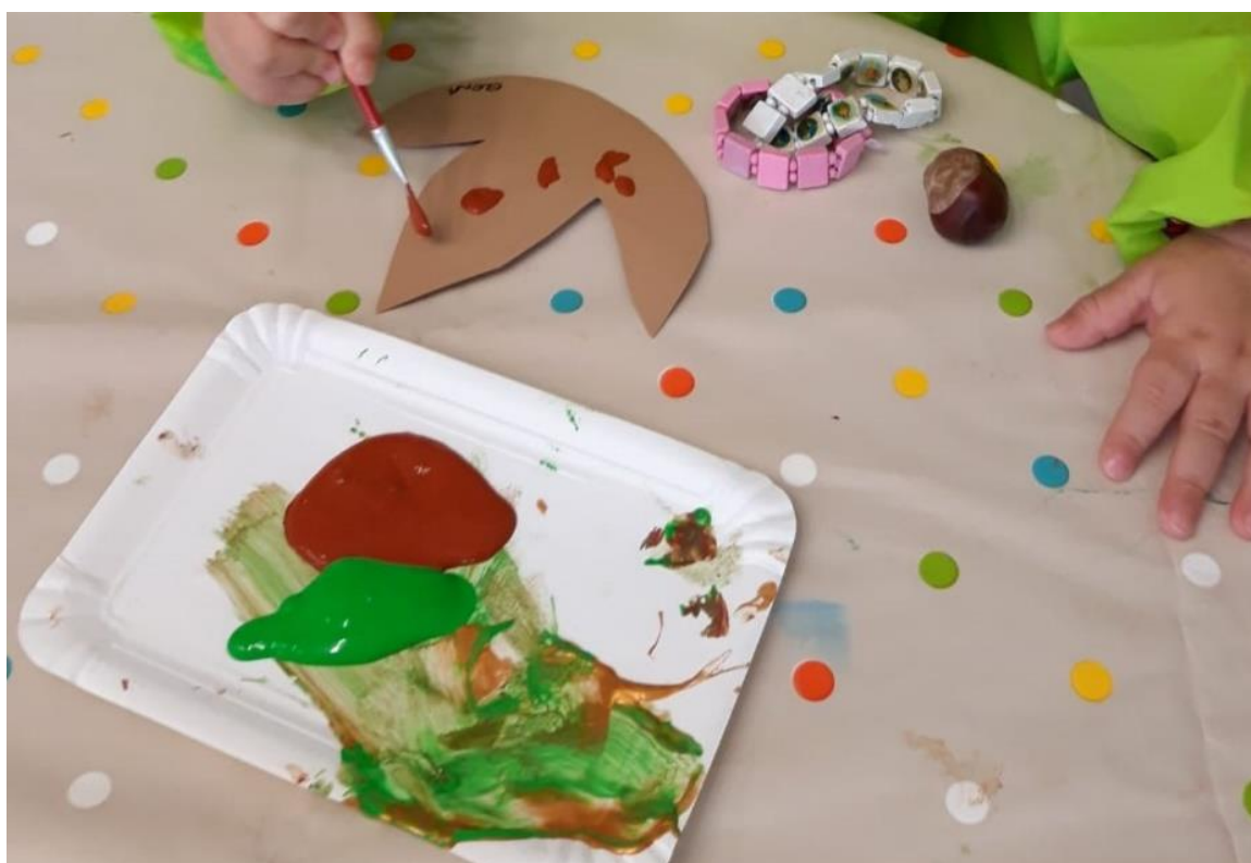
Slika 23. Bojanje lista- tempera

U jesenje doba djeca su istraživala lišće. Promatrala su ga povećalom, uočavala su strukturu, veličinu i boju. Budući da samostalno nisu uspjela nacrtati strukturu lista, donijela sam im predloške koji su bili izgledom jednaki listovima koje su imali u skupini.