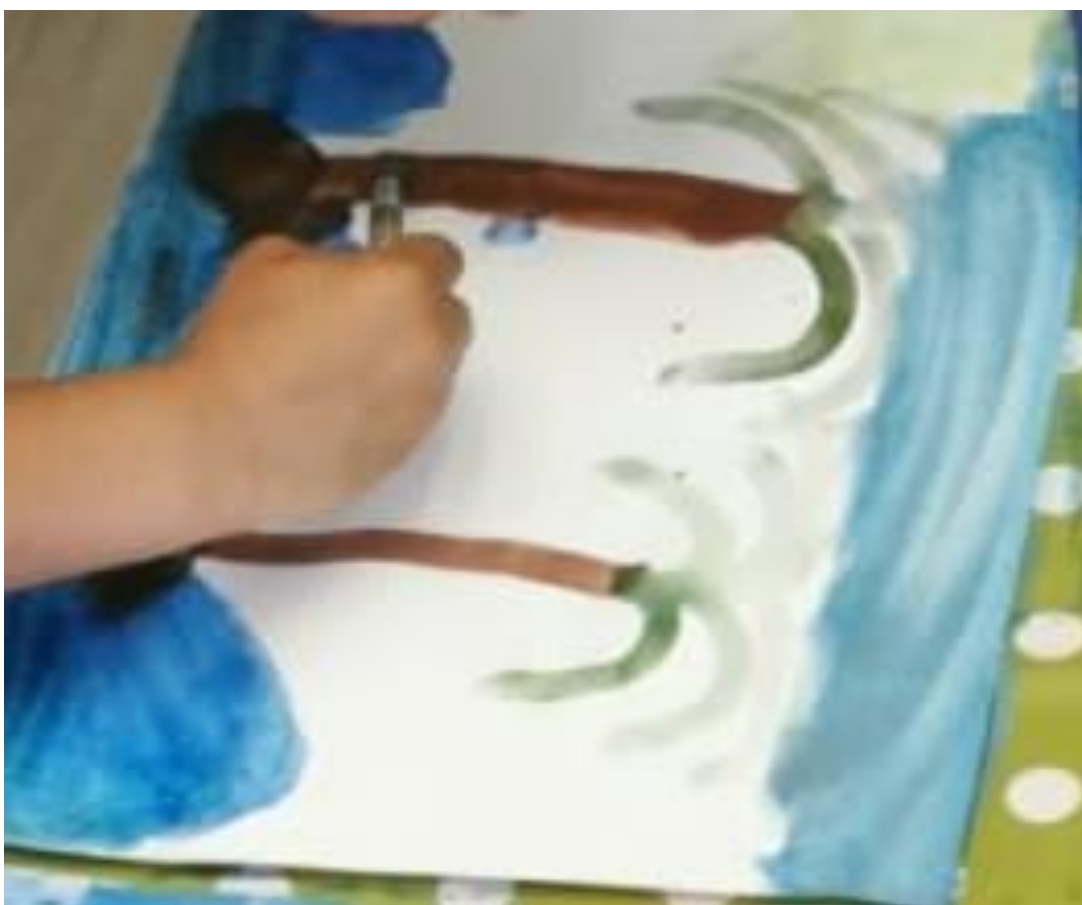
Slika 19. Djevojčica slika palmu

Ususret ljetu djeca dobi od 6 godina počela su spominjati odlaske na more. budući da u sobi skupine, u sklopu istraživačkog centra postoje različite verzije školjaka, djeca su ih odlučila istražiti. Djeca dobi 4 godine redom su donosila školjke i pokazivala kako se prislanjanjem školjke na uho može čuti zvuk mora. To nas je potaknulo na likovnu aktivnost slikanja morem. Najpogodnija tehnika za to je akvarel. Naime, namjera je bila likovnom tehnikom dobiti prozračnost i prozirnost mora. Prije likovne aktivnosti razgovarali smo o tome koje boje može biti more. Dogovor s djecom je bio da svatko prikaže more onom bojom za koju smatra da je boja mora. Sukladno tome, dobiveni su različiti likovni uratci, koji su bili individualni prikazi mora svakog od djece. Jedan od radova prikazivao je i palme (slika 19). Djevojčica od 6 godina uspješno je prikazala sve boje mora te pažljivo oslikavajući uvidjela na koji način boje akvarela uranjaju jedna u drugu te se stapaju u cjelinu (slika 20).