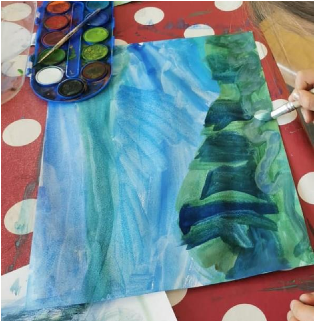
Slika 20. More- akvarel