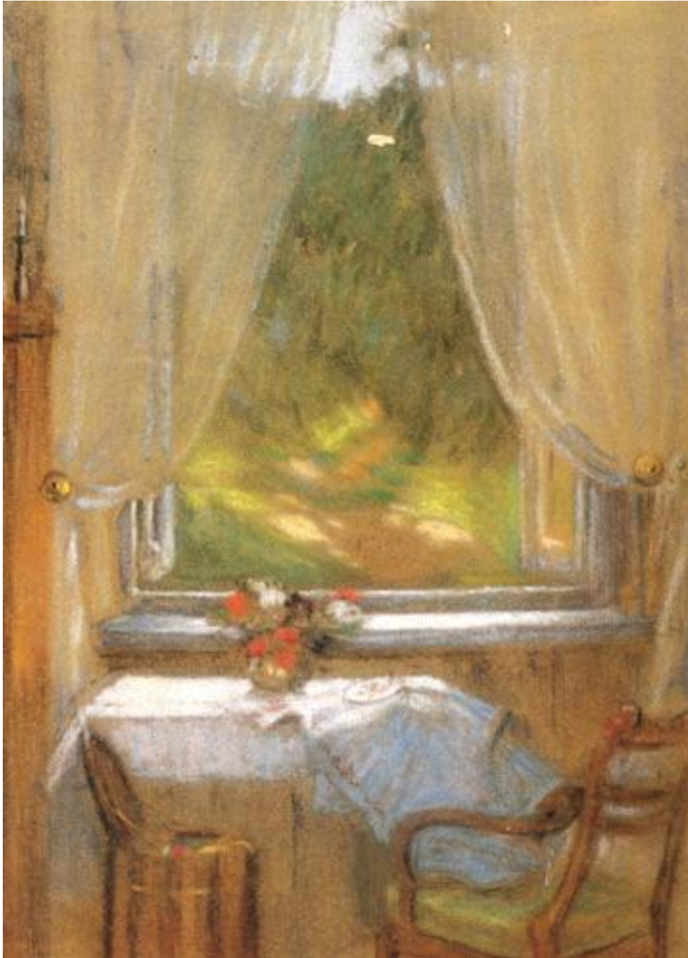
Slika 1. Slava Raškaj, akvarel