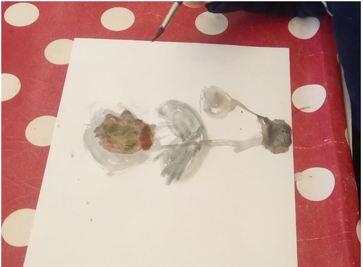
Slika 15. Struktura cvijeta-dječak 3 g.

trenutku niti upotreba određenih boja. Za vrijeme trajanja likovne aktivnosti u pozadini je puštena skladba „Proljeće“ (Antonio Vivaldi) kako bi djeca čula i osjetom sluha doživjela razigranost i vedrinu proljeća. Analizom aktivnosti doneseni su određeni zaključci. Dječak (3 g.) uspješno je prikazao strukturu cvijeta, no koristio je tamne boje. Budući da dječak ne sudjeluje rado u likovnim aktivnostima, upućena je pohvala strukturi cvijeta te boja nije komentirana.