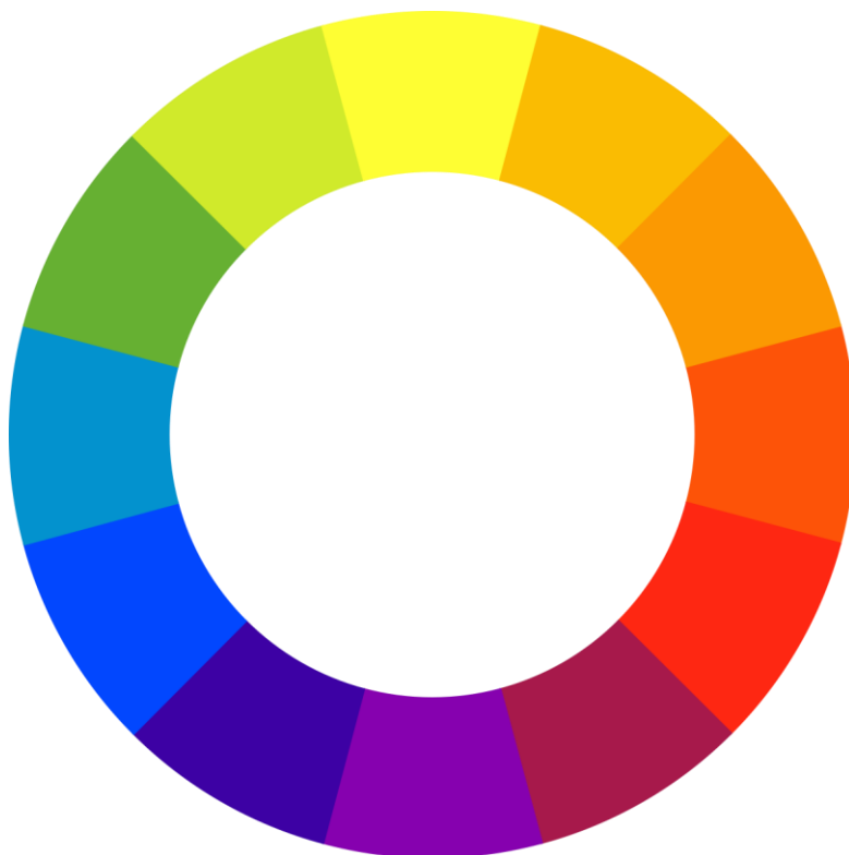
Slika 7. Ostwaldov krug boja