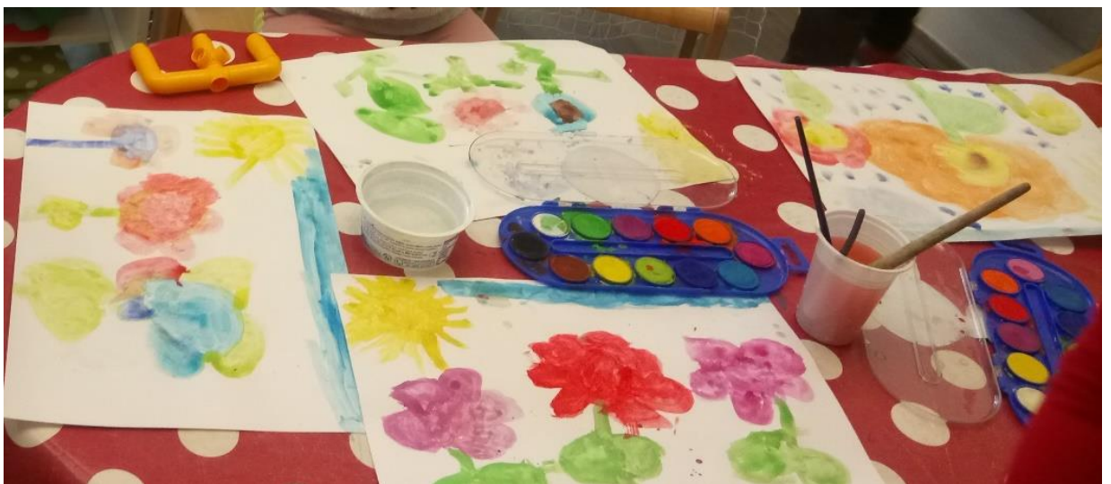
Slika 18. Prolječno cvijeće- tehnika akvarel