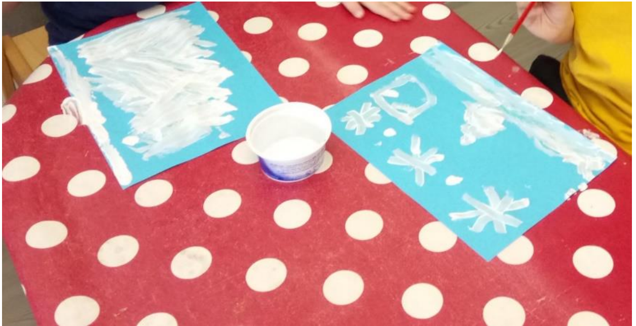
Slika 12. Slikanje snježnih pahuljica

su većinom slikala kuglice snijega te smo ih potaknuli na razmišljanje o tome kakve sve pahuljice mogu biti te smo im pokazali fotografije različitih struktura pahuljica. Starija djeca su tvrdila da ne postoje takvi pravilni kristali pahuljica koje smo im pokušali dočarati. Tada smo pronašli realne fotografije iz našeg vrtića na kojima je to vrlo dobro vidljivo. Slikajući, mlađa djeca su se divila kako bijela boja zaista može ostaviti trag na papiru te su na taj način proširila svoju spoznaju (slike 12 i 13).