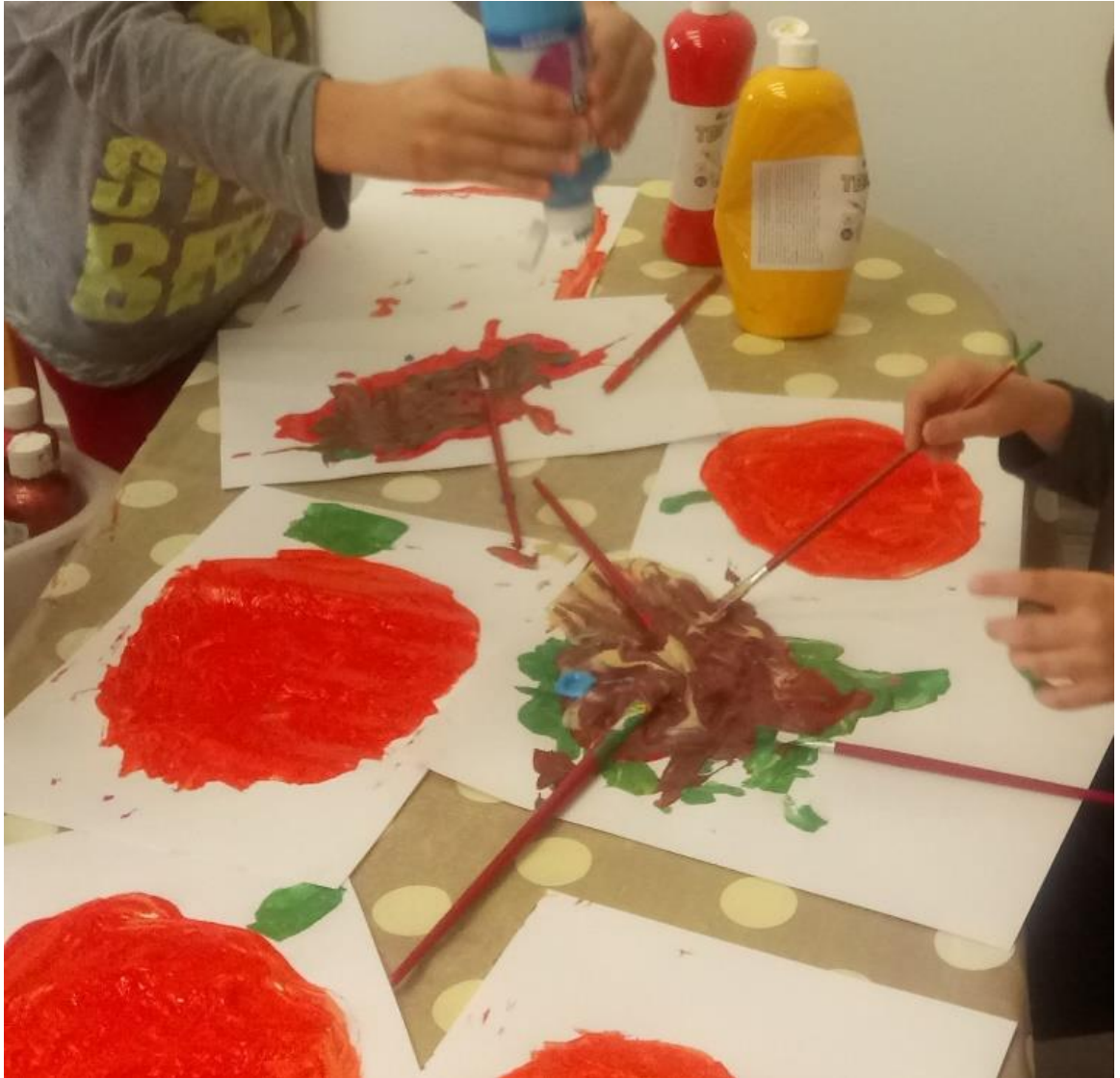
Slika 11. Proizvoljna aktivnost djece nakon slikanja bundeve-miješanje boja.