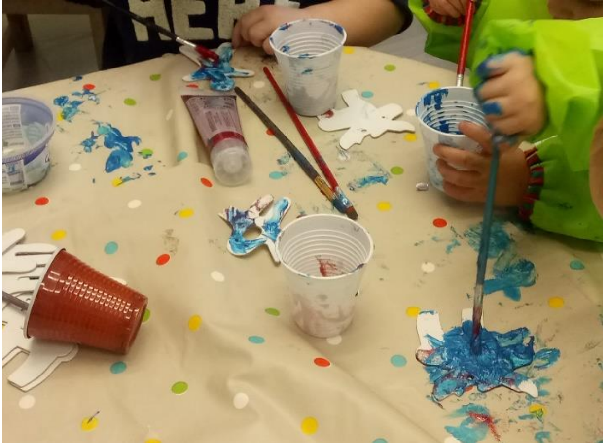
Slika 26. Bojanje ukrasa- akril