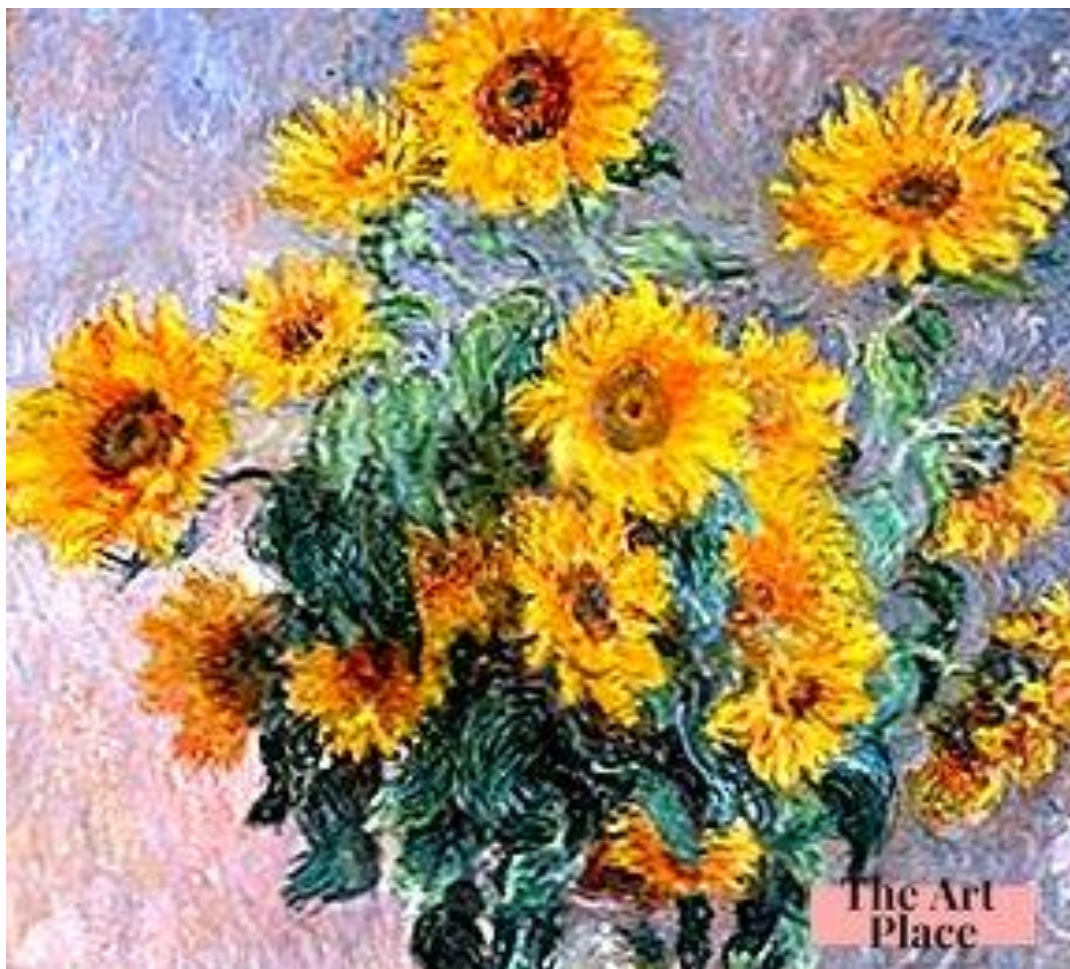
Slika 4. Claud Monet: Suncokreti (ulje na platnu)

svjetla. Primjena te tehnike traži kontrast. Kod uljene tehnike moguće je na svijetlu boju stavljati sve svjetliju. (Peić, 1971).