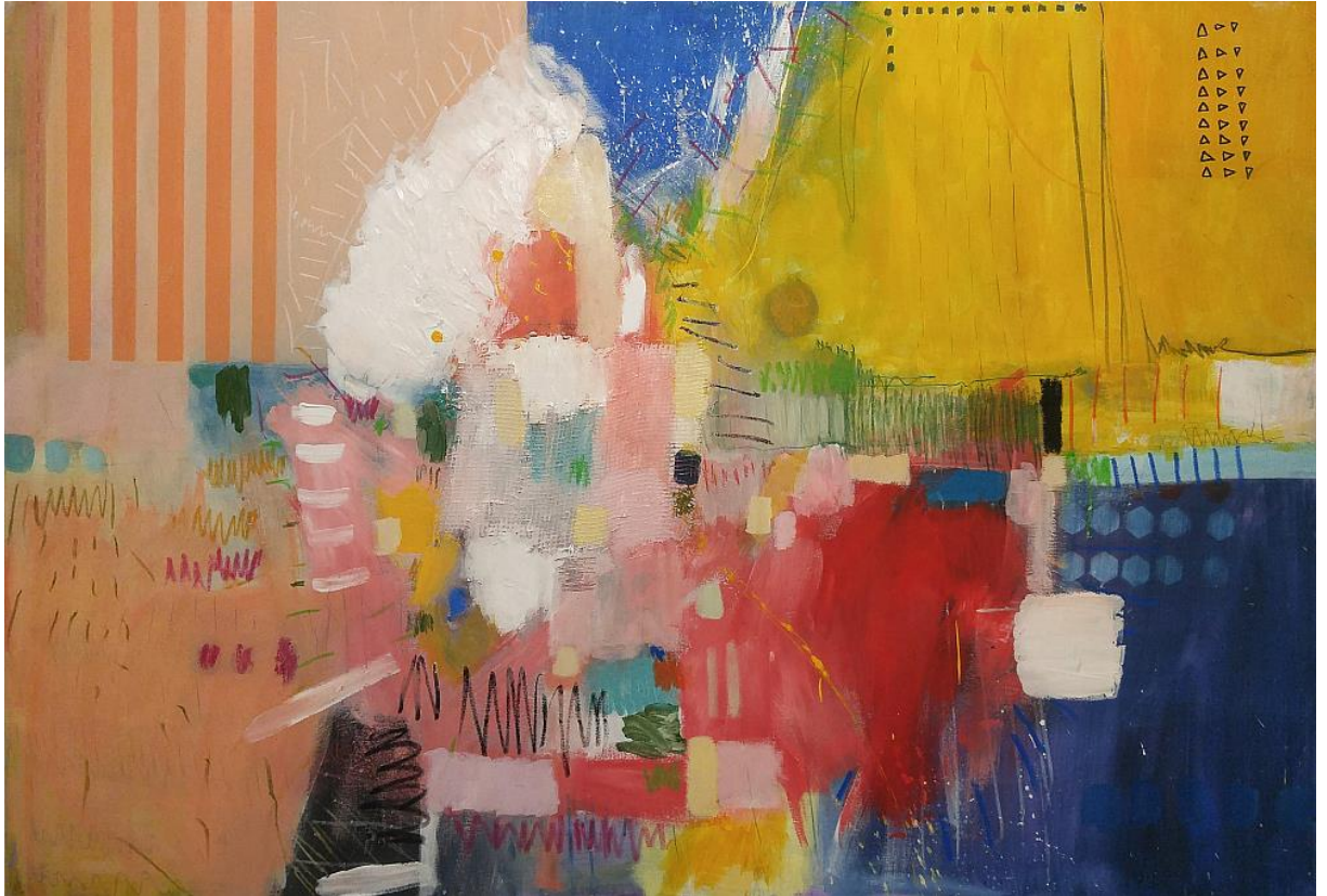
Slika 5. Ranko Ajdinović, akrilik na platnu