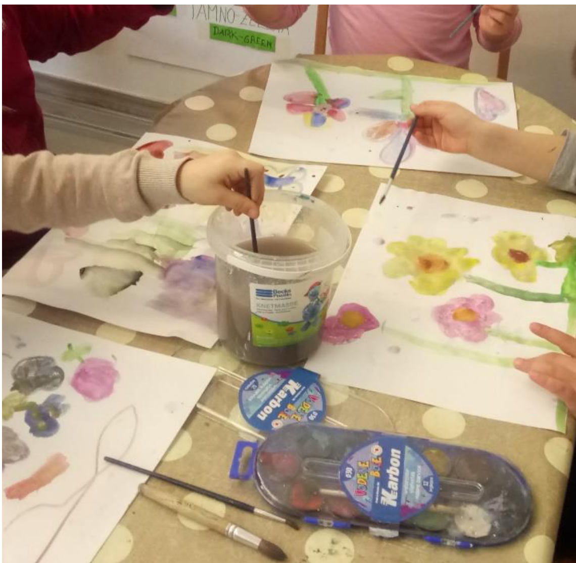
Slika 16. Proljetno cvijeće- tehnika akvarel

U likovnim uradcima može se zamijetiti kako su strukture pravilne gotovo kao da su crtane bojom. S druge strane djeca skupine u dobi 3-5g lakše su pristupila likovnoj aktivnosti, nego kada se radi s bojicama.