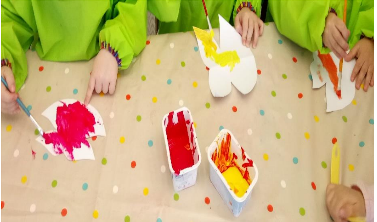
Slika 24. Bojanje lista- tempera