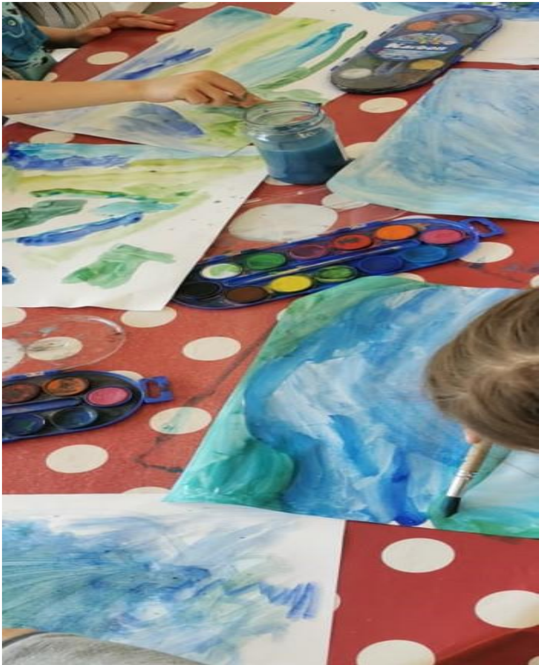
Slika 22. More- akvarel