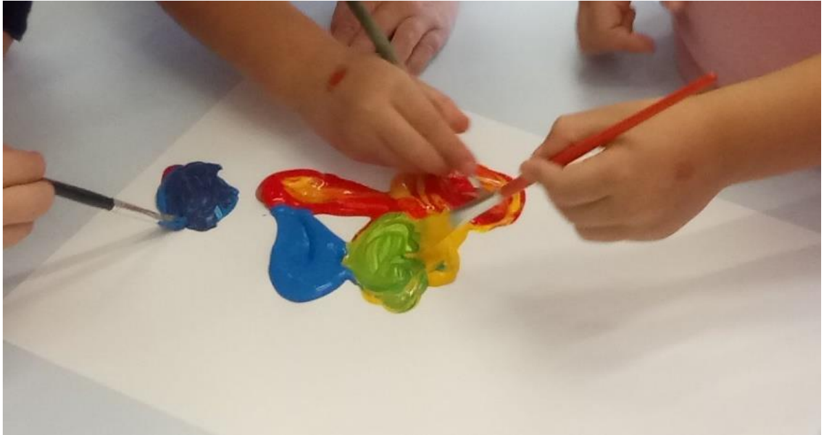
Slika 8. Miješanje primarnih boja