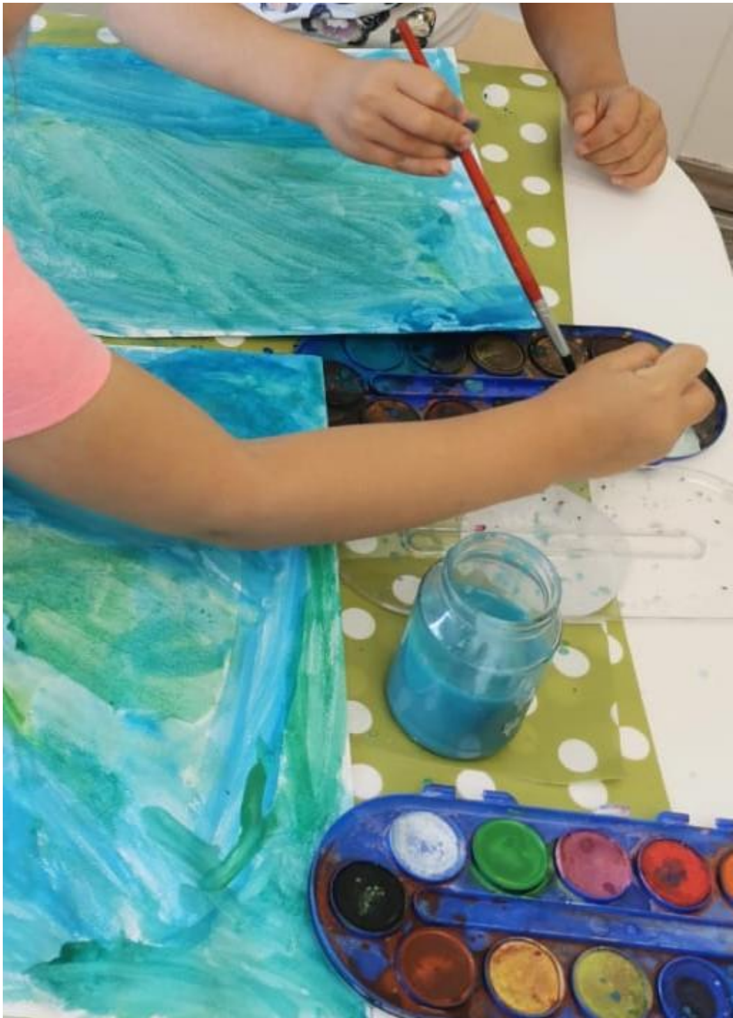
Slika 21. More- akvarel