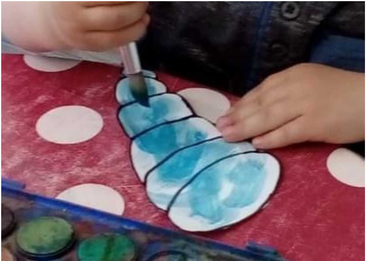
Slika 27. Bojanje predložaka- akvarel