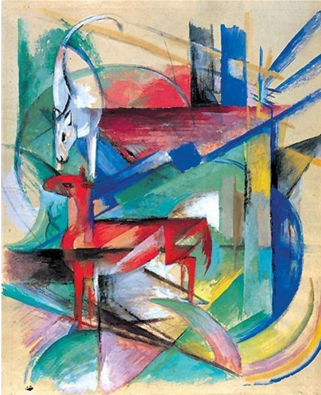
Slika 6. Gvaš, Franz Marc, Pejsaž sa životinjama, 1913.