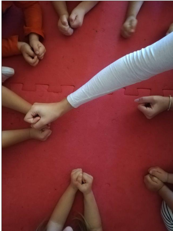
Slika 8. Prikaz igre Okoš - bokoš

Igra počinje od svoje brade (na “Bum”). Na kome se brojica zaustavi, taj mora odgovoriti koliko mu jaja treba. Brojač opet kreće brojati onoliko puta koliki je broj izgovoren i to tako da šakom opet kreće od brade. Kad dođe do tog broja, ono dijete na kojem je stala brojica makne jednu ruku. Kad makne obje ruke, dijete ispada iz igre.