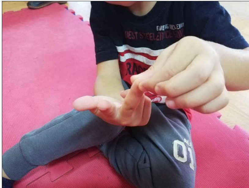
Slika 7. Prikaz položaja prstiju kod dječaka

Ovaj čovječuljak spava, a ovaj čovječuljak kaže laku noć. Ovaj čovječuljak je znatiželjan i gleda snove a ovaj se probudio i krenuo u vrtić.