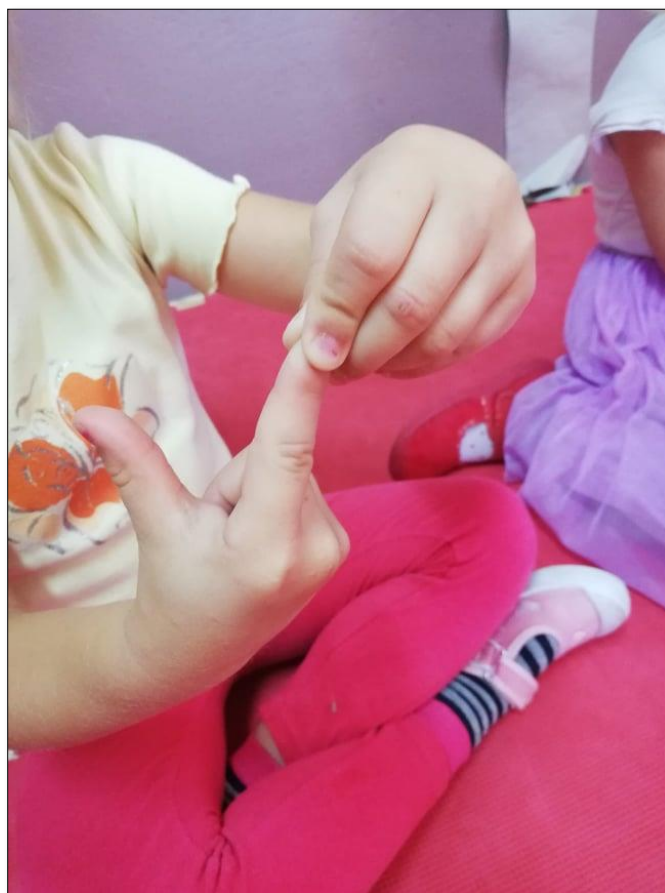
Slika 6. Prikaz djevojčice s drugačijim položajem ruku

Ovaj prstić spavat želi Ovaj mu laku noć veli. Onaj prstić je zadrijemo, Ovaj slatke snove gleda. Ovaj se ranije ujutro digao I na vrijeme u vrtić stigao.