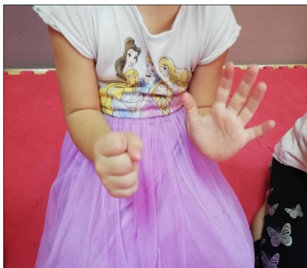
Slika 4. Priprema ruku kod djevojčice