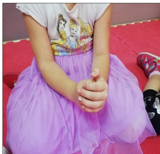
Slika 5. Vrtnja ruku kod djevojčice

Slika 4. Prikazuje djevojčicu koja kako priprema položaj ruku za igru rukama.