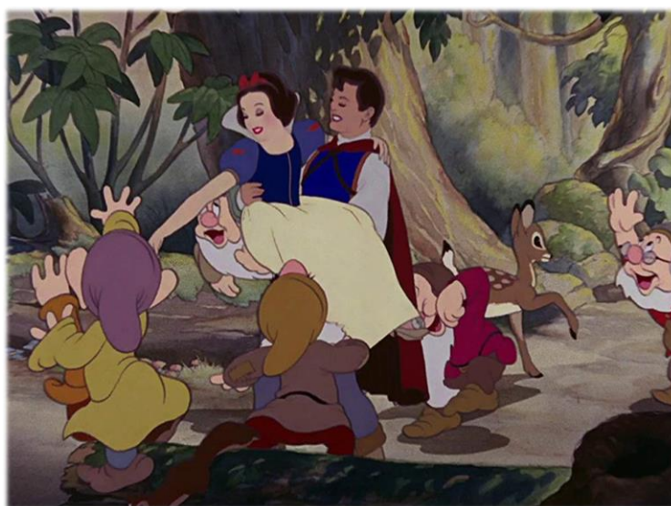
Slika 6. Scena iz animiranog filma „ Snjeguljica i sedam patuljaka “