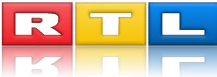
Slika 4. Logotip RTL televizije