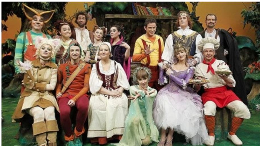
Slika 7: Likovi iz edukativne emisije „ La Melevisione “

Svi navedeni TV kanali, osim kanala Rai2 i Italia1 emitiraju cjelodnevni program namijenjen samo djeci i mladima. Spomenuta dva imaju određeno doba u danu kada prikazuju programe namijenjene djeci. Od svih tipičnih crtanih serija i filmova koji se emitiraju i na većini ostalih svjetskih i hrvatskih kanala, poseban je program „ La Melevisione “. 30 To je edukativna emisija namijenjena djeci predškolske dobi u kojoj se djeci prikazuju bitne ili teške životne situacije na način koji je njima shvatljiv. Primjeri takvih situacija su onečišćenje okoliša, različitosti, razvod braka roditelja djeteta, smrt drage osobe i slično.