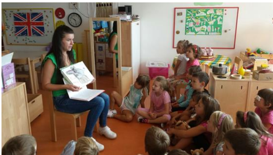
Slika 21. Čitanje priče na hrvatskom i engleskom jeziku

„Treba nam zadnja stranica gdje se možemo potpisati.“