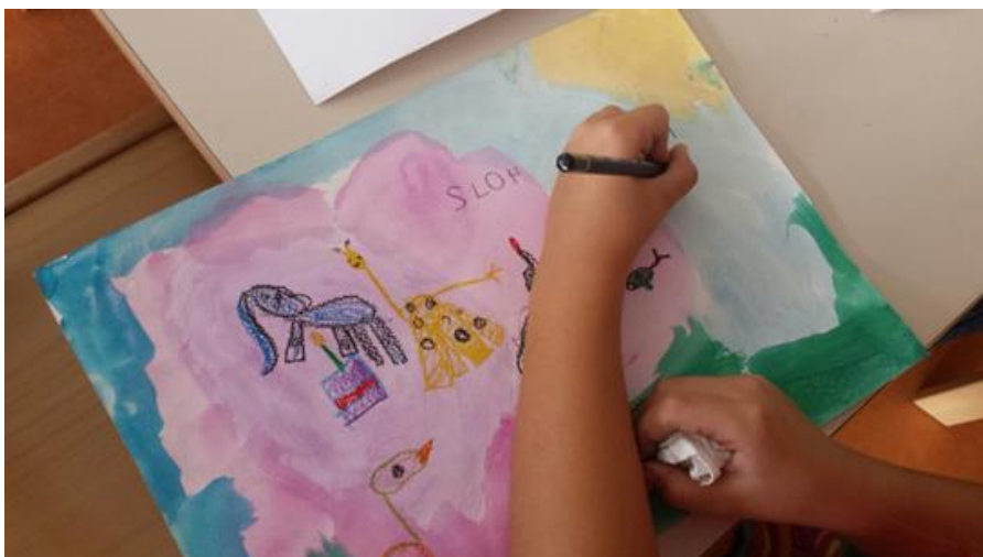
Slika 17. Slikanje pastelom preko akvarela

Motiviranje za daljnji rad u grupi bilo je jednostavno. Primjerice, na pitanje jesu li slike suhe, većina djece bi se skupila oko staka za slike. Potom bi slagala suhe slike na hrpu. S obzirom na to da je pridobivena njihova pažnja, iskorišten je trenutak da se njihova priča „Slonić Spavanko“ pročita još jednom što je cijela grupa pažljivo pratila. Djeca su pomogla oko spajanja dva stola i donošenju stolica za slikanje. Na stolu su se nalazile pastele, a na ormariću kraj djece su bile bojice, flomasteri i olovke. Tako su djeca mogla izabrati s čime žele slikati preko akvarela.