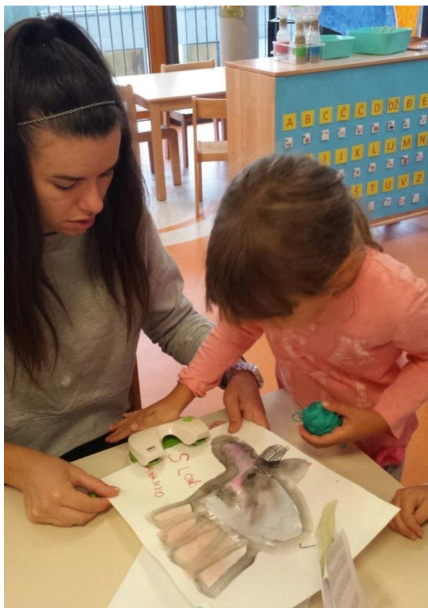
Slika 22. Bušenje rupica