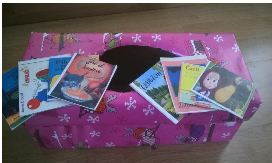
Slika 11. „Šarena kutija“