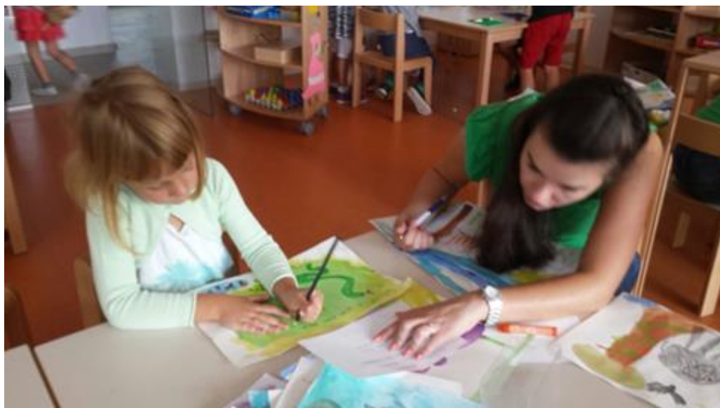
Slika 19. Pisanje teksta priče

Pratilo se njihovo slikanje. Djeca su samostalno odlučivala koji dio priče će slikati na temelju osmišljene priče. Na bijelim papirima bile su im napisane riječi i rečenice (velikim tiskanim slovima) koje bi oni prepisivali na ilustracije. Kada bi imali poteškoća, pomoć im je pružana na taj način da im se slovka i pokazivalo prstom slovo po slovo koje trebaju napisati.