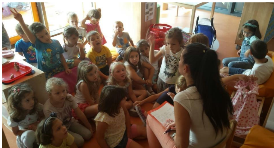
Slika 13. Istraživanje tehnike