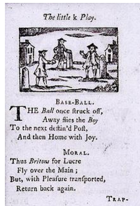
Slika 2. Primjer jednostavne pjesmice s ilustracijom 2

Prva je to ilustrirana knjiga kojoj je namjera bila zabavno štivo na engleskome jeziku. (Lloyd i Mitchinson, 2006)