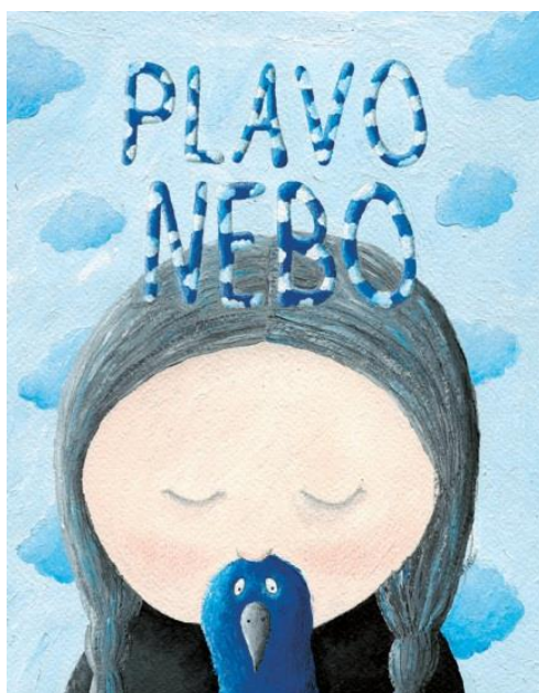
Slika 7. Naslovna strana „Plavo nebo“ Andree Petrlík Huseinović 7