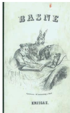
Slika 4. Basne ilustratora Laupperta 4

Prema sadašnjim saznanjima, prva slikovnica koju možemo vezati za hrvatske autore (misli se i na književni tekst i na ilustracije) je „Sveti Nikola u Jugoslaviji“ koja je objavljena godine 1922., iako se autorima ne znaju imena. (slika 5). U obliku parodije stvara se slikovnica „Sveti Nikola u Jugoslaviji“ kako bi autori progovorili o trenutačnoj političkoj i ekonomskoj situaciji u državi.