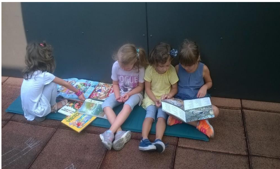
Slika 14. Istraživanje slikovnice

Istraživanje slikovnica se nastavilo i u slobodnoj igri na svježemu zraku. Na terasi djeci su bile ponuđene razne slikovnice kako bi mogla samostalno čitati.