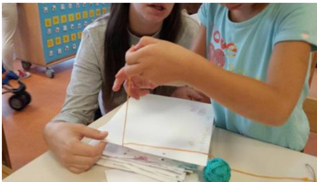
Slika 23. Uvezivanje slikovnice