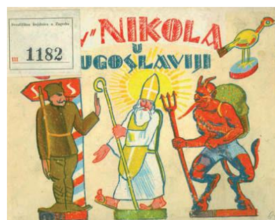
Slika 5. Prva slikovnica hrvatskih autora 5