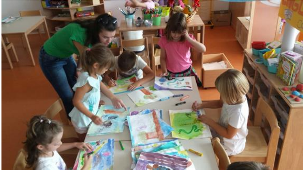
Slika 20. Likovni kutić

Kako je priča pripremljena i na engleskom jeziku jedna slikovnica se pisala na hrvatskome, a druga na engleskome jeziku.