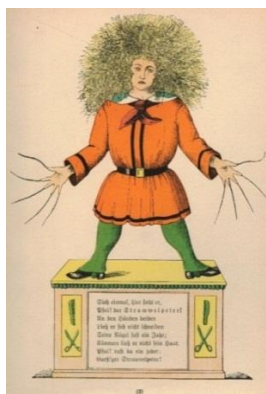
Slika 3. Struwwelpeter izdanje iz 1917. 3

Tijekom druge polovice 19. stoljeća pojavljuju se slikovnice s igračkama i ilustracijama koje su dominirale nad tekstom. Sadržavale su veliki broj ilustracija i veoma malo teksta, a većina ilustracija bilo je u boji. Uglavnom su sadržavale između 8 i 12 stranica ilustracija koje su pratile tekst neke klasične priče. Dio britanskih i američkih umjetnika zarađivao je ilustriranjem slikovnica.