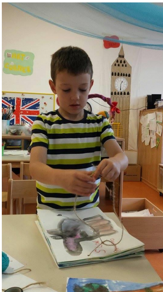
Slika 24. Vezanje mašne na slikovnici

Onda kada je slikovnica bila završena – djeca su pripremila bojice kako bi se potpisala na posljednju stranicu. Tijekom okupljanja za vrijeme tzv. „English time“ posljednji se puta pročitala slikovnica. Toga puta potpuno gotova – ilustrirana, napisana i uvezena.