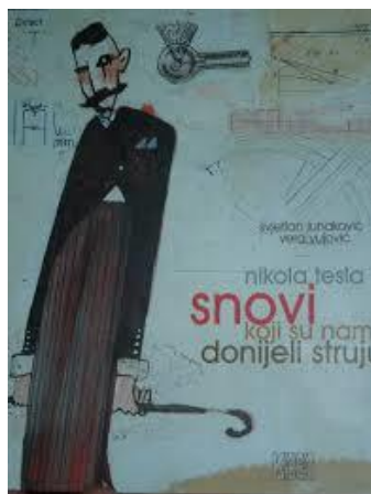
Slika 8. Naslovna strana „Nikola tesla: snovi koji su nam donjeli struju“ Vere Vujović i ilustratora Svjetlana Junakovića 8