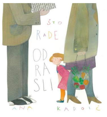
Slika 9. Naslovna strana „Što rade odrasli“ Ane Kadoić 9