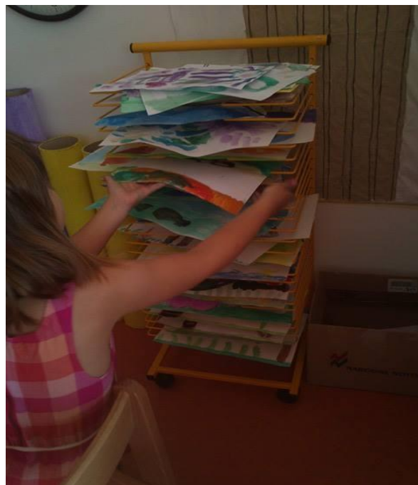
Slika 16. Sušenje radova

Djeca su samostalno slikala, mijenjala vodu za akvarel, prala kistove i podloge te stavljali radove na stalak za sušenje onda kad su bila završeni.