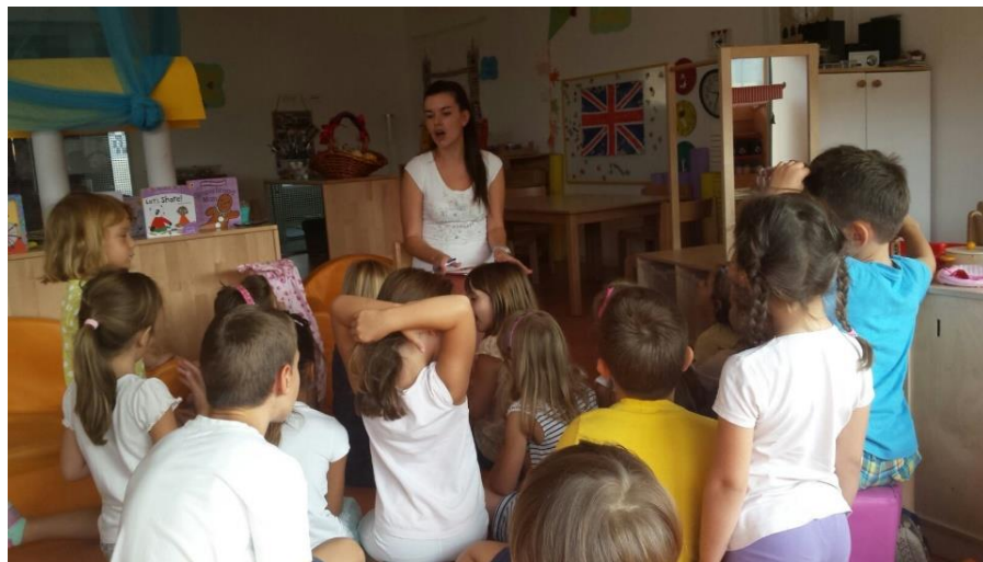
Slika 12. Osmišljavanje priče za slikovnicu

Sama boja koja ostaje na papiru kao trag poteza ostavlja dojam praha koji se grupira u oblike pa plohe djeluju rahlo, baršunasto, krhko i hrapavo. U prah već nanese boje možemo umiješati prah nove boje i dobiti veliko bogatstvo miješanja boja. Taktilnost površine reagira na jačinu pritiska ruke i pojedine partije slike mogu postići impasto fakturu nakon jačeg akcentiranja slikareve ruke; tako struktura poteza i rukopisa može dati vrlo složenu gradaciju i preplet slikarskih efekata. Na debljim dijelovima boje moguće je i ugrebati crtež. Često treba djeci sugerirati da (uljanu) pastel jače pritisnu u podlogu kako boje ne bi bile blijede i beskrvne. Podloga, papir za pastel treba biti hrapavi papir kako bi što bolje ostrugao prah boje sa štapića. Najzgodniji papir za rad je pak-papir, odnosno natron-papir, najbolje toniran smeđi ili sivi. Moguće je raditi i na prepariranom platnu, i na kartonu.