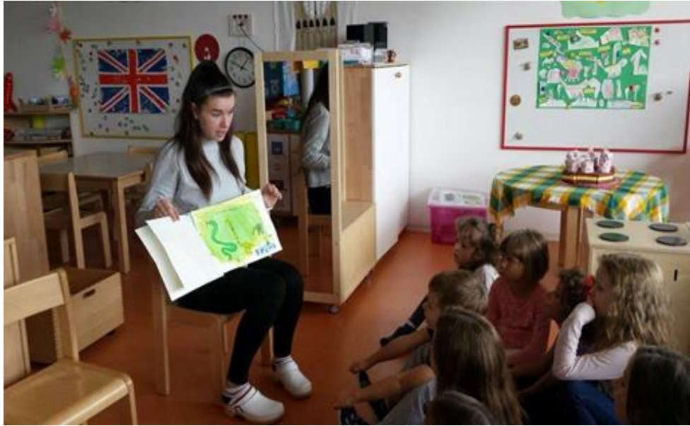
Slika 25. Čitanje slikovnice