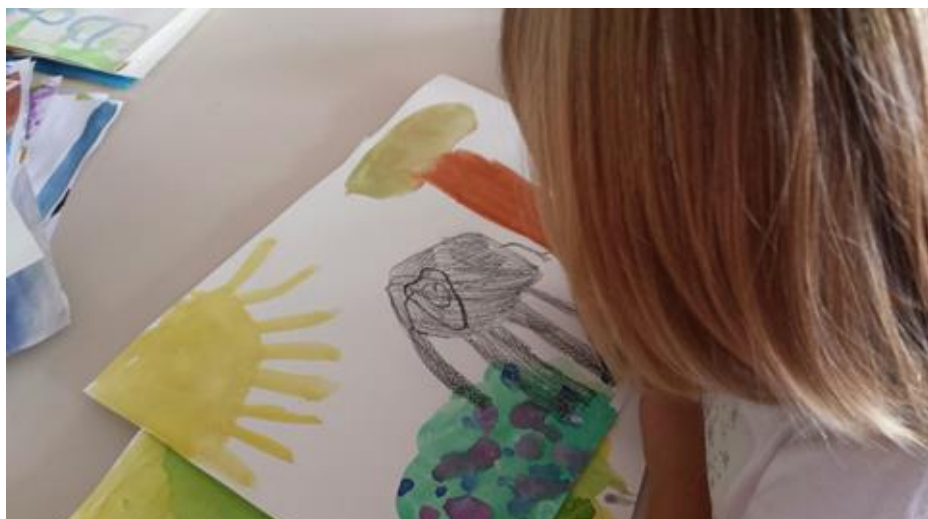
Slika 18. Slikanje pastelom preko akvarela

Pratilo se njihovo slikanje. Djeca su samostalno odlučivala koji dio priče će slikati na temelju osmišljene priče. Na bijelim papirima bile su im napisane riječi i rečenice (velikim tiskanim slovima) koje bi oni prepisivali na ilustracije. Kada bi imali poteškoća, pomoć im je pružana na taj način da im se slovka i pokazivalo prstom slovo po slovo koje trebaju napisati.