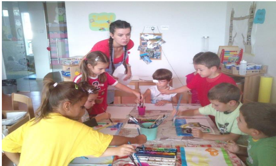
Slika 15. Slikanje priče

odlučivali žele li slikati ili igrati se. Do kraja dana su sva djeca, u jednom trenutku, bila zainteresirana za slikanje.