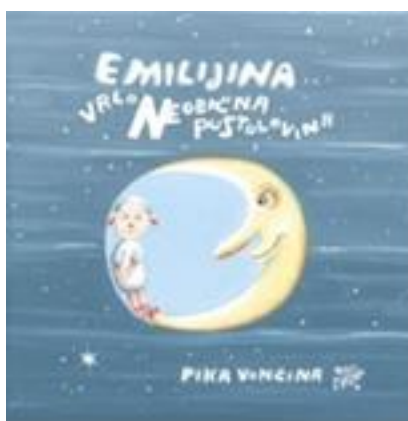
Slika 10.naslovna strana „Emilijina vrlo neobična pustolovina“ Pike Vončine 10