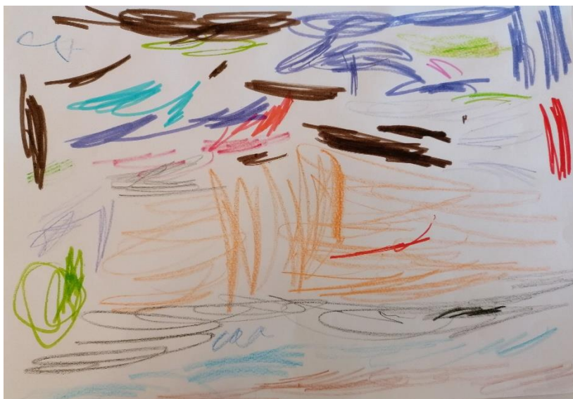
Slika 6. „Mrak“ (4,3 godine, Ž)

Od ukupno 34 ispitane djece tek je troje u svojim likovnim izrazima iskazalo strah od mraka (1) i strah od snova (2). Strah od mraka i od snova iskazala su djeca u dobi od 4 godine.