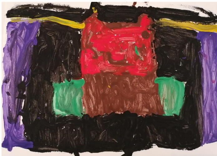
Slika 4. „Čudovište – robot „(5,5 godina, M)

Slika 4. prikazuje strah od čudovišta kojeg dječak objašnjava kao robota. Tehnika kojom se dječak služio je slikanje temperama na A5 papiru. Dječak je bojama popunio gotovo cijeli papir, a robota je centrirao u sredini. Tijekom procesa crtanja dječak je spontano započeo s pričanjem priče kojom objašnjava ono što slika. Po njegovom objašnjenju, oko robota-čudovišta naslikao je svoj strah koji je prikazan tamnim nijansama te je napomenuo kako se robota najviše boji kada je mrak, što isto možemo objasniti crnilom koje se nalazi oko robota.