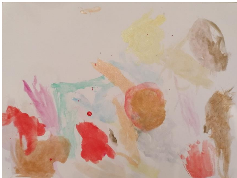
Slika 5. „Čudovište“ (5,4 godina, Ž)

Slika 5. prikazuje rad djevojčice koja, za razliku od svojih vršnjaka, primjetno zaostaje u svim područjima razvoja. Djevojčica je svojim likovnim radom izrazila strah od čudovišta uz pomoć akvarela na podlozi A5 papira. Čudovište je prikazano blagim nijansama kromatskih boja. Ukoliko rad promatramo usporedno s radovima djece iste kronološke dobi, uočavamo razlike, odnosno nedostatke; ne definiranost oblika, linija i obrisa. Rad više slični na črčkanje, odnosno šaranje koje je kao faza likovnog izražavanja primjerena djeci u dobi do 3 godine života. Ukoliko sliku promatramo s drugog stajališta, možemo na slici primijetiti životnost osjećaja (kruženje kistom) koji su prisutni bez jasno definirane forme objekta. Prilikom likovnog procesa djevojčica je vrlo malo verbalno komunicirala te je samo šapatom odgojiteljici dala do znanja da je ono što ona slika čudovište.