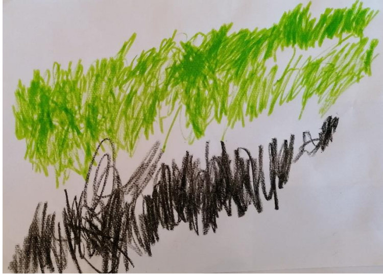
Slika 9. „Grmljavina“ (4, 3 godine, M)

Grmljavina kao prirodna pojava s kojom se često susrećemo kod pojedine djece izaziva strah. Često je taj strah povezan s osjećajem nemoći i straha. Slika 9. prikazuje grmljavinu naslikanu pastelama na A4 papiru. Potezi bojama nemirni su i intenzivni. Prilikom proces stvaranja rada, dječak je svom energijom „šarao“ po papiru. „ Grmljavine se bojim pogotovo kada je mrak, mogu doći čudovišta. “ iskaz je da od straha od grmljavine proizlaze i ostali strahovi, odnosno strahovi od imaginarnih bića. Dijete objašnjava kako kada se boji najviše voli biti s roditeljima što mu daje osjećaj sigurnosti.