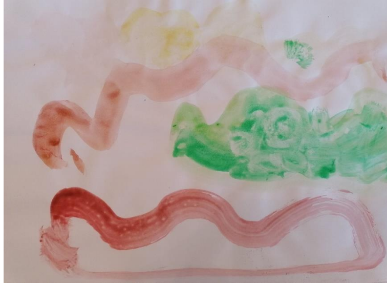
Slika 11. „Voda“ (5 godina, Ž)

Slika 11. rad je djevojčice koja je tehnikom akvarela prikazala svoj strah od vode na papiru A4. Na radu je zapravo prikazano more smeđom, zelenom i žutom bojom što i kod ovog rada upućuje da je odabir boje subjektivnog karaktera. Valovitim i kružnim linijama djevojčica prikazuje gibanje valova.