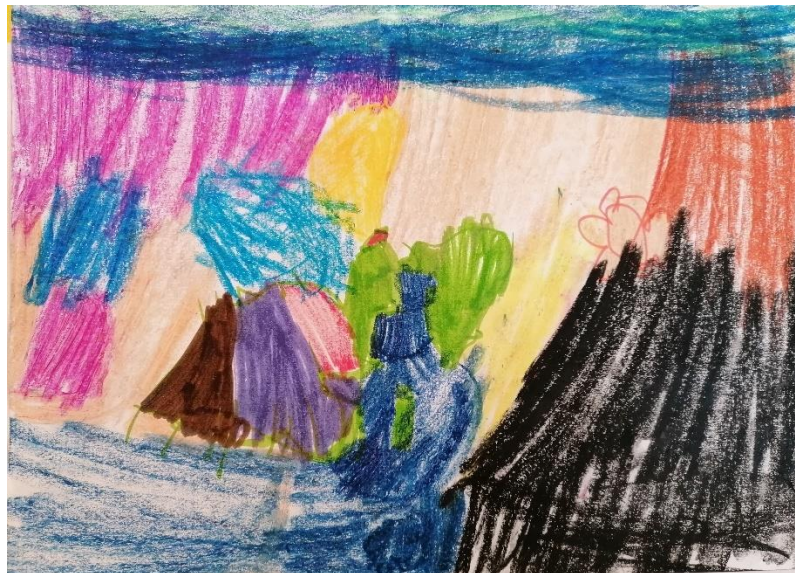
Slika 8. „Potres“ (5 godina, Ž)

Strah od vode (3), strah od lavine (1), strah od grmljavine (1) i strah od potresa (5) strahovi su koji spadaju u navedenu kategoriju. Najveći broj djece je kao strah iz ove kategorije likovno prikazalo strah od potresa koji je racionalno opravdan s obzirom na to da je potres pogodio Zagreb prije nekoliko mjeseci.