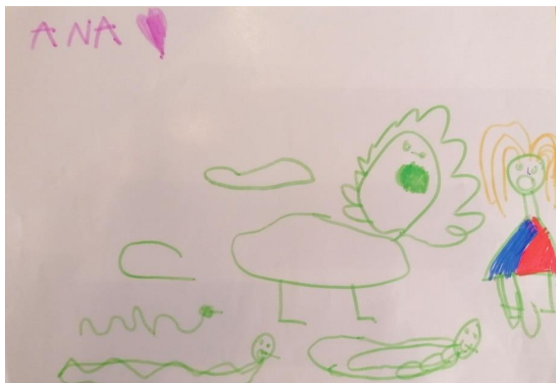
Slika 1. „Lav i zmije“ (5,1 godina, Ž)

Među najmnogobrojnijim strahovima djece predškolske dobi, istražene povodom ovog istraživanja pokazao se strah od životinja. Najveći broj djece izrazio je svoj strah od zmija (5) i strah od lavova (4), zatim strah od morskog psa (1), strah od malog psa (1) i medvjeda (2).