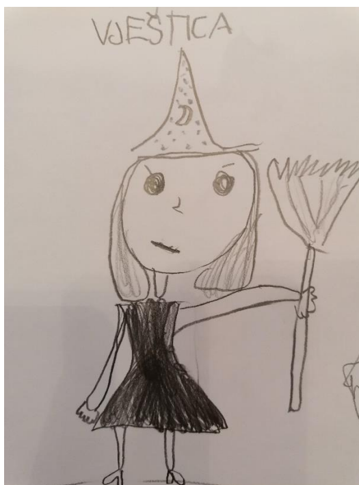
Slika 3. „Vještica“ (7 godina, Ž)

Strah od imaginarnih bića je strah koji nije utemeljen na racionalnom razlogu za strah, no takav strah djetetu služi za zaštitu. Dijete percipira neki aspekt svoje okoline, koji mu se čini prijetećim, zatim se suočava s njim i pritom mu je potrebno mišljenje i podrška odraslih. (Ennulat, 2010.). Najviše djece je prikazalo čudovišta (10), vještice (5) i duhove (2) kao svoje najveće strahove. Povezno s verbalnim objašnjenjima, djeca su navodila čudovišta iz crtanih filmova, čudovišta koja zamišljaju noću kada padne mrak ili kada ne mogu spavati.