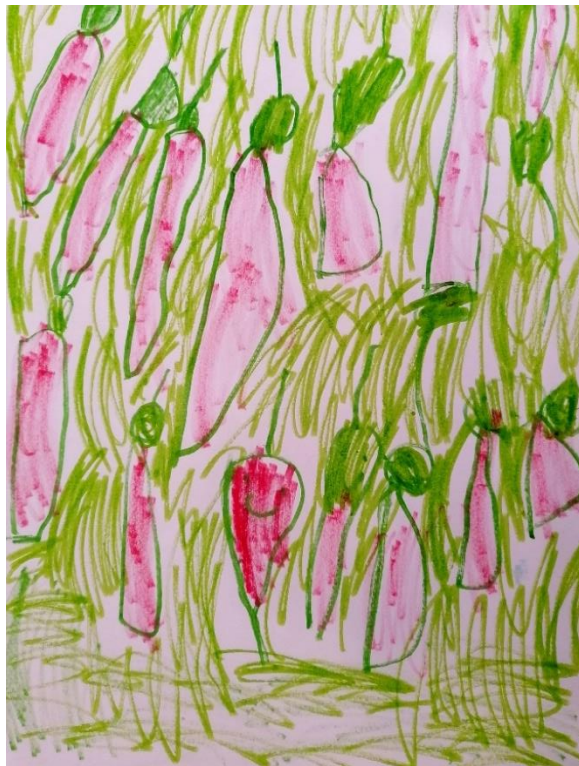
Slika 2. „Zmije“ ( 4,7 godina, Ž)

je svoje ruke, a noge su nejasno prikazane, što možemo objasniti činjenicom da se djevojčica osjeća poprilično nemoćno. U svoj likovnom izričaju djevojčica se koristila najviše zelenom bojom, koja samo djelomično odgovara realnom prikazu objekata. Iz toga možemo zaključiti da je korištenje boje subjektivnog karaktera.