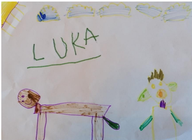
Slika 3. "Lav i ja" (6,10 godina, M)

Dječak na slici 3. na papiru A4 formata tehnikom flomastera prikazuje lava i sebe. Na crtežu su dodani detalji u obliku Sunca i oblaka. Dječak se koristio bojama koje realistično prikazuje simbole. Na crtežu je također vidljivo kako su lav i dječak u istoj ravnini, a iznad njih je nebo koje prikazano klasičnim šablonama. Na svom licu dječak je nacrtao preplašeni izraz lica, dodao je detalje poput vrata, uši i kose, no izostavio je trup što nam ukazuje da dijete još uvijek likovno percipira samo dijelove tijela koje smatra važnijim.