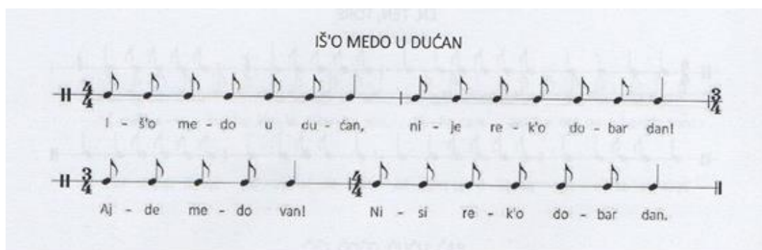
Slika 12. Brojalica Iš'o medo u dućan

To je jedna smisljena brojalica jer u sebi sadrži smislene riječi koje u ovom slučaju čine i kratku priču, no osim te priče ova brojalica daje i jasnu pouku – kada dođeš negdje, pristojno je prvo pozdraviti. Na taj način dijete uči o pravilima lijepog ponašanja, verbalnoj komunikaciji i socijalizaciji.