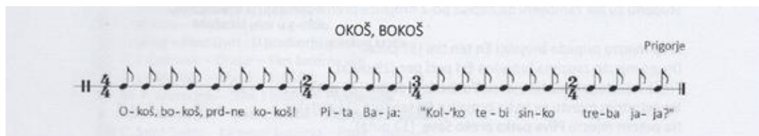
Slika 8. Brojalica Okoš, bokoš

Pošto su one narodno i dječje stvaralaštvo, neke brojalice imaju više varijanti jer dolaze iz različitih krajeva, no kako ne smijemo mijenjati autorske pjesme, tako ne smijemo mijenjati ni dječje brojalice.