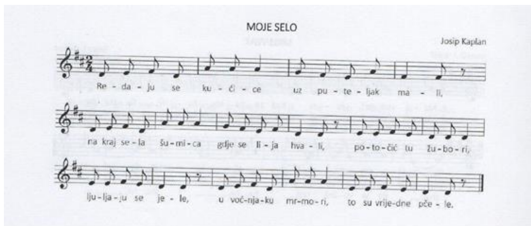
Slika 4. Pjesma Moje selo

Kroz pjesmu „Moje selo“ dijete može u potpunosti zamisliti kako izgleda jedno selo (poredane kućice uz puteljak, na kraju sela je šuma), što se u selu može naći (lija, potočić, jele, voćnjak) i tko su marljivi radnici sela (pčele).