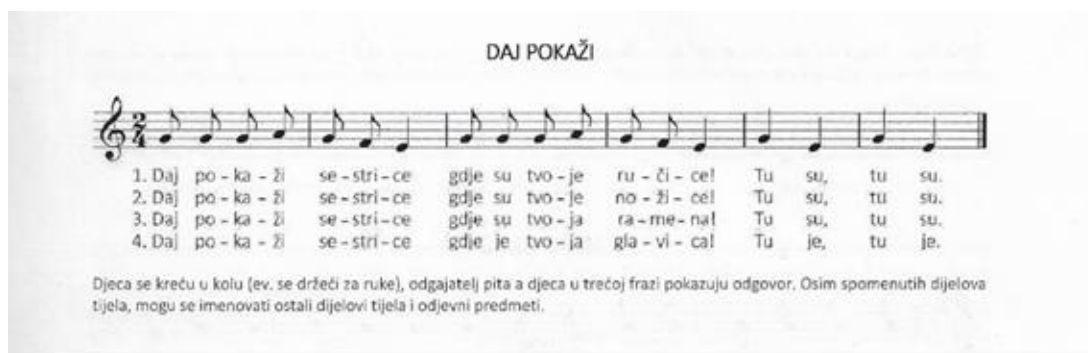
Slika 5. Igra s pjevanjem Daj pokaži (Izvor: Kraljić, J., Pjesmom kroz igru )

Osim toga, dijete može spoznati i svoje unutarnje osjećaje te osvijestiti kako se ne mora sramiti drugima pokazati je li tužno ili sretno u određenim situacijama koje ga rastužuju ili usrećuju. Na primjer, u igri s pjevanjem „Na kamen sjela Ljubica“, Ljubica se otvara svojoj sestrici i govori joj zašto plače, dok ju sestra tješi. U tome djeca dobivaju pozitivan primjer kako bi se i oni trebali brinuti za svoje prijatelje kada vide da su tužni te saznati od njih što ih muči i mogu li im na neki način pomoći, a time također unaprjeđuju svoj spoznajni razvoj kroz brigu za druge.