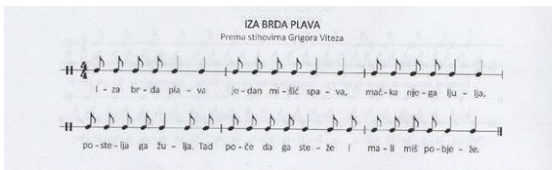
Slika 9. Brojlica Iza brda plava

U brojlicama čiji tekst nema nekog smisla možemo reći da su nabacane riječi koje ništa ne znače, no unatoč tome među njima postoji neki red pa su zbog toga jednako privlačne kao i one smislene, djeci čak i zanimljivije upravo zbog riječi s kojima se teško mogu susresti u svakodnevici, a često zvuče kao da se njima čarobira.