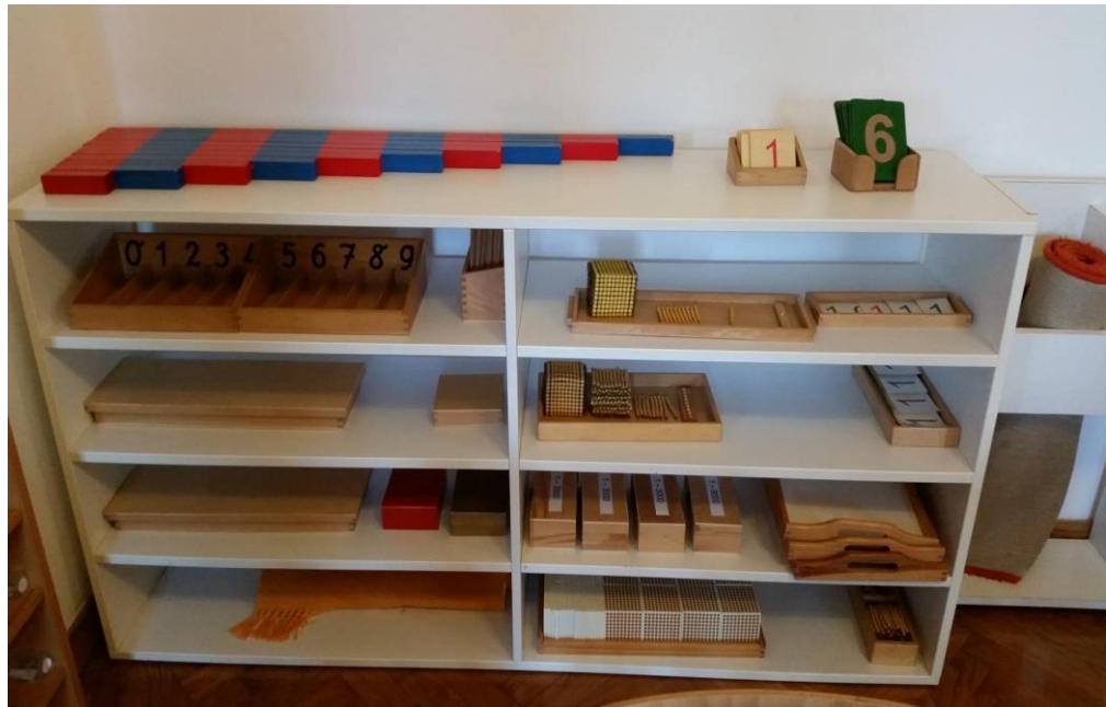
Slika 3. Materijali za razvoj matematike