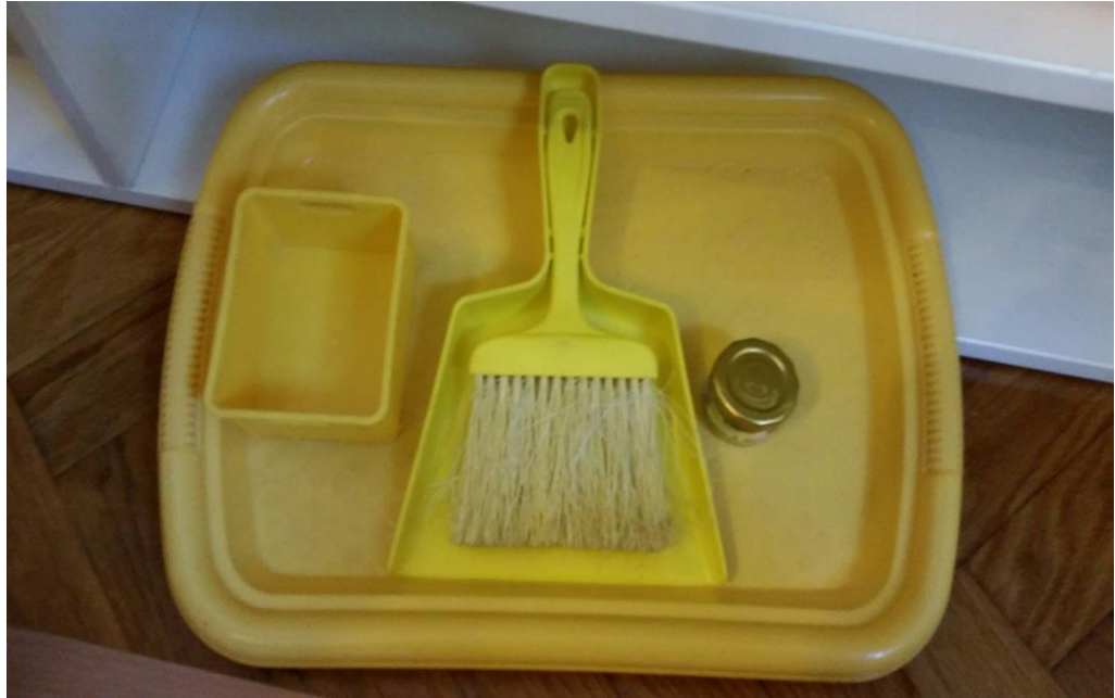
Slika 14. Materijal za razvoj vježbe iz praktičnog života – metenje