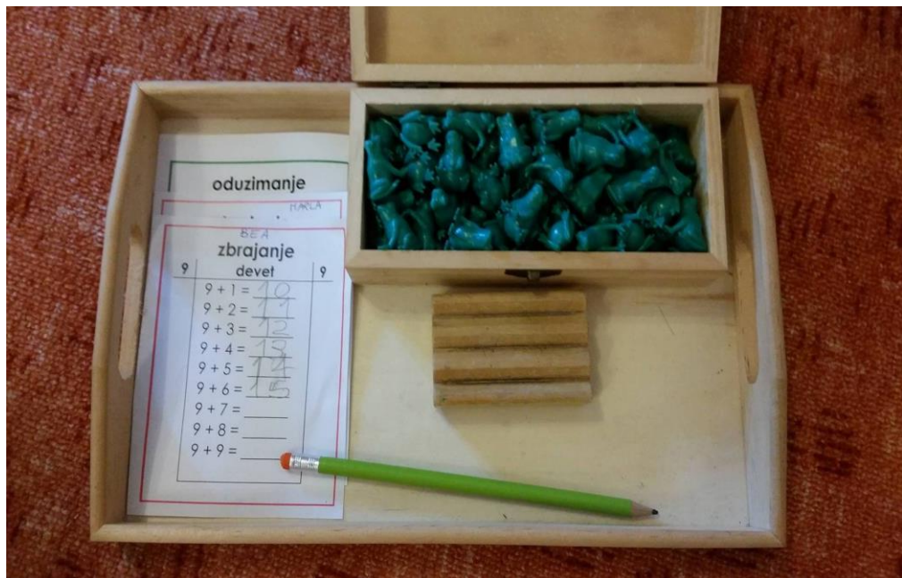
Slika 4. Materijal za razvoj matematike – oduzimanje i zbrajanje pomoću figurica žabica