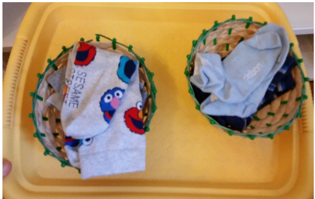
Slika 15. Materijal za razvoj vježbe iz praktičnog života – razvrstavanje čarapa