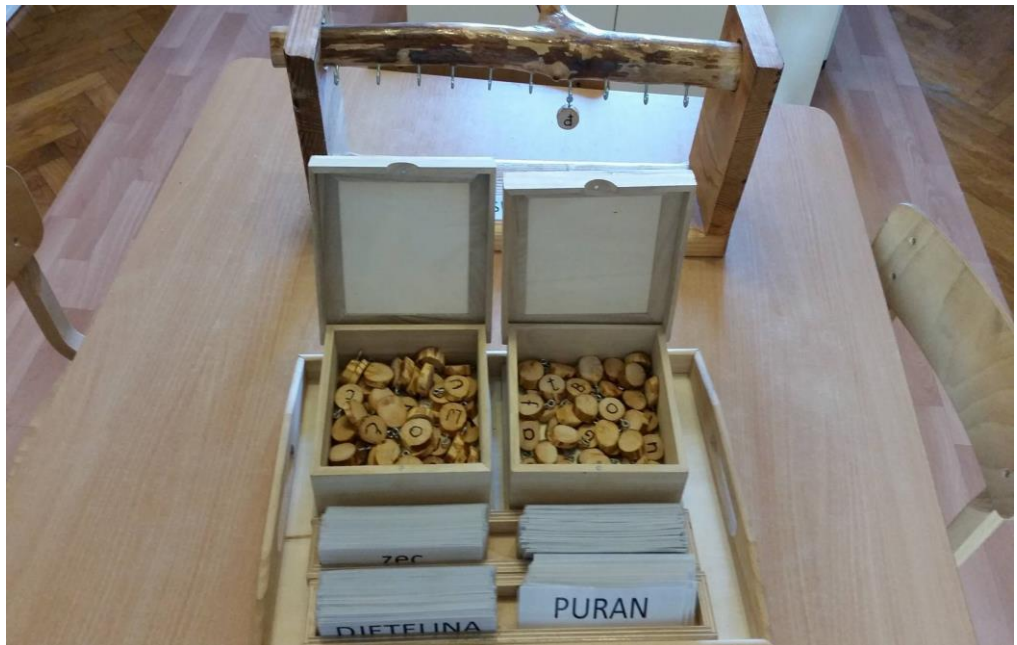
Slika 7. Materijal za razvoj jezika – slaganje riječi