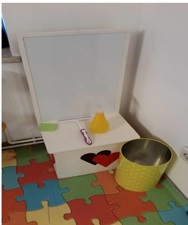
Slika 19. Materijal za razvoj vježbi iz praktičnog života – pranje stakla