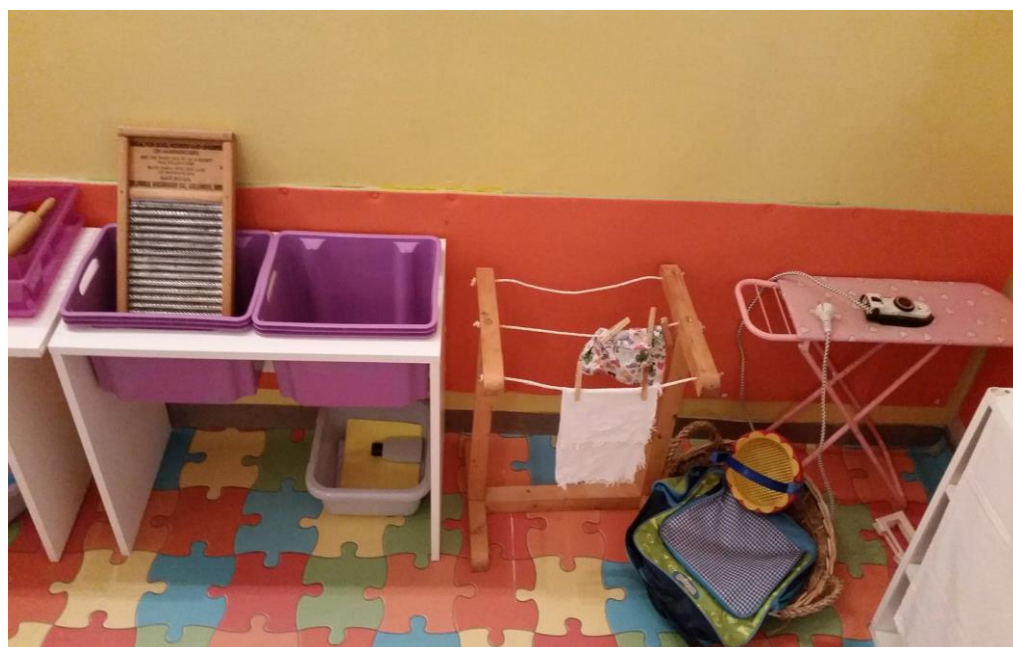
Slika 17. Materijali za razvoj vježbi iz praktičnog života – pranje rublja, vješanje rublja i peglanje