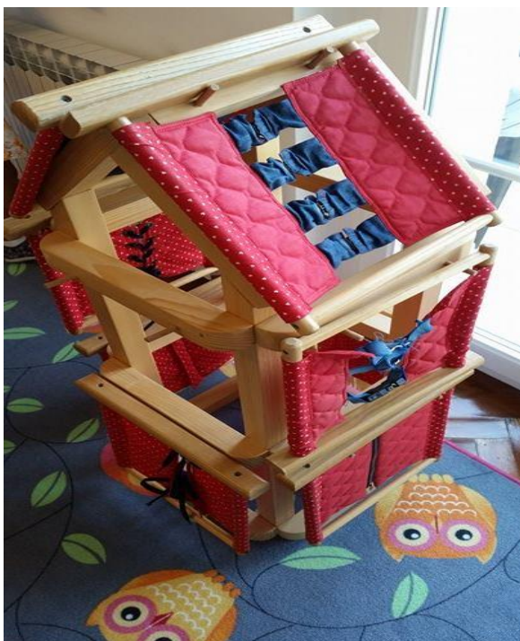
Slika 18. Materijal za razvoj vježbi iz praktičnog života – zakopčavanje, otkopčavanje, vezanje i odvezivanje