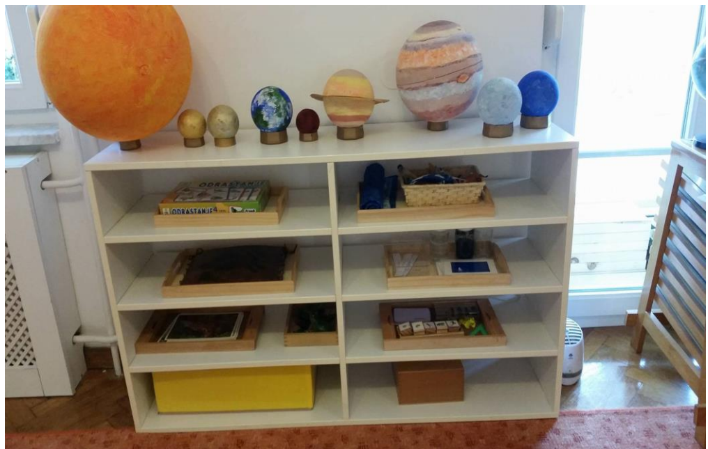
Slika 8. Materijali u centru za kozmički odgoj

Materijal za kozmički odgoj je vrlo raznovrstan: globusi, kartice sa zastavama, atlasi, zastave, materijali o svemiru, materijali za učenje pojmova iz geologije.