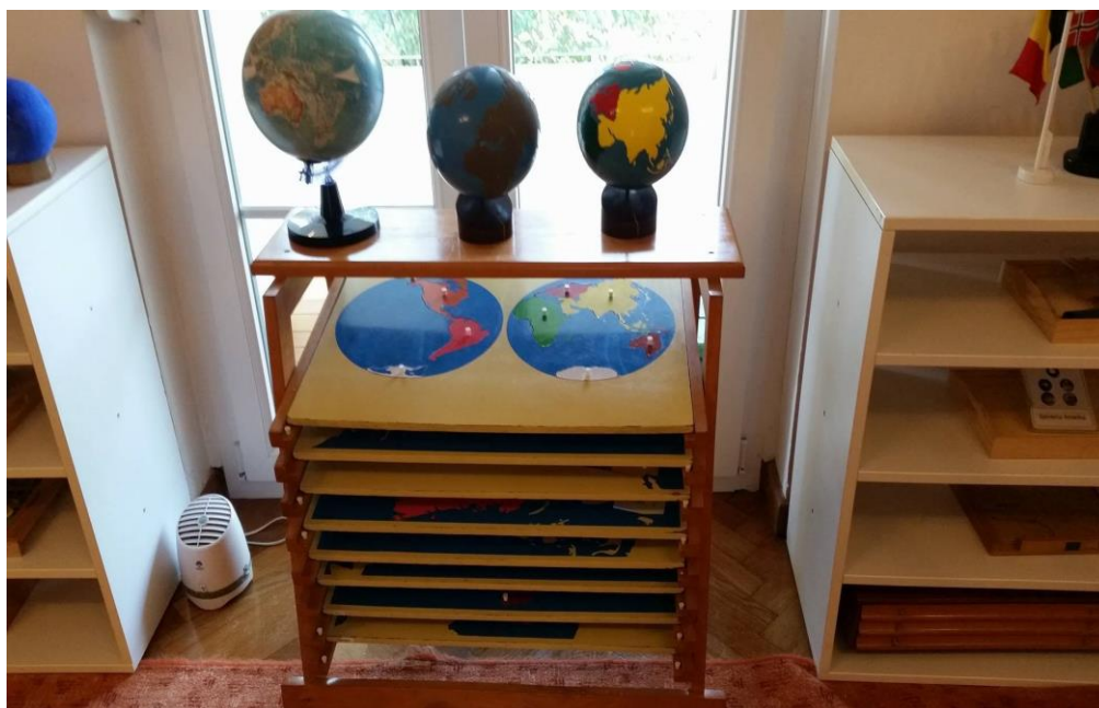
Slika 10. Materijali u centru za kozmički odgoj