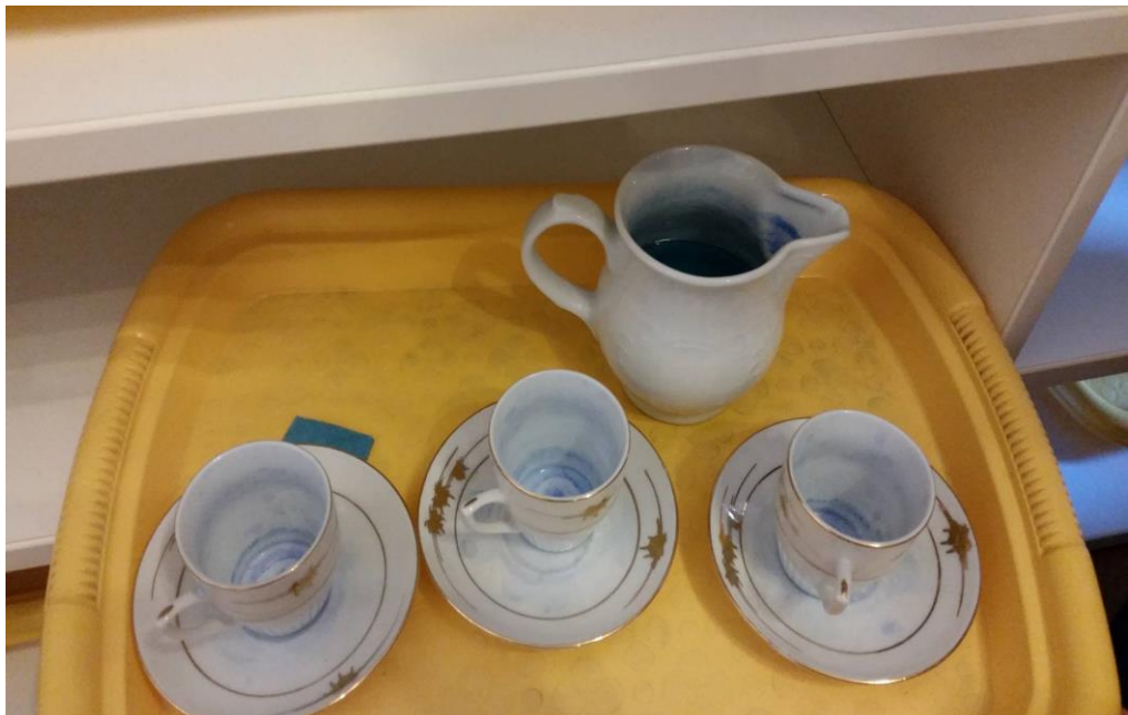
Slika 13. Materijal za razvoj vježbe iz praktičnog života – prelijevanje tekućine