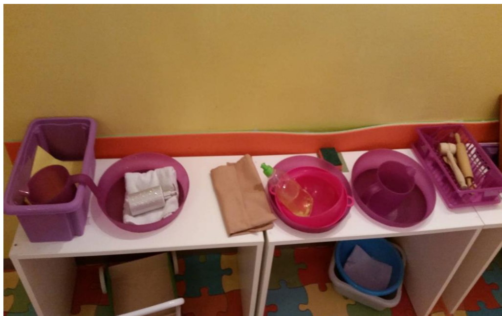
Slika 16. Materijali za razvoj vježbi iz praktičnog života – pranje posuđa i brisanje posuđa