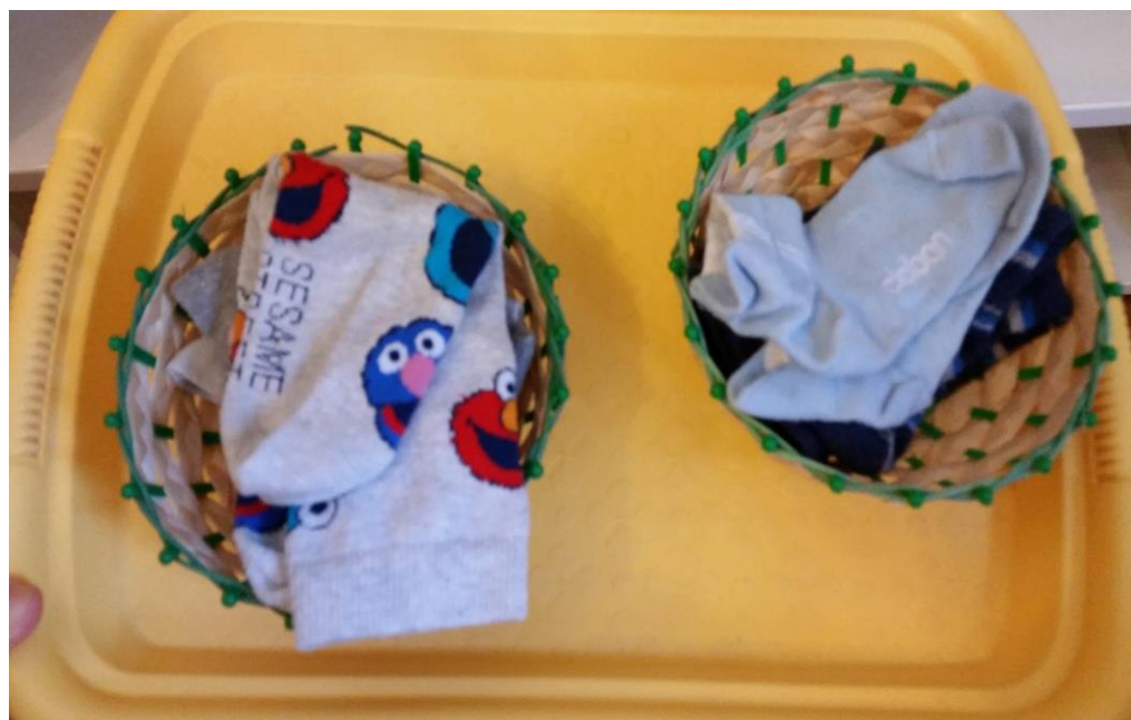
Slika 15. Materijal za razvoj vježbe iz praktičnog života – razvrstavanje čarapa