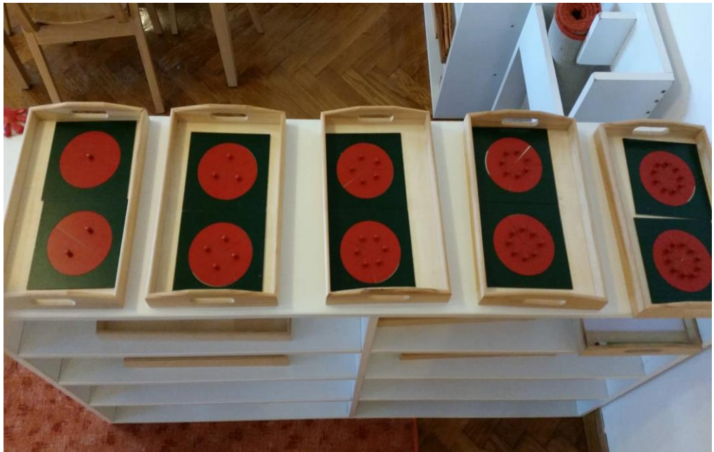
Slika 2. Materijal za razvoj matematike – predlošci za učenje razlomaka