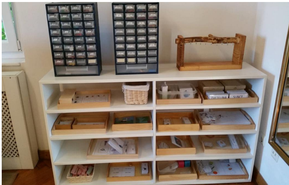
Slika 5. Materijali u centru za jezik

Materijali u centru za jezik su slova, pločice sa slovima, slikovne kartice i drugo. Budući da je centar podijeljen na dva dijela, na hrvatski i engleski jezik, materijal je prilagođen učenju oba jezika.