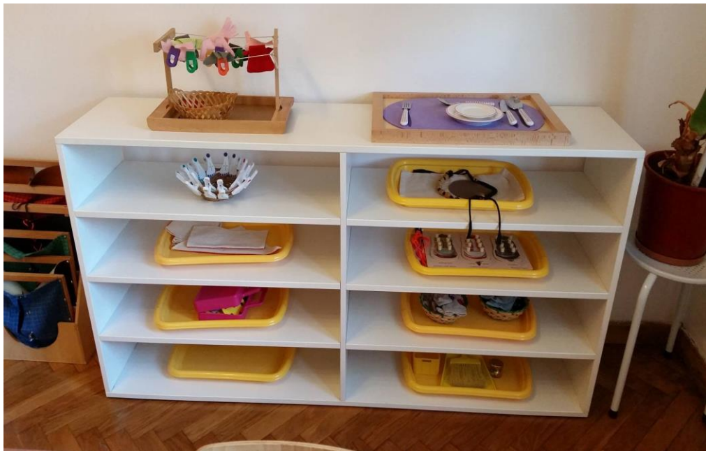
Slika 11. Materijali u centru za vježbe iz svakodnevnog života

Posuđe, vrčevi, pladnjevi, košare, kvačice, metlice, lopatice, spužve, krpice i ostali materijali u ovom centru su ono čime se odrasli pa i djeca služe u svakodnevnom životu pa aktivnosti s njima pomažu u razvoju samostalnosti i stjecanju samopouzdanja te u konačnici stjecanje važnih životnih vještina.