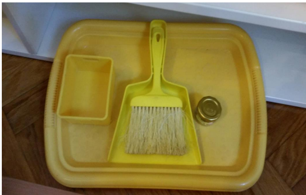
Slika 14. Materijal za razvoj vježbe iz praktičnog života – metenje