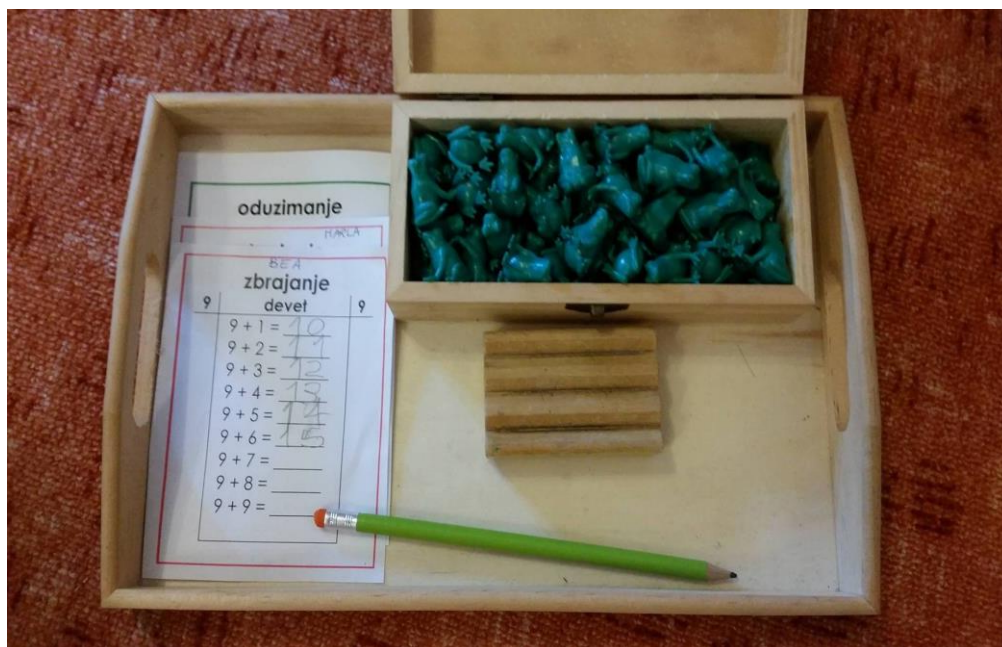
Slika 4. Materijal za razvoj matematike – oduzimanje i zbrajanje pomoću figurica žabica