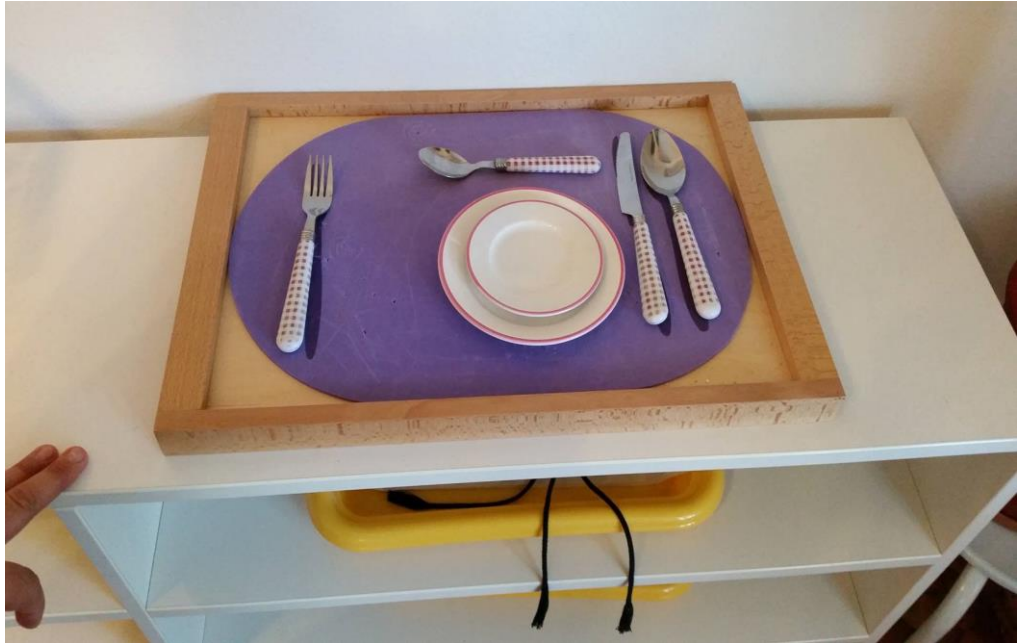
Slika 12. Materijal za razvoj vježbe iz praktičnog života – postavljanje stola