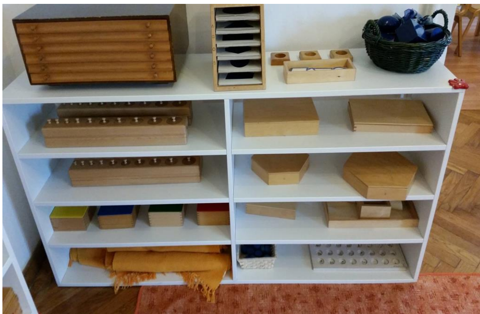
Slika 20. Materijali u centru za razvoj senzomotorike

Koriste se materijali koji potiču razvoj sluha, vida, dodira, mirisa, osjeta topline, osjeta težine i slično.