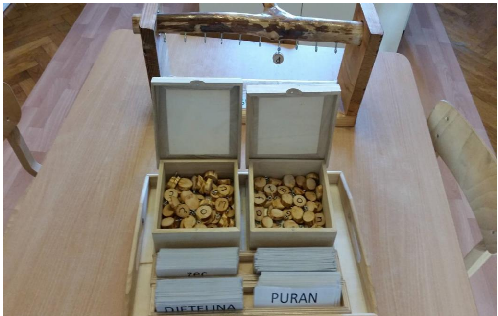
Slika 7. Materijal za razvoj jezika – slaganje riječi