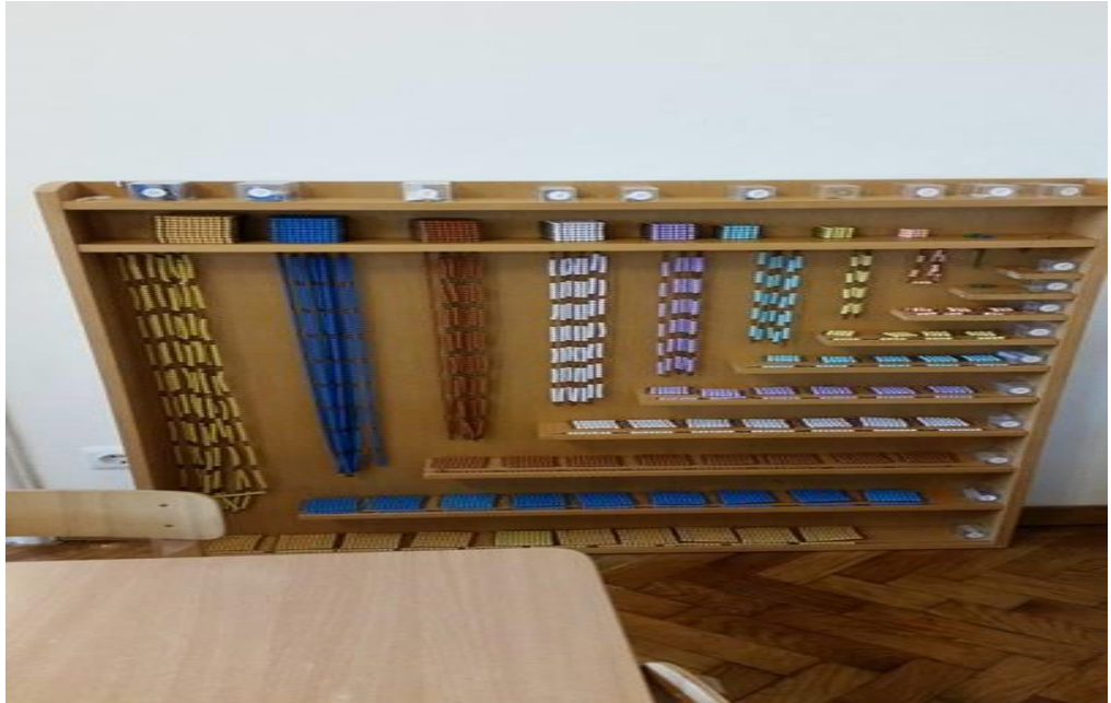
Slika 1. Materijal za razvoj matematike