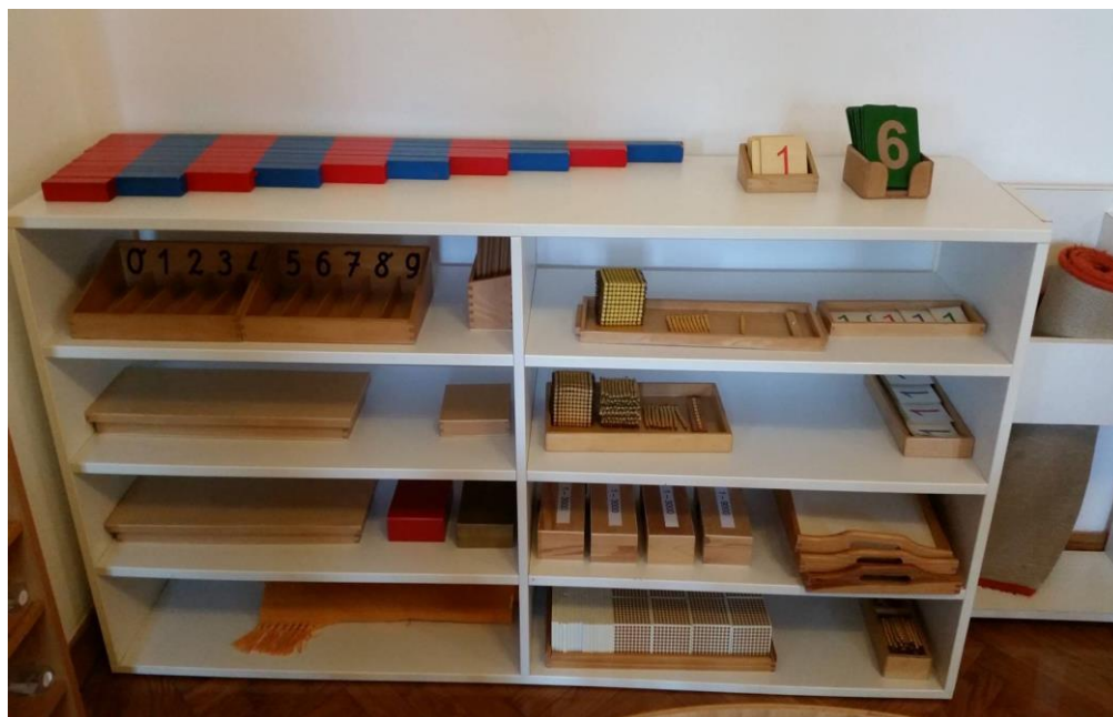
Slika 3. Materijali za razvoj matematike