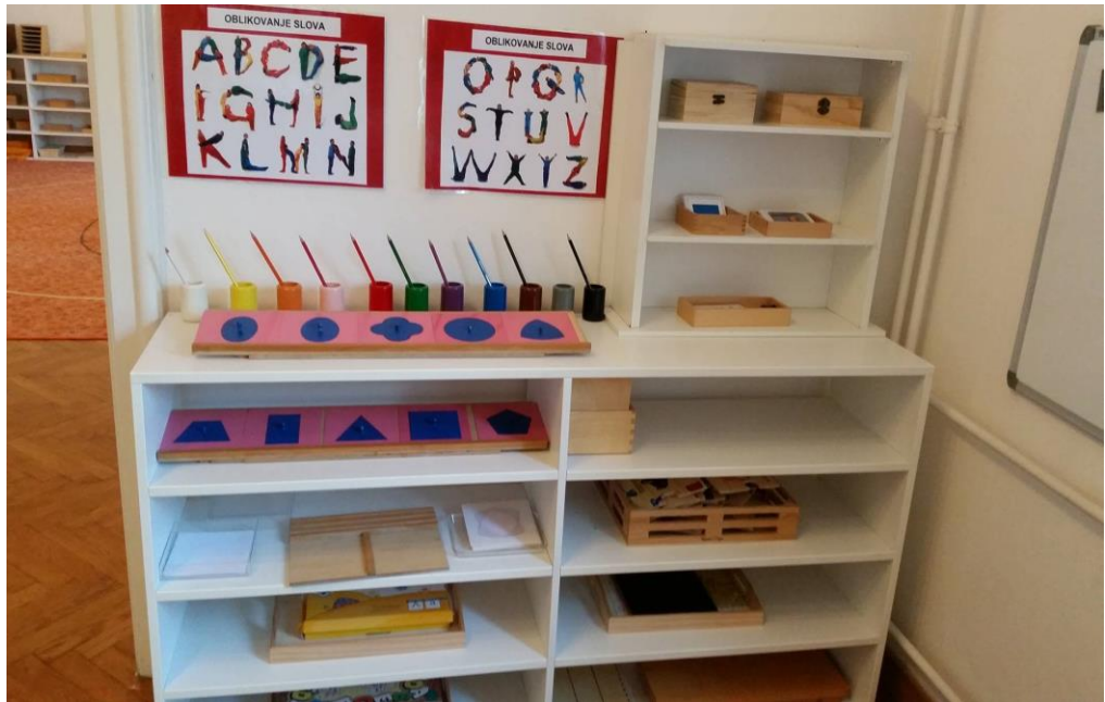
Slika 6. Materijali u centru za jezik