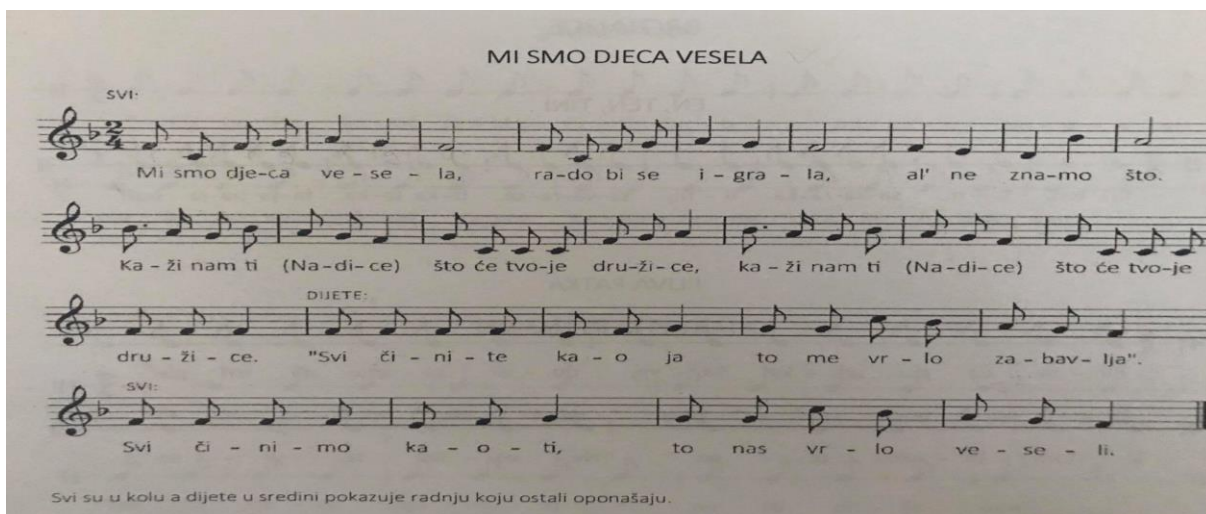
Slika 18. „Mi smo djeca vesela“