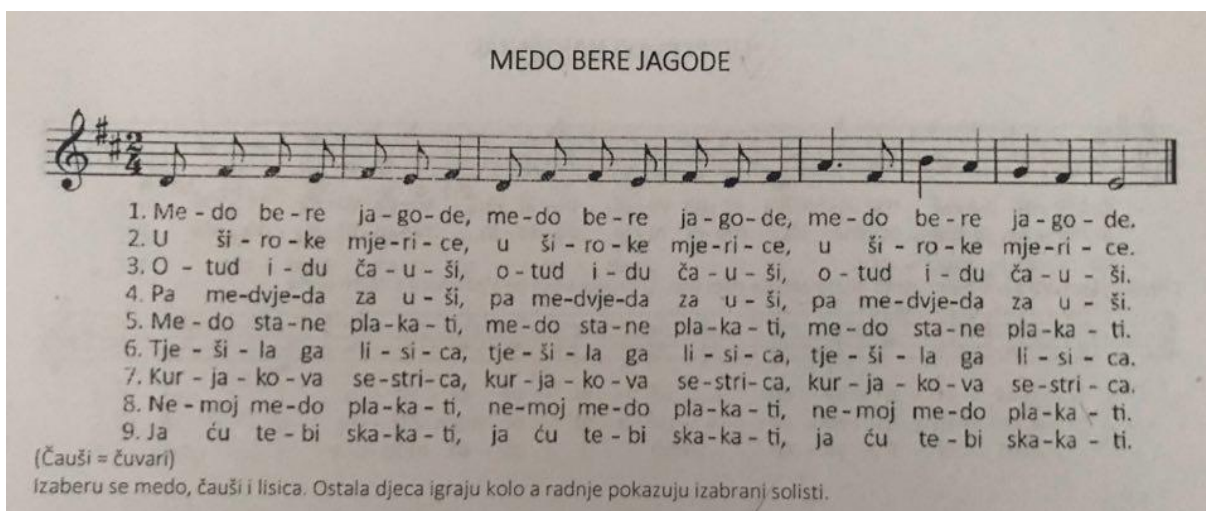
Slika 17. „Medo bere jagode“