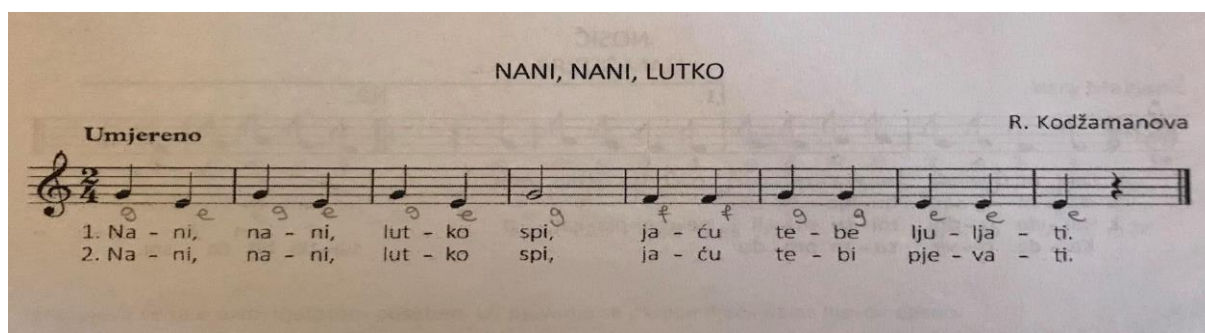
Slika 1. „Nani, nani, lutko“

1. Primjeri pjesama za rad s djecom mlađe dobi: