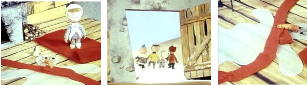
Slika 6. Skup sličica iz lutkarskog filma Srce u snijegu

Razvojne zadaće istaknute za ovu aktivnost u centru za stolno-manipulativne igre jesu: